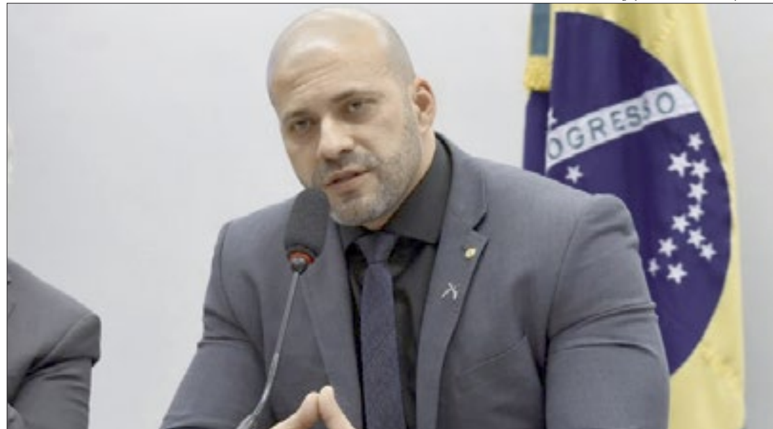
Daniel Silveira foi preso após ser acusado pelo STF de ter feito ameaças e defendido a destituição dos ministros

Após ser intimidado pelo deputado, o plenário se reuniu e referendou o mandato de prisão expedido ontem. Querendo ou não, deu o recado. Transformou uma decisão pessoal em posição da Corte e