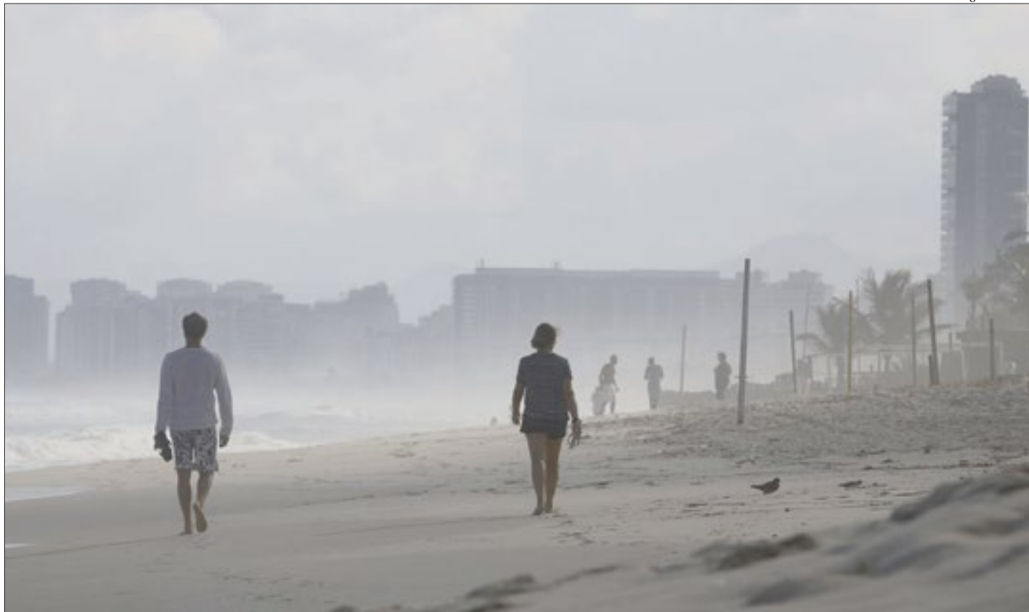
Cerca de 90% dos novos casos foram diagnosticados na capital. A cidade do Rio também concentrou a grande maioria dos óbitos, 105 (89%)

Enquanto isso, o prefeito Eduardo Paes afirmou que só haveria vacinas suficientes para serem aplicadas até terça, apesar de as segundas doses estarem garantidas para quem já tomou o imu-