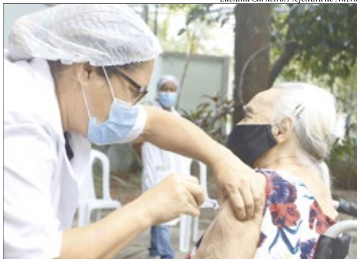
Policlínicas receberão os idosos de 8h às 16h e a vacinação vai até as 17h

A Prefeitura de Niterói vai ampliar a vacinação contra Covid-19 para idosos acima de 86 anos a partir desta quinta-feira (18). A Secretaria Municipal de Saúde (SMS) tem estoque para realizar a vacinação desta faixa etária em seis policlínicas e no drive thru da UFF. A vacinação para esse público terá prosseguimento na sexta-feira se houver doses disponíveis. A população deve consultar qual grupo está sendo convocado para a imunização nas redes sociais, no site oficial da prefeitura ( www.niteroi.rj.gov.br ) e pelo telefone 153. A Secretaria de Saúde está programando a vacinação contra a Covid-19 de acordo