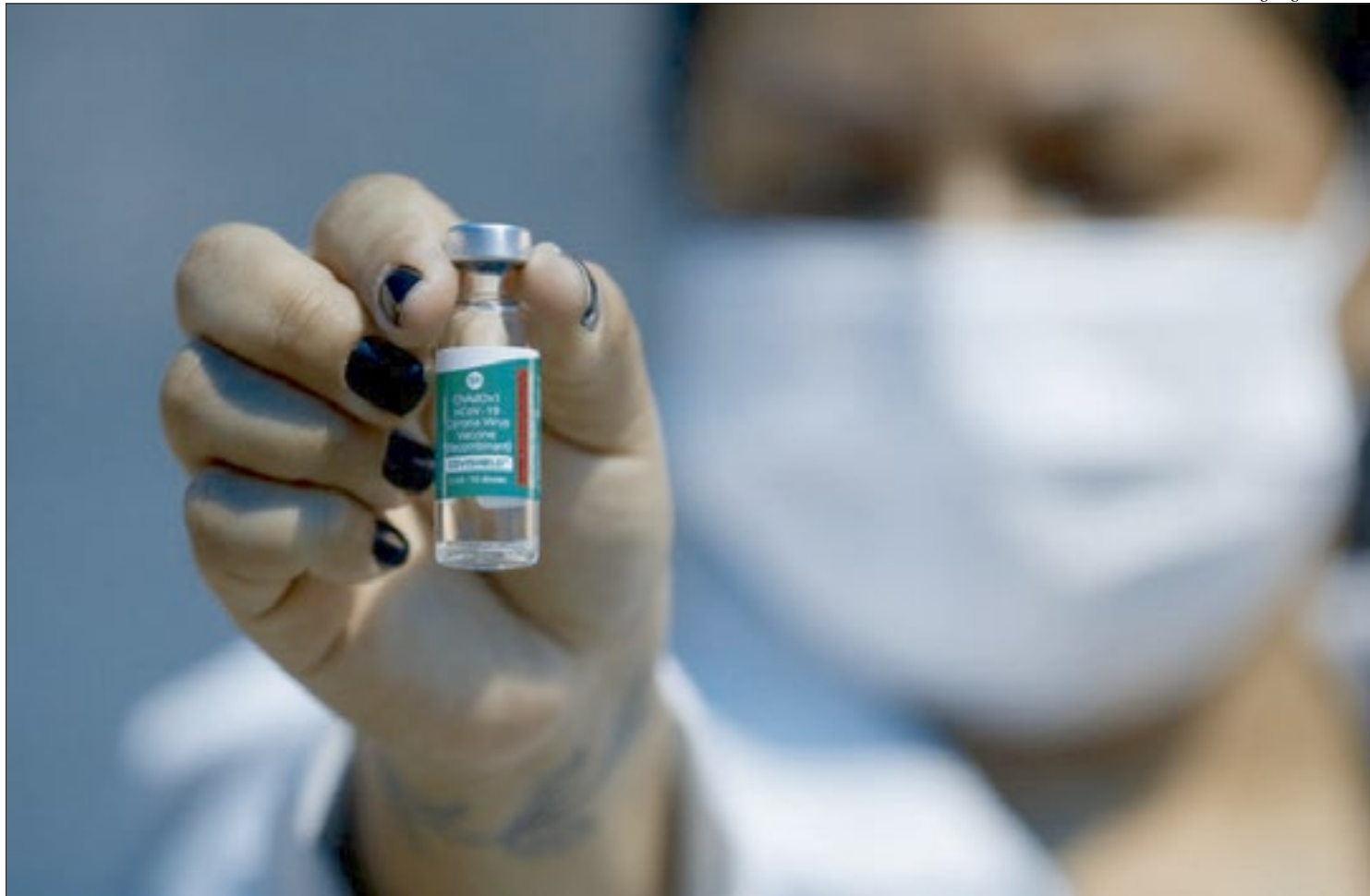
A campanha para aplicação da primeira dose da vacina contra a covid-19 na capital fluminense foi suspensa nesta quarta-feira por causa da falta de imunizantes

O secretário estadual de Saúde, Carlos Alberto Chaves, descartou a adoção no momento de um lockdown (bloqueio) das atividades como medida para conter a transmissão dessas novas variantes. De acordo com