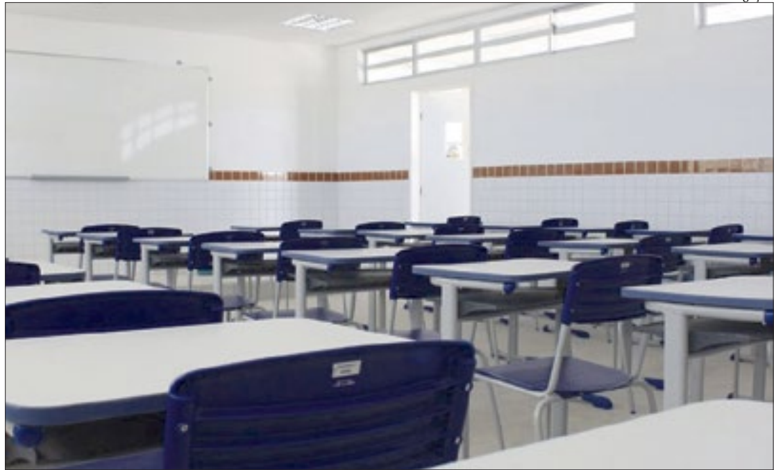
Primeiras escolas a retomarem as aulas no dia 24 são as que atendem aos critérios de infraestrutura e sanitários

"Não iremos pular etapas, as escolas precisam estar aptas para isso, no que diz respeito ao protocolo sanitário, ao reestabelecimento de serviços, às condições adequadas. A cada semana teremos o anúncio de escolas [que poderão reabrir], mas a ideia é abrir todas as escolas o quanto antes dentro das condições que a escola tem. Temos a urgência com isso, mas a urgência não se reflete de forma alguma em irresponsabilidade, muito pelo contrário, é questão de responsabilidade que possamos fazer o retorno presencial seguro", diz o secretário municipal de