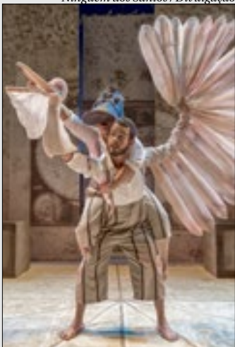
Evento que terá versão virtual