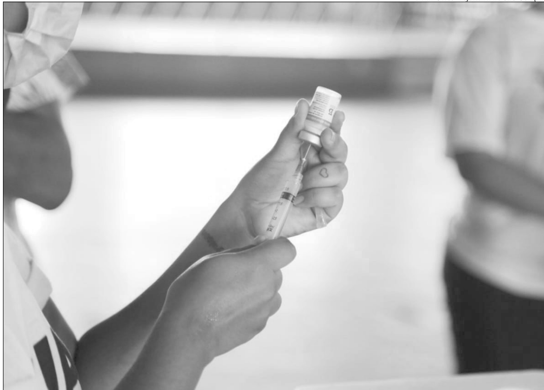
Renan Otto/Prefeitura de São Gonçalo

Os idosos com mais de 90 anos têm prioridade nas filas. E, diante das denúncias de "vacina de vento" em outras cidades, a secretaria está incentivando os acompanhantes dos idosos a filmarem e/