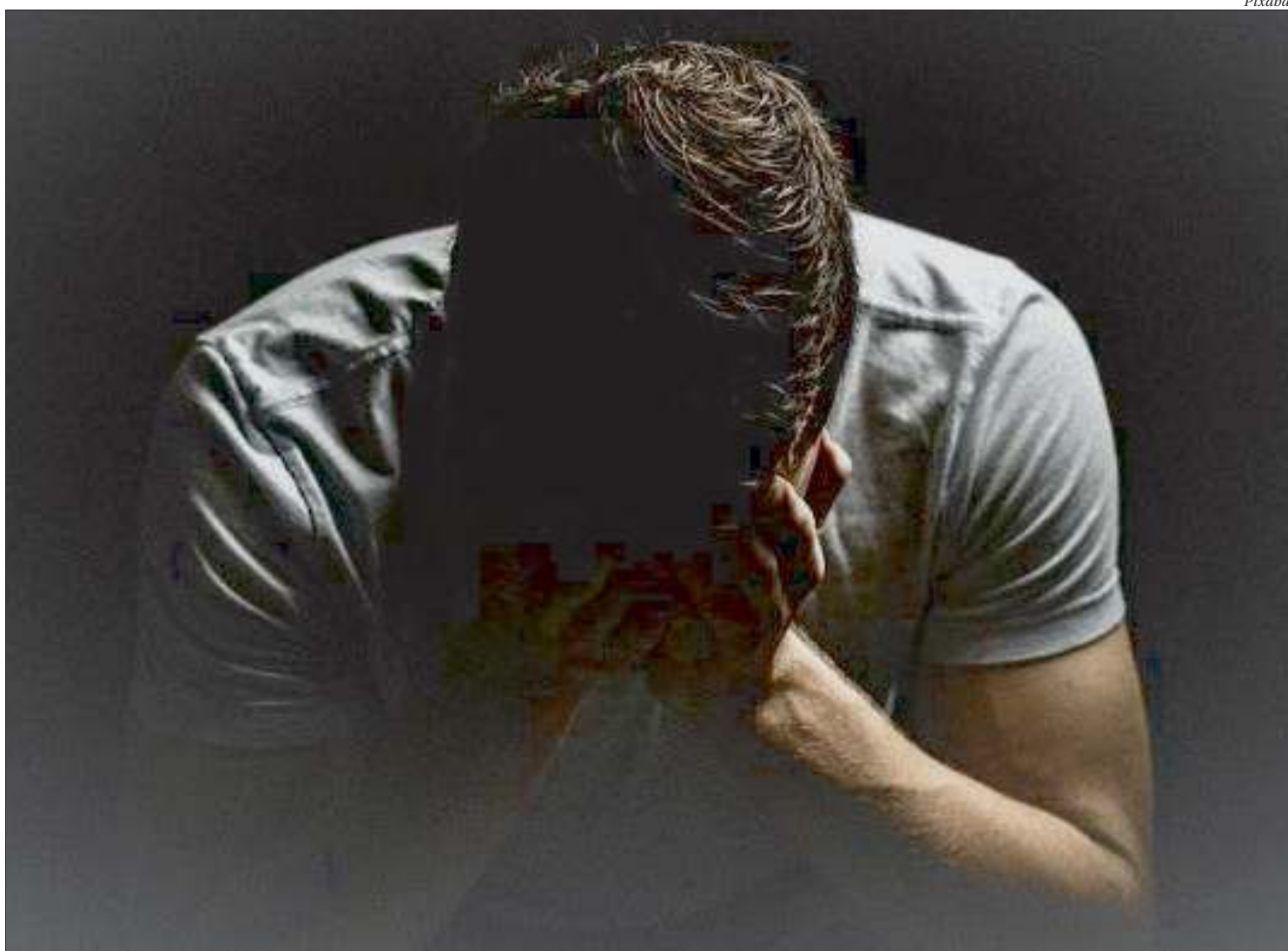
Deve-se tomar muito cuidado com o estresse. Estudos apontam que mesmo pessoas sem histórico de transtorno mental ter um gatilho para ansiedade e depressão

Sem saúde mental, evidentemente não há saúde. E como psiquiatra posso afirmar que a saúde mental é tudo, principalmente em momentos difíceis, de grande estresse ou crises como estamos todos vivendo agora. Alternativas saudáveis são fundamentais para lidarmos com o problema. A pandemia atual afeta a todos e a nossa saúde mental fica em claro risco de desequilíbrio. Nesta situação, mesmo uma pessoa que nunca teve transtorno mental, o estresse