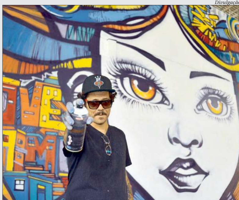
Trinta e sete artistas participam das ações de grafite que vão ressignificar espaços