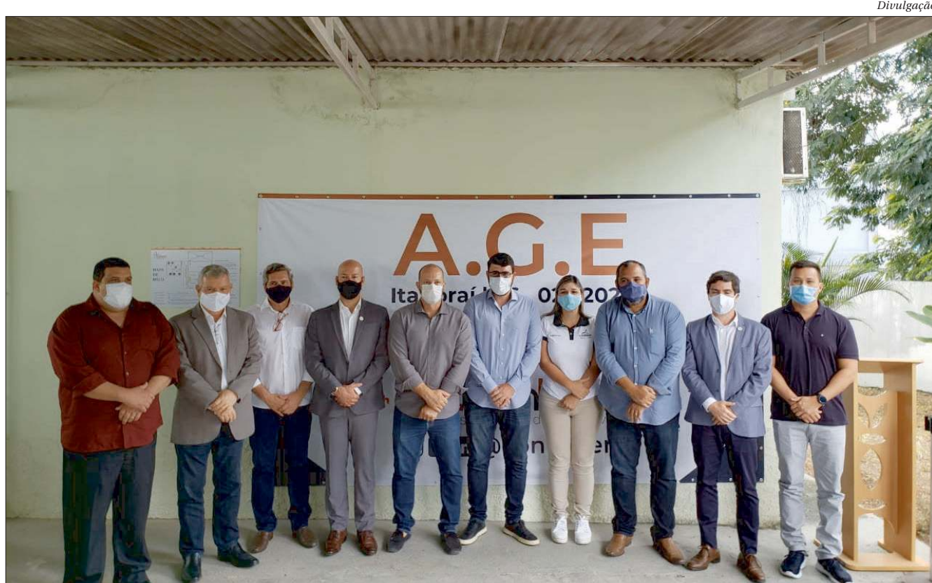
Prefeitos de 12 dos 16 municípios que integram o consórcio do Leste Fluminense participaram da eleição, sendo dois de forma virtual