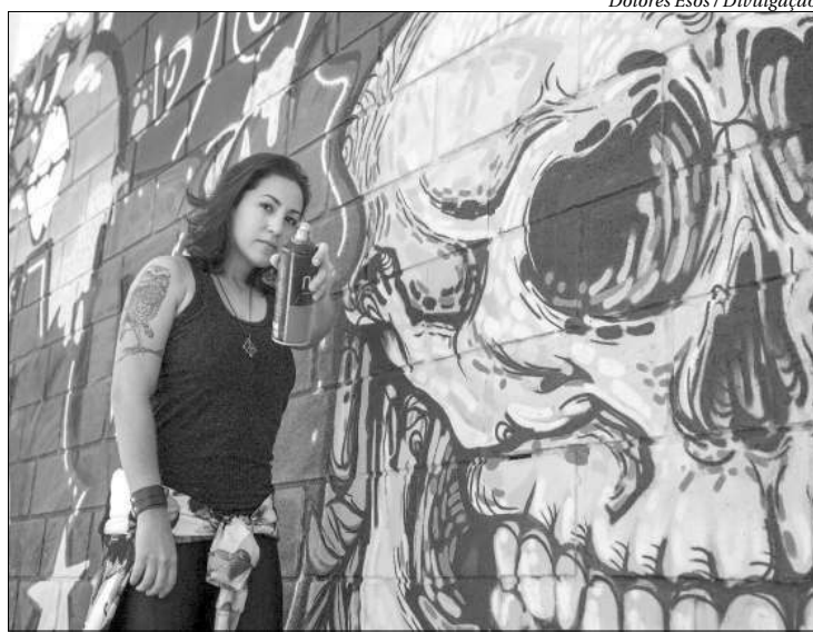
Dolores Esos / Divulgação

Entre fevereiro e março acontece o ‘Revitaliza Graffiti’, projeto que vai unir diferentes iniciativas de artes visuais no Rio. O objetivo é estimular moradores e artistas prejudicados durante a pandemia. Trinta e sete artistas participam das ações de graffiti que vão ressignificar espaços como a quadra esportiva da Chácara e um muro a Rua Almirante Alexandrino, na entrada para o Morro dos Prazeres, ambos em Santa Teresa.