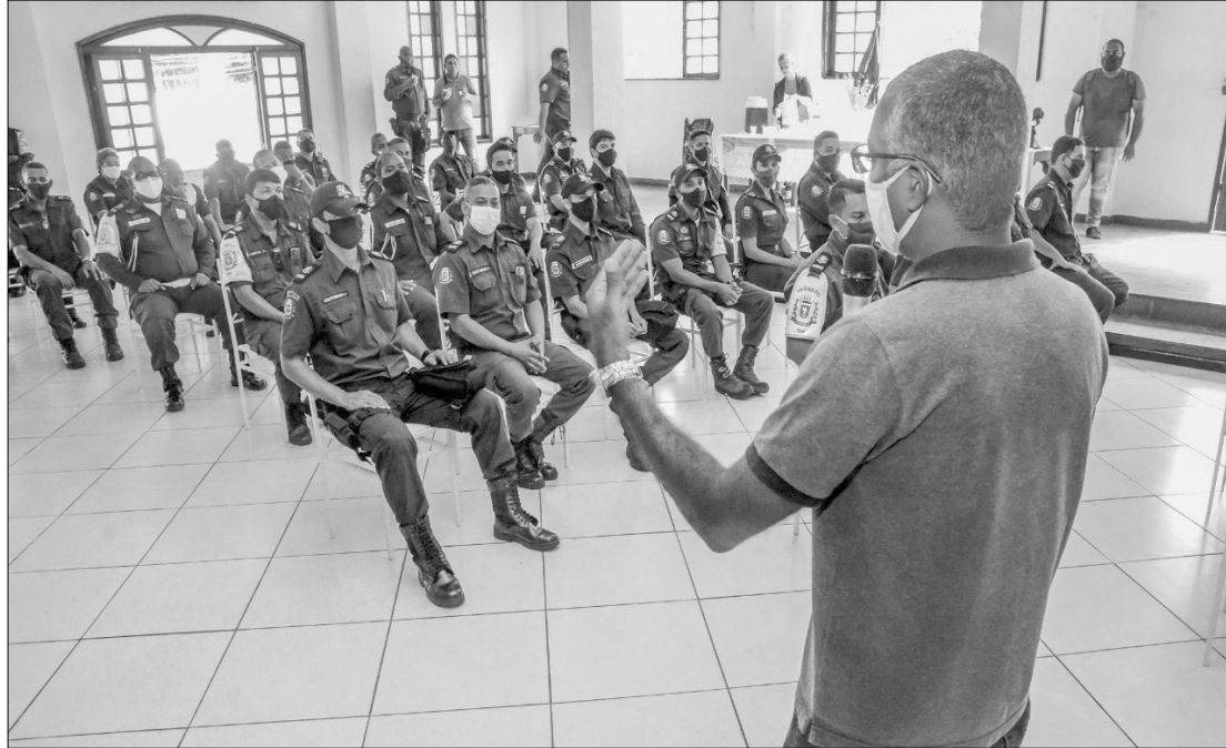
Cerimônia de lançamento do projeto de formação continuada da Guarda aconteceu no salão principal do Rotary

A próxima turma receberá a formação na na quarta-feira (3). Atualmente, a Guarda Municipal de Itaboraí conta com efetivo de 181 agentes, divididos em quatro setores: Grupamento de Especial de