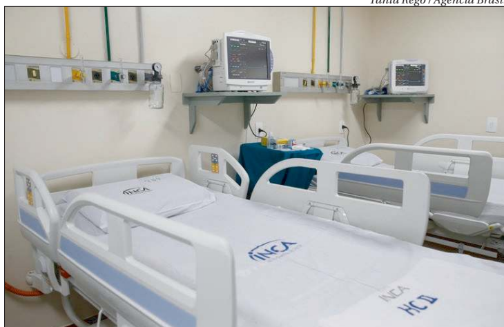
Boletim reforça a necessidade de medidas que promovam o isolamento

A proporção de leitos ocupados passou de 80% em 12 estados e no Distrito Federal, e 17 das 27 capitais do país também estão com percentual nesse patamar, chamada de "zona de alerta crítica" pelos pesquisadores.