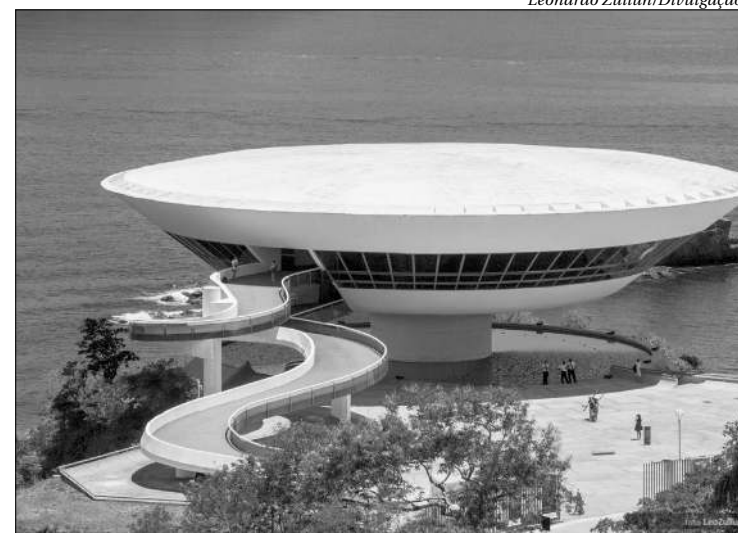
Museu de Arte Contemporânea: uma das referências do turismo em Niterói

Além do debate e troca de ideias sobre o turismo no Estado do Rio de Janeiro, os gestores tomarão conhecimento do Planejamento Estratégico da Setur/Turisrio, através do secretário estadual de Turismo, Gustavo Tutuca e, apresentação do Programa de