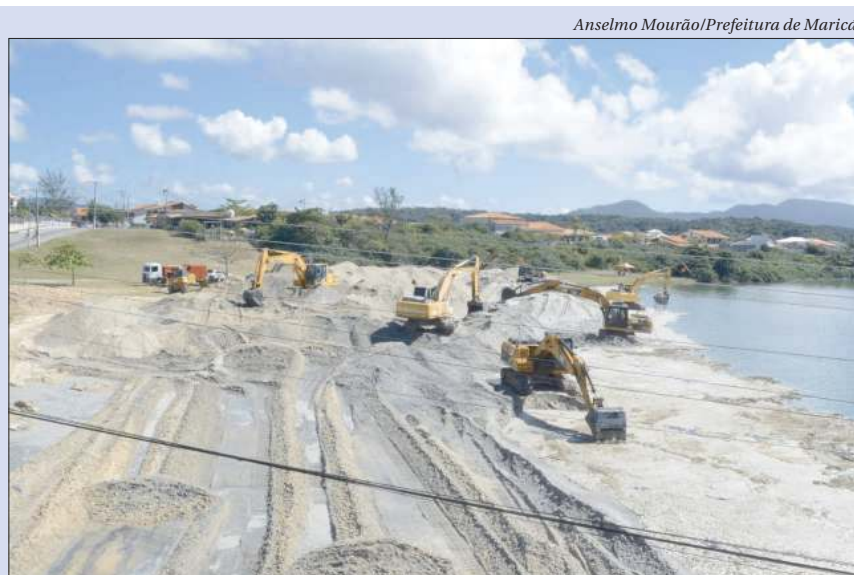
Abertura do Canal da Barra de Maricá permitirá renovação da água, evitando a mortandade de peixes