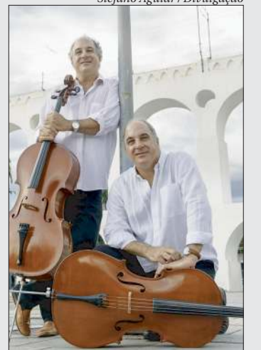
Gêmeos violoncelistas se apresentarão do palco do Teatro Popular