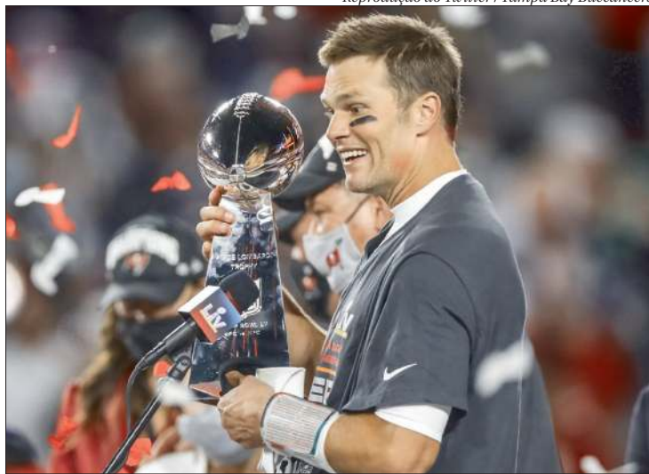
Tom Brady levou o Tampa Bay Buccaneers ao título da NFL na última temporada

"Em busca do 8º... LFG @ Buccaneers estamos mantendo o grupo unido", tuitou Brady.