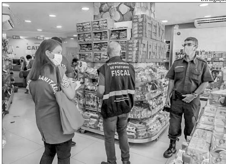
Objetivo dos agentes é conscientizar a população sobre o decreto

A ação teve início no último sábado (06/03) e perdurará até uma nova revisão dos indicadores estratégicos