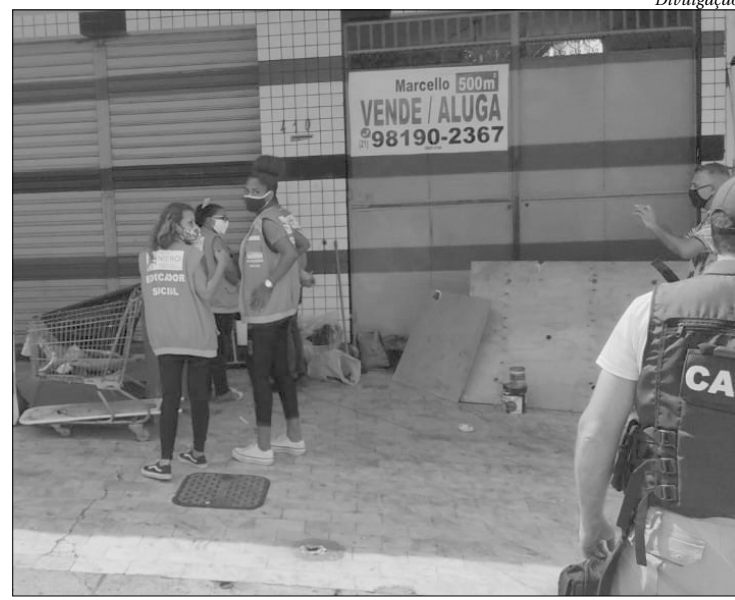
Seis pessoas em situação de rua foram abordadas pela equipe da prefeitura

“A Secretaria vem trabalhando na oferta de um conjunto de serviços socioassistenciais para atender a população mais vulnerável. Após as abordagens, o atendimento segue no Centro Pop com acesso a alimentação, higiene pessoal, contato com a família, retirada de segunda via de documentação civil, encaminhamento para atendimento na rede de saúde e acolhimento. O município possui uma rede de assistência social e segurança alimentar sólida e vem tentando atender a necessidade de todos que aceitam