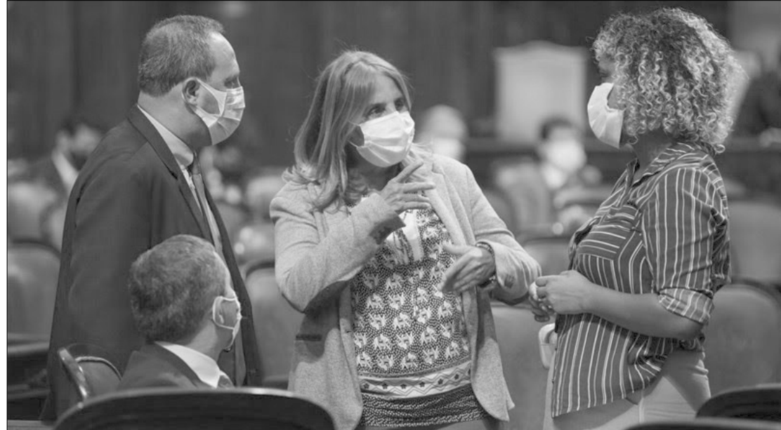
Alerj aprova lei que estabelece uma série de informações que devem constar nas placas de obras públicas

O novo texto estabelece que as placas deverão ter as seguintes informações: datas de início e de previsão de conclusão da obra; identificação da empresa executora; número do contrato administrativo ou processo licitatório correspondente; valor inicial do contrato e acréscimos que venham a ocorrer; telefone do órgão ou entidade responsável pela fiscalização da obra; telefone do órgão ou entidade junto a qual cidadão poderá reque-