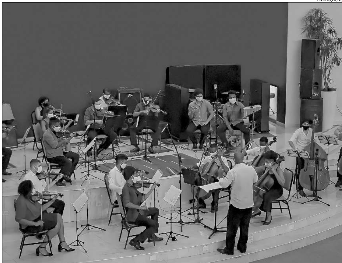
Projeto de inclusão social por meio da música atua há 26 anos em Niterói

Interessados podem se inscrever até dia 26. As audições serão no dia 30