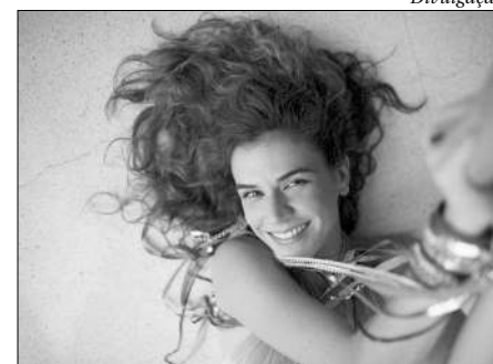
Neste sábado, 13 de março, a plataforma #CulturaEmCasa ( www.culturaemcasa.com.br ) transmite shows do músico Erik Escobar, da cantora Mariana Aydar, da cantora e compositora Céu e da compositora Alzira E. Os shows começam a partir das 12h.

A 9ª edição do Festival Internacional de Cinema Socioambiental de Nova Friburgo este ano será online, de 13 a 20 de março. No site www.fricine.com.br e nas redes sociais (@fricinefest).