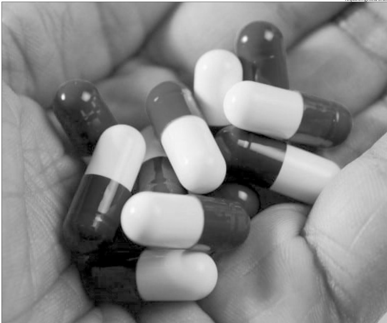
Os probióticos são "microrganismos vivos que, quando administrados em quantidades adequadas, conferem benefícios à saúde do hospedeiro"

O recém-nascido precisa das bactérias do canal de parto, da flora saprófita materna, para começar a sua colonização entérica, que vai permitir a ativação do seu sistema imune, indispensável para o bloqueio da tendência à alergia, como todos nós nascemos, até que aos 8 meses chegamos ao estado de sermos "imunologicamente normais".