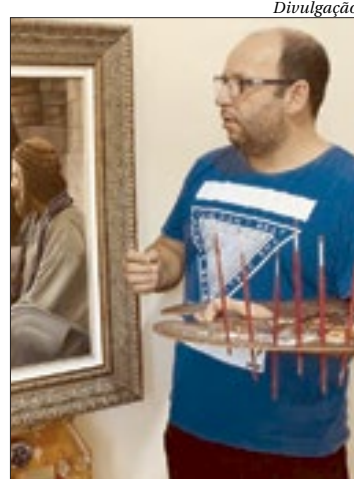
Em Itaboraí, “Fábio Escaleiro em Releituras Clássicas e Realistas”

Em Itaboraí, a Casa de Cultura Heloísa Alberto Torres abre a exposição “Fábio Escaleiro em Releituras Clássicas e Realistas”. A mostra, que reúne mais de 30 pinturas a óleo, fica aberta para visitação agendada e guiada. Entre os temas abordados estão a religiosidade, com diversas interpretações de cenas e passagens bíblicas, além da natureza, com animais e paisagens de grande beleza. Agendamento: WhatsApp (21) 98958-8727.