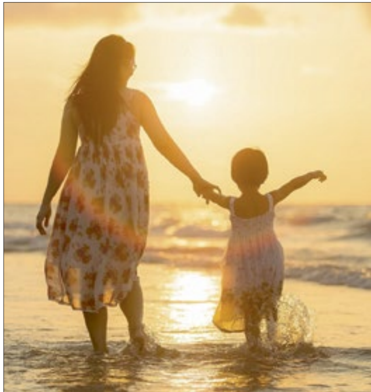
Neste momento de pandemia, o Dia das Mães é uma data muito especial

Ser mãe, um dom da natureza, capaz de dar à luz, de ser firme, de se superar, de além de ser mãe, ser esposa, dona de casa, cozinhar comidinhas gostosas e saudáveis para seus filhotes, trabalhar fora, muitas vezes agir como mãe de outros onde trabalha, sempre de braços abertos, de olhos abertos, a mente a mil,