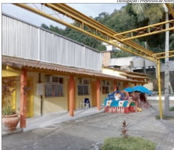
Também foi concluída a reforma da As UMEI Lizete Maciel, no Jacaré