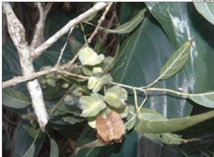
Esta planta apresenta grande valor madeireiro, sendo considerada uma madeira de lei

A ação contou com a participação de oito pessoas e obedeceu ao protocolo de segurança para preservação da