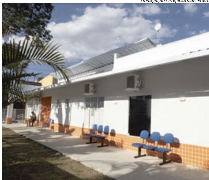
O Médico de Família de Matapaca está equipada com ar e acessibilidade

Também foram concluídas as reformas de três unidades educacionais: As UMEIs Margareth Flores, em São