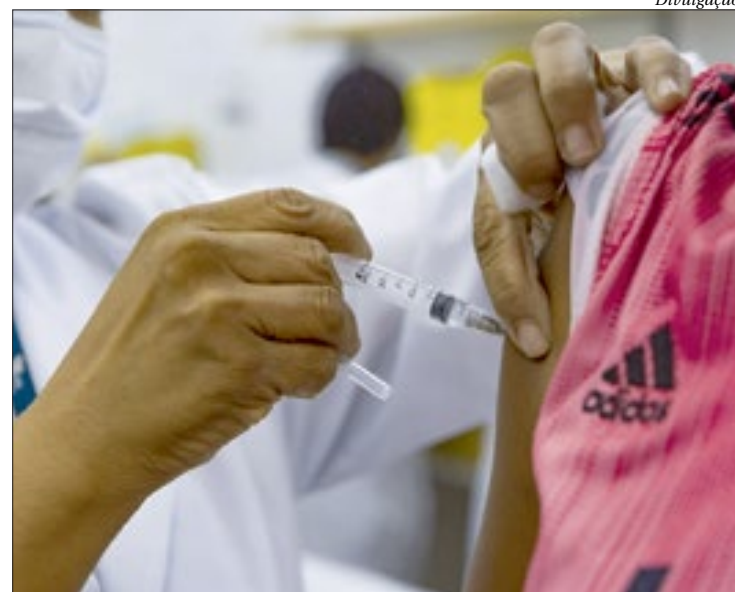
A imunização ocorre em três etapas, com a expectativa de vacinar cerca de 200 mil

A segunda fase vai até 9 de junho, quando começa a terceira e última etapa, para pessoas que têm comorbidades, bem como caminhoneiros, trabalhadores de transporte coletivo rodoviário urbano e de longo curso, trabalhadores portuários, forças de seguran-