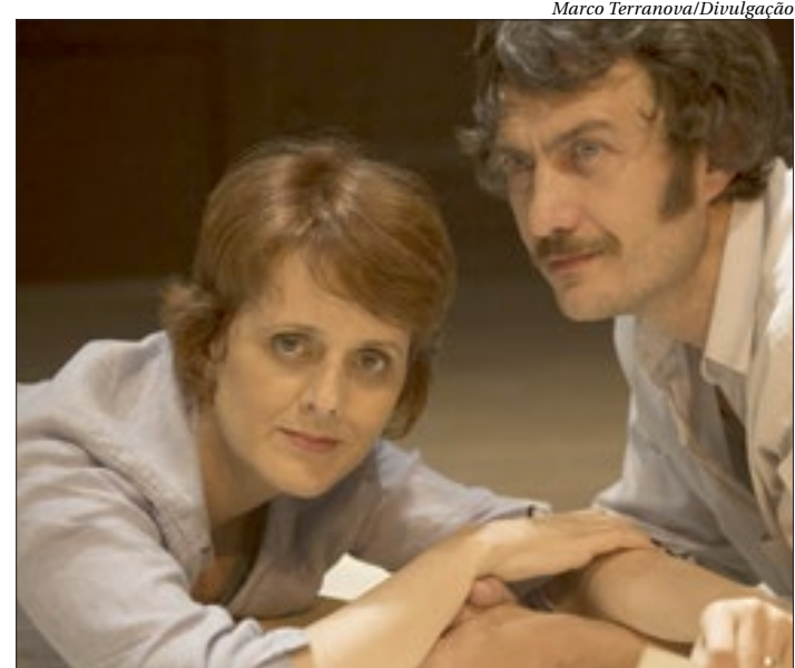
Peça ‘Inutilezas’ é a atração do #CulturaEmCasa, neste domingo, às 21h30

Lançada em 21 de abril de 2020, a plataforma tem como objetivo ampliar o acesso da população a conteúdos culturais de qualidade, 100% gratuitos e contribuir para estimular a difusão cultural para todo país, com conteúdos de várias linguagens artísticas.