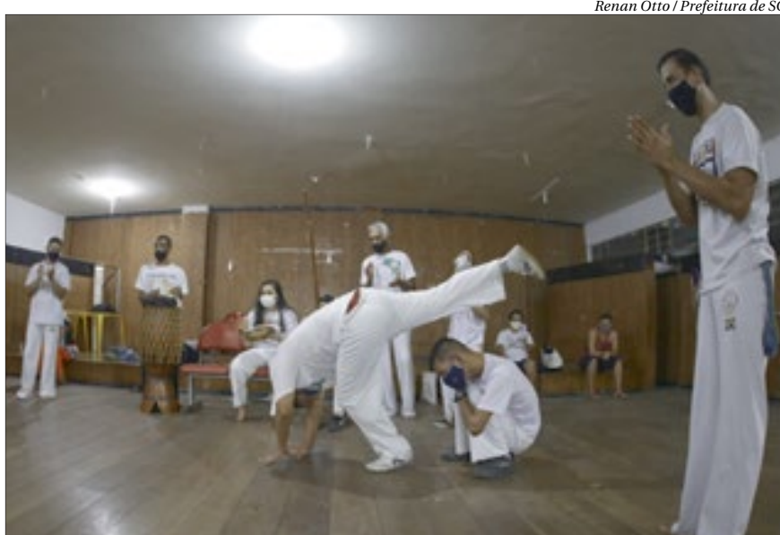
Iniciativa da Prefeitura de São Gonçalo oferece atividade para portadores de deficiências