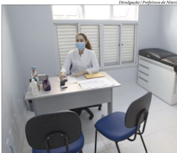
O Médico de Família Matapaca conta com cinco consultórios médicos

Francisco, e Lizete Maciel, no Jacaré, e a Escola Municipal Vila Costa Monteiro, no Atalaia. A formação de profissionais do ensino fundamental para o desenvolvimento do ensino remoto/híbrido foi uma das metas da área de Educação não apenas alcançada, como superada. A previsão era formar 1.577 profissionais e a marca atingida foi 1.681.