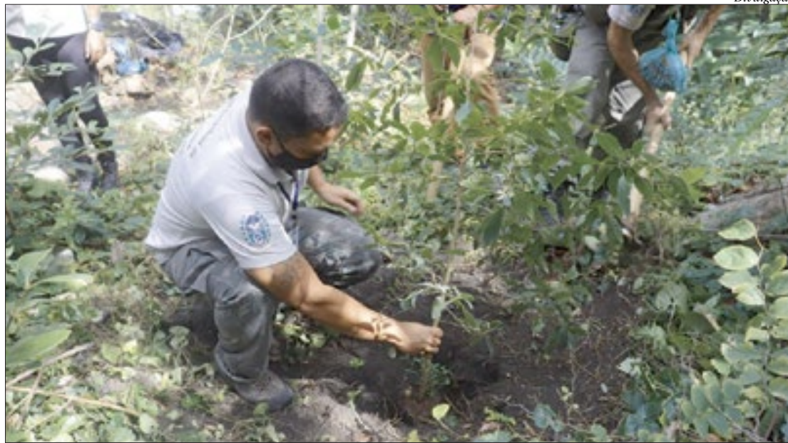
A Guarajuba é uma árvore de grande porte com troncos largos na base e mais finos na parte superior

"Até 2015, a planta era considerada extinta da natureza, pois sua última aparição foi