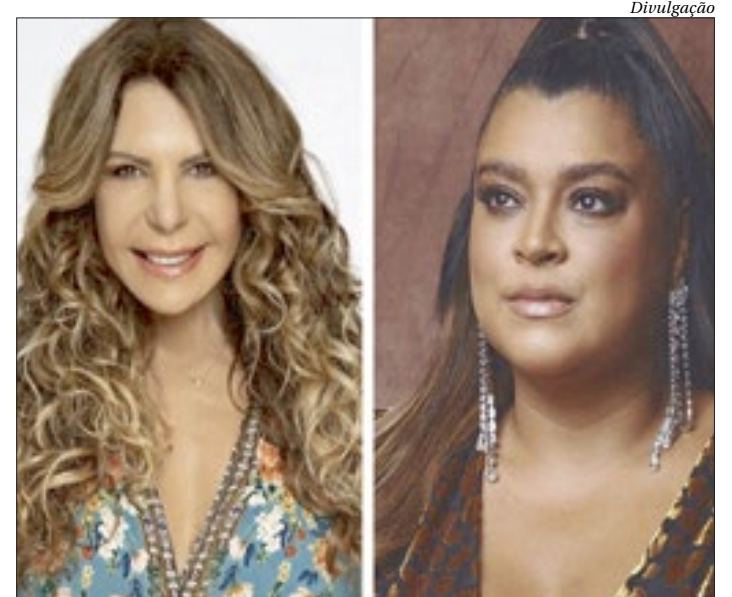
Elba Ramalho e Preta Gil são atrações do evento neste fim de semana

Além de curtir os shows, o público de casa poderá realizar doações, por meio de um QR Code que ficará disponível na tela durante as lives para o movimento 'Cidadania Contra a Fome' da Firjan/Sesi.