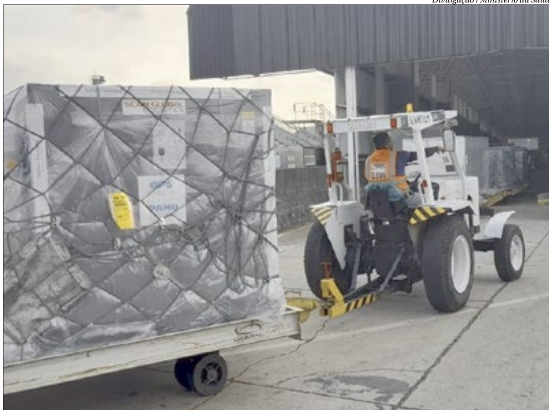
O insumo é o componente mais importante da vacina Oxford/AstraZeneca e tem sido trazido da China, onde é produzido

Apesar da paralisação na linha de produção, Bio-Manguinhos fará hoje (21) uma nova entrega de doses ao Programa Nacional de Imunizações (PNI). As 5,3 milhões de doses que serão liberadas começaram a ser produzidas semanas atrás e estavam em