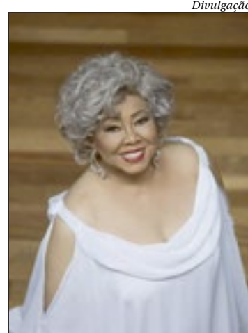
Alcione e Criolo fazem live para arrecadar doações para ONG

Alcione e Criolo se juntam em uma live inédita e beneficente, neste sábado. Preparem-se para um repertório emocionante e cheio de surpresas, com muito samba, a partir das 21h30. A transmissão acontece pelo Youtube e tem a missão de arrecadar doações para a ONG Ação da Cidadania, auxiliando no combate à fome. Para fazer sua parte, o público pode acessar um QR Code disponível na tela durante toda a apresentação.