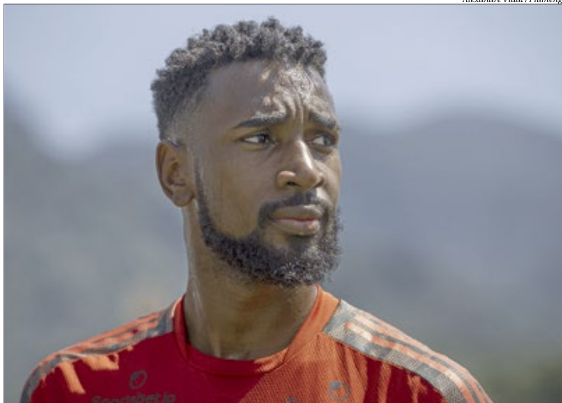
Um dos principais nomes do elenco rubro-negro, Gérson desperta o interesse do Olympique de Marselha, da França