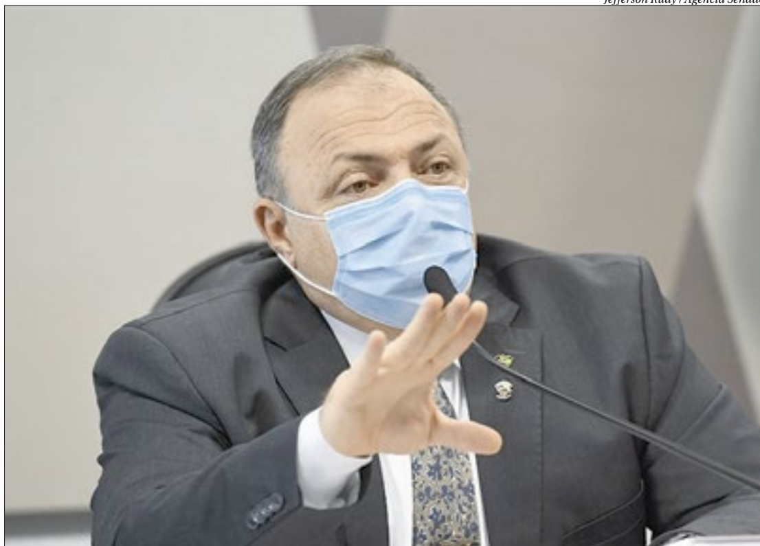
O ex-ministro da Saúde Eduardo Pazuello no segundo dia de depoimento à CPI da Pandemia

O senador Eduardo Braga (MDB-AM) rebateu. O parlamentar lembrou que apresentou um pedido formal de intervenção no sistema de saúde do Amazonas. Mas o pedido foi negado pela União.