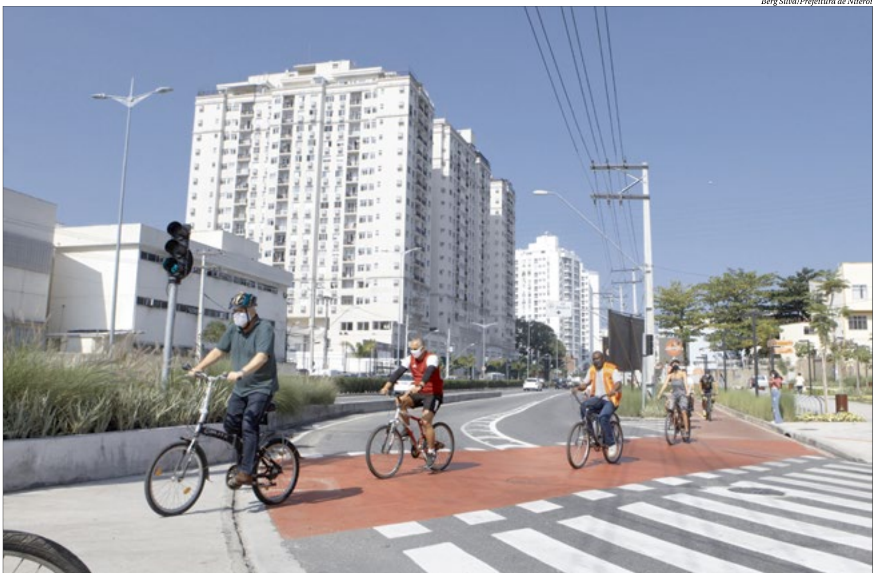
"Vim com um pequeno grupo de amigos que também trabalham na Prefeitura, aproveitando as cicloviárias da nossa cidade", disse o prefeito de Niterói, Axel Grael, após pedalada até o trabalho

O Dia de Bike ao Trabalho 2021 mobilizou ontem servidores da Prefeitura de Niterói. A iniciativa, promovida pela Coordenadoria Niterói de Bicicleta, incentivou a pedalada até o trabalho no lugar de carro ou ônibus. O prefeito Axel Grael foi pedalando até a Prefeitura. "Vim com um pequeno grupo de amigos que também trabalham na Prefeitura, aproveitando as cicloviárias da nossa cidade. Niterói tem vocação para a bicicleta, temos um clima agradável e um relevo propício", disse. Além dos 45 quilômetros destinados especificamente para a circulação de pessoas utilizando bicicletas, o município ainda conta com mais de 1220 paraciclos espalhados pela cidade. São cerca de 150 nas áreas próximas à Prefeitura.