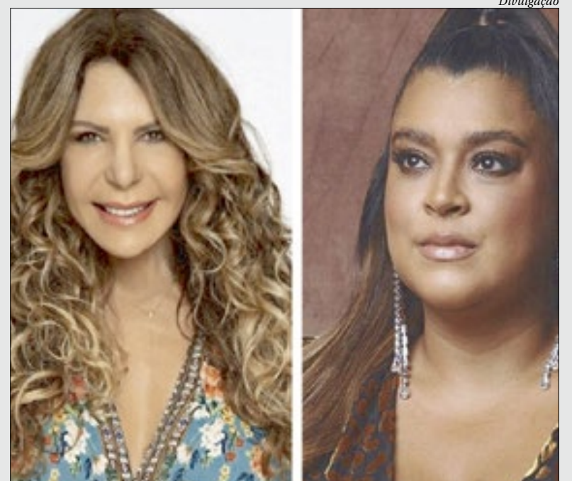
Elba Ramalho e Preta Gil são atrações do evento neste fim de semana