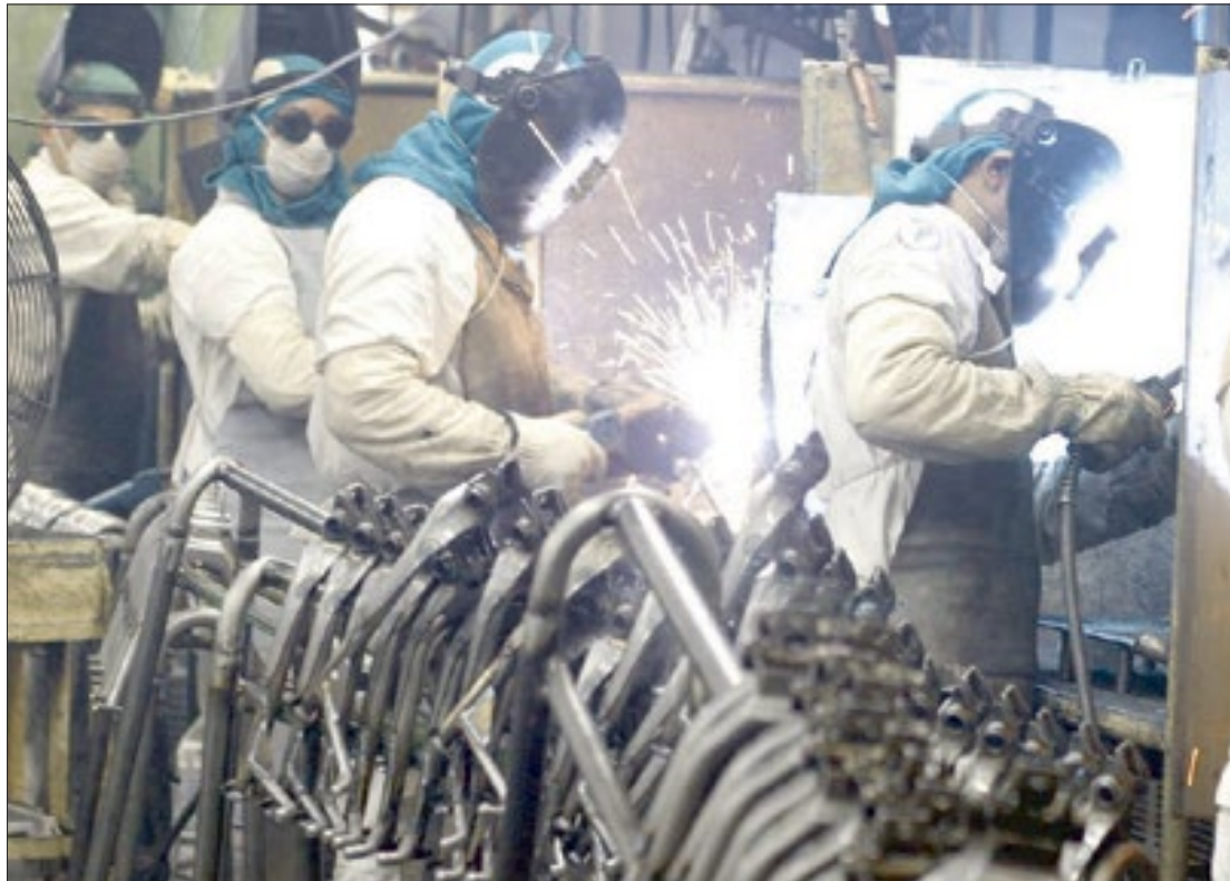
Levantamento da Firjan mostra que o Leste Fluminense gerou 2.352 vagas de empregos entre janeiro e abril de 2021

A análise específica da indústria da sub-região mostra que o setor gerou 1.723 novos postos de trabalho formais no acumulado deste ano. Novamente, Niterói (+738) e São Gonçalo (+699) também se destacaram positivamente neste período. Os setores que impulsionaram este resultado foram a construção civil (+697) e a manutenção, reparação e instalação de máquinas e equipamentos (+515).