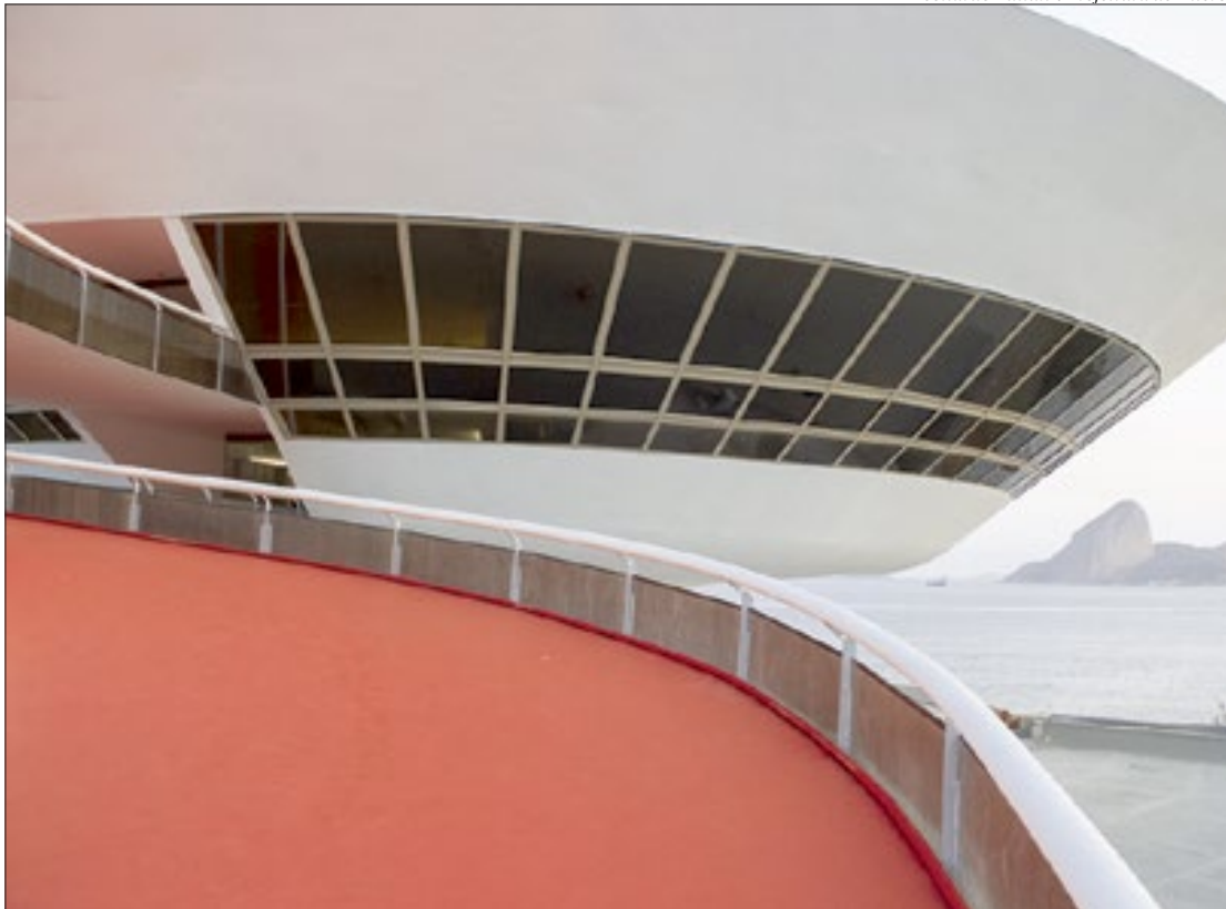
Museu de Arte Contemporânea de Niterói (foto) e mais o Museu do Ingá e o Solar do Jambeiro integram o circuito

Quem nunca jogou “Pokémon Go” pelo menos já ouviu falar neste famoso joguinho, que interage com o mundo real a partir da caça às criaturas fictícias, com um aplicativo de celular. O mundo moderno sugere inovações, que envolvem realidade e ficção, por meio da tecnologia. E, por isso, a Cultura Niterói adere ao novo projeto “Salvaguarda Digital: Passaporte Ingá-Boa Viagem”, que tem a proposta de focalizar o desenvolvimento de um game capaz de mudar a forma como as pessoas se relacionam com os patrimônios culturais da cidade e seus territórios, sugerindo circuitos de visita e interações por meio de realidade aumentada.