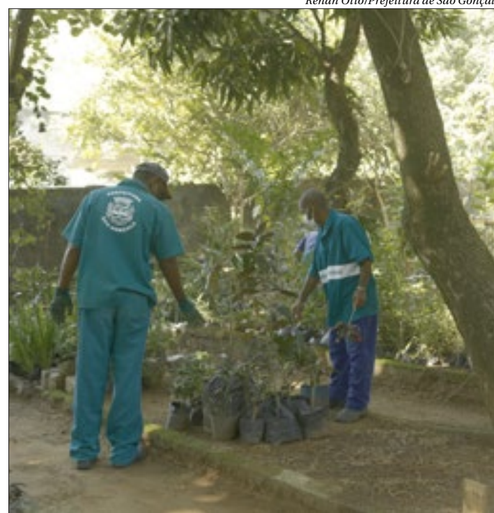
Paisagismo e requalificação urbana irão valorizar as vias de acesso à cidade

Esse planejamento vai definir regras para novos plantios e evitar problemas futuros com a arborização, como galhos que venham a atingir a rede elétrica de alta tensão e moradias, e levará também em conta, a acessibilidade aos cadeirantes e pessoas com dificuldades de locomoção. Será um diagnóstico sobre a situação da arborização urbana em toda a cidade de São Gonçalo.