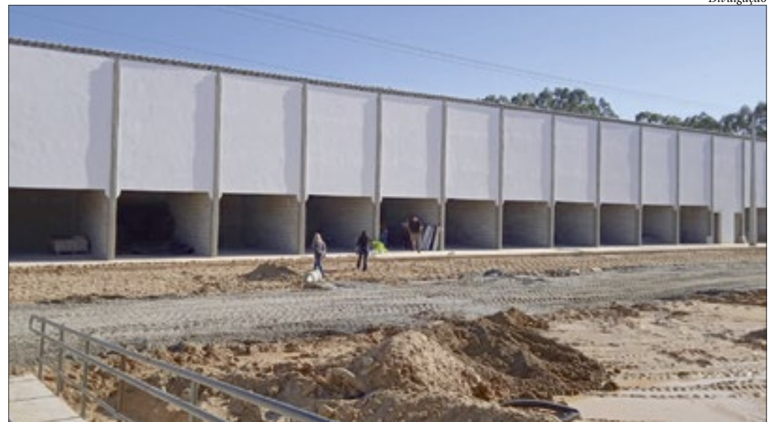
Presidente da AgeRio visita hoje as obras. Agência de Fomento financiou R$ 14 milhões em forma de empréstimo

No local serão comercializados, no atacado e varejo, produtos hortifrutigranjeiros, bebidas, carnes, pescado, embalgens, lanches, refeições, rações e outros. Mais de 70%