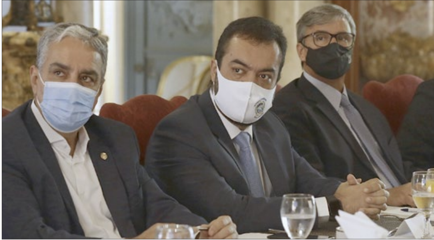
O governador Cláudio Castro entre o presidente da Alerj, André Ceciliano, e o presidente do TJ, Henrique Figueira. Também participaram outras autoridades

“Este não é um regime do governo, mas de todos nós, do Estado do Rio de Janeiro. Temos que trabalhar juntos, em parceria, para buscar as