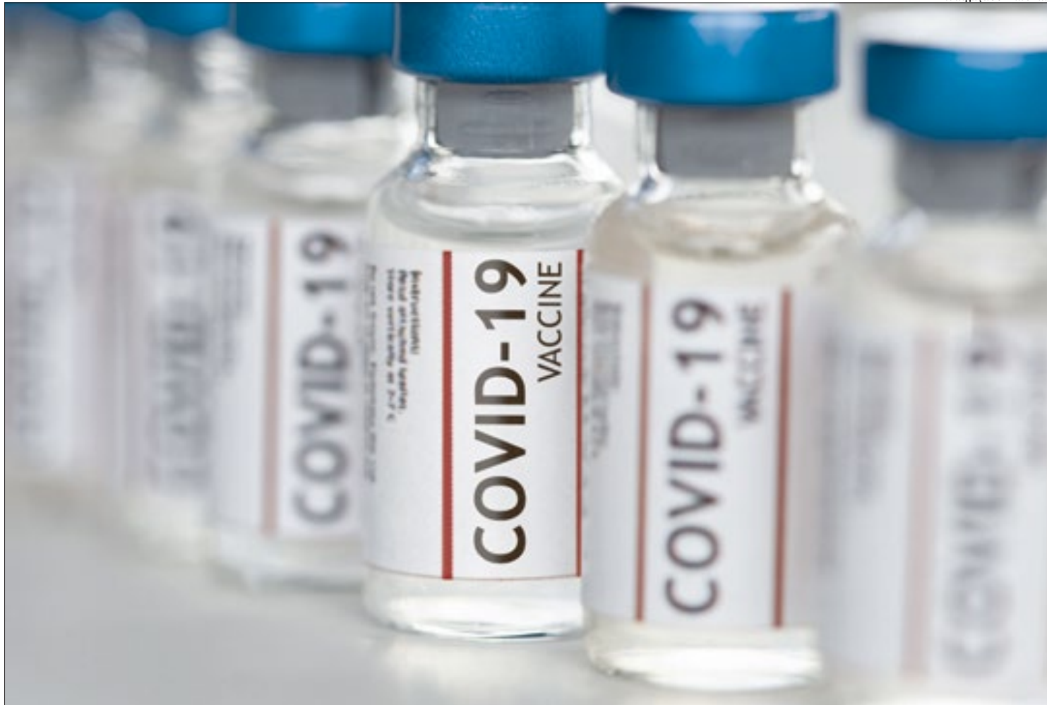
De acordo com o Ministério da Saúde, este mês serão entregues mais de 12 milhões de doses da vacina. Total até o fim do ano serão 200 milhões

O Ministério da Saúde anunciou a distribuição de mais 4,04 milhões de vacinas para combater a pandemia de covid-19. Deverão chegar em todas as capitais, até a madrugada de hoje (10), novas doses