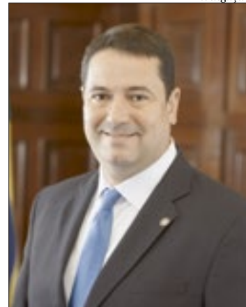
Léo Vieira está à frente da Secretaria de Trabalho e Renda

feito de 2005 a 2008. Em 2019, foi eleito deputado federal. Na administração estadual, ocupou a presidência do Detran entre 2017 e 2018.