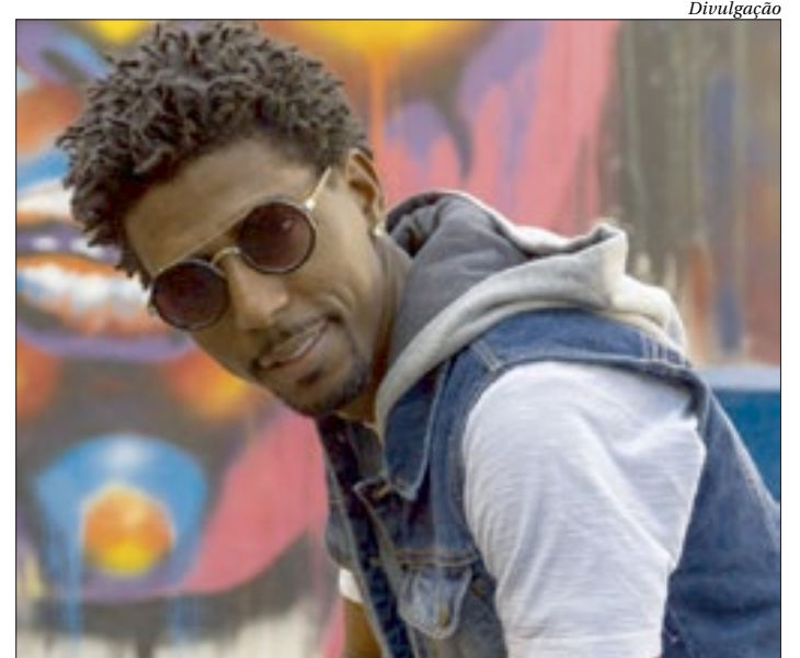
O cantor apresenta o show "Relendo Canções", nesta terça, pelo Instagram

O músico tem composições gravadas por grupos de pagode e funk de Niterói, além de uma música lançada pelo cantor Buchecha ( https://bit.ly/3dlwnV3 ).