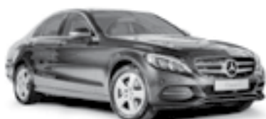
C 200 Avantgarde

Sistema envolvido: diodos do alternador.