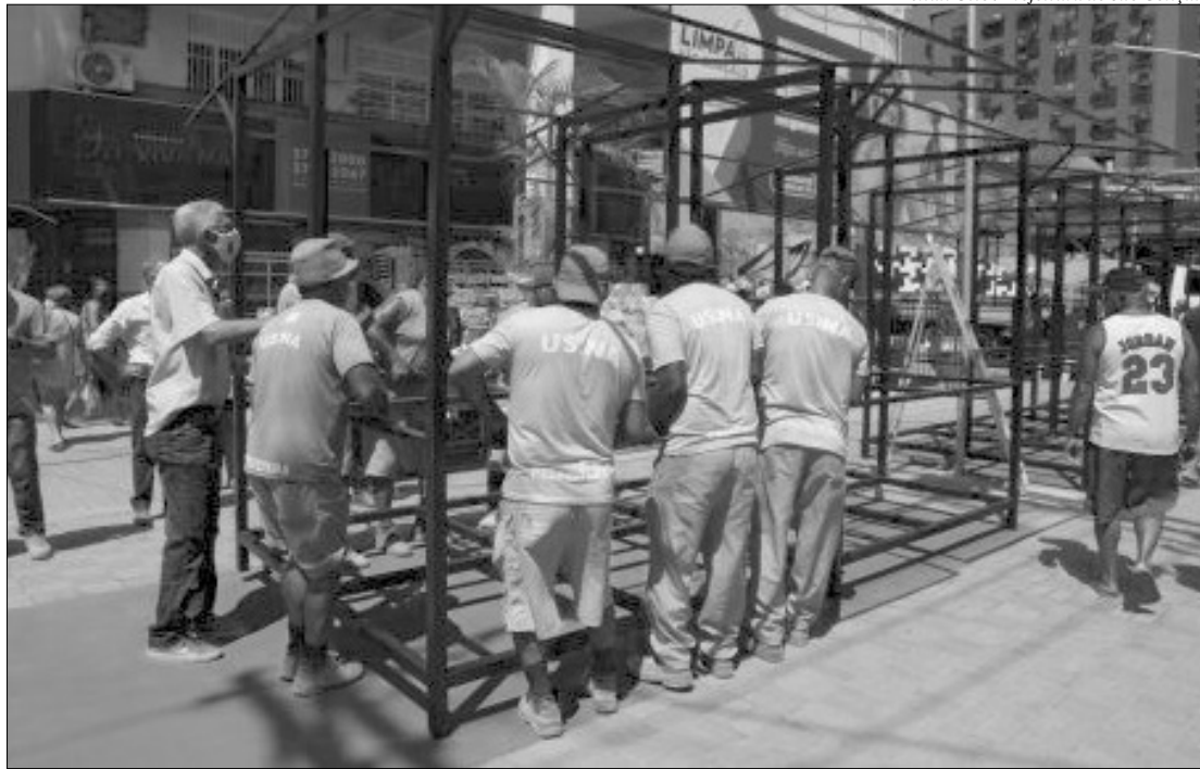
O prefeito Capitão Nelson foi acompanhar de perto a chegada das primeiras barracas no Alcântara

O bairro Alcântara vem recebendo, desde o início de 2021, uma série de ações de melhorias, com ordenamento urbano, reforço na fiscalização de trânsito, ações de limpeza