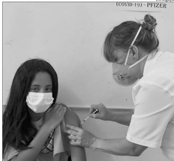
Objetivo é concluir a vacinação deste grupo na próxima semana

Para receber o imunizante, as crianças precisam ter intervalo de 15 dias de qualquer vacina. A criança tem que estar acompanhada de um responsável legal que deverá estar de posse da carteira de vacinação do menor. A vacinação deste grupo acontece na Policlínica Sérgio Arouca (Vital Brazil), Policlínica Regional de Itaipu e Policlínica Regional Dr. Renato Silva (Engenhoca). A imunização está disponível de segunda a sexta-feira, das 08h às 17h, com entrada até 16h.