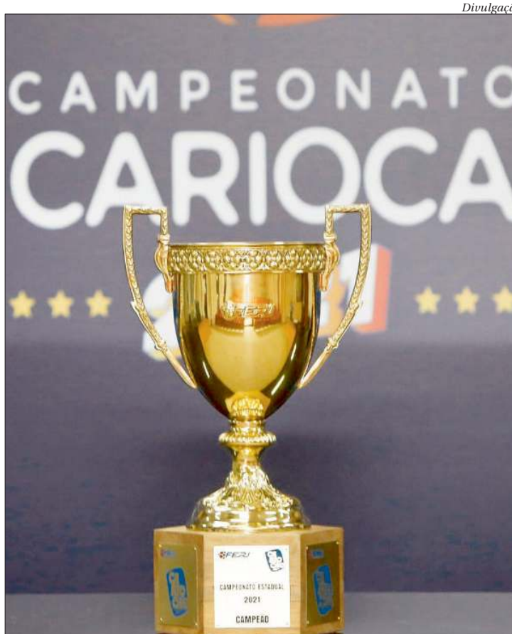
Doze clubes começam hoje a disputa pelo título do Campeonato Carioca 2022