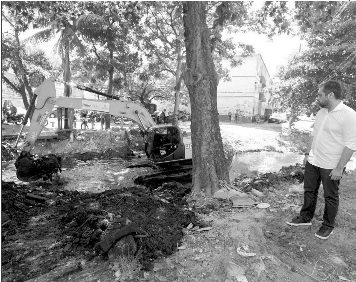
Cláudio Castro foi acompanhar de perto o início do programa Cidade Integrada, no Jacarezinho. População da região sofre há anos com diversos problemas

Na Escola Luiz Carlos da Vila, estão previstas pintura, requalificação do espaço e restauração da piscina, da quadra esportiva e dos telhados, além da impermeabilização de caixa d'água e cisterna. A ideia é que a escola se torne um complexo de lazer para a comunidade, com área de convivência. Também começaram as obras de revitalização da Praça 15 de Agosto, as melhorias na Quadra do Mosquito e no Campo do Abóbora e as intervenções na futura sala do Detran, na Escola Unidos do Jacarezinho, onde também funcionará a Corregedoria da Polícia Militar.