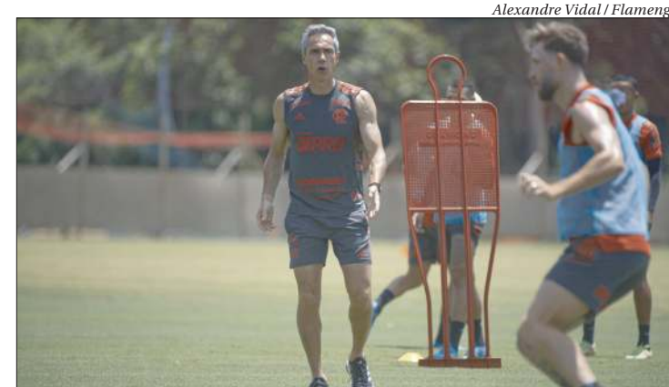
O técnico português Paulo Sousa terá a missão de levar o Fla ao inédito tetracampeonato