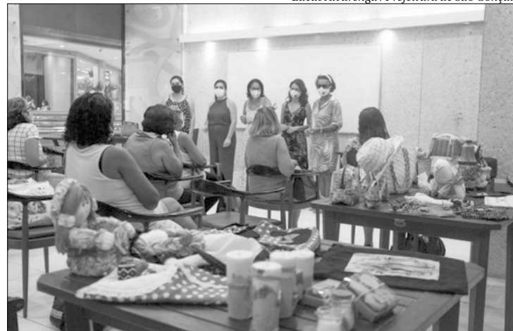
Lidera Mulher incentiva o empreendedorismo gonçalense

“Já trabalho com artesanato há um tempo e essa capacitação contribuiu muito para minha profissionalização. Além de todo o conhecimento adquirido, ter esse espaço para exposição é de suma importância para nosso crescimento profissional”, disse