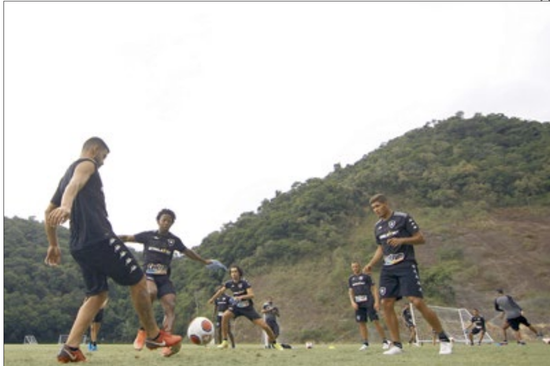
O elenco do Botafogo treinou forte para buscar a primeira vitória no Campeonato Carioca, domingo, contra o Bangu