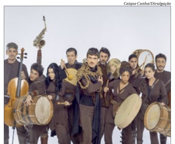
Peça infantojuvenil é uma história sobre a descoberta dos sentidos

Os ingressos custam R$30 (inteira), à venda na bilheteria ou no site eventim.com.br .