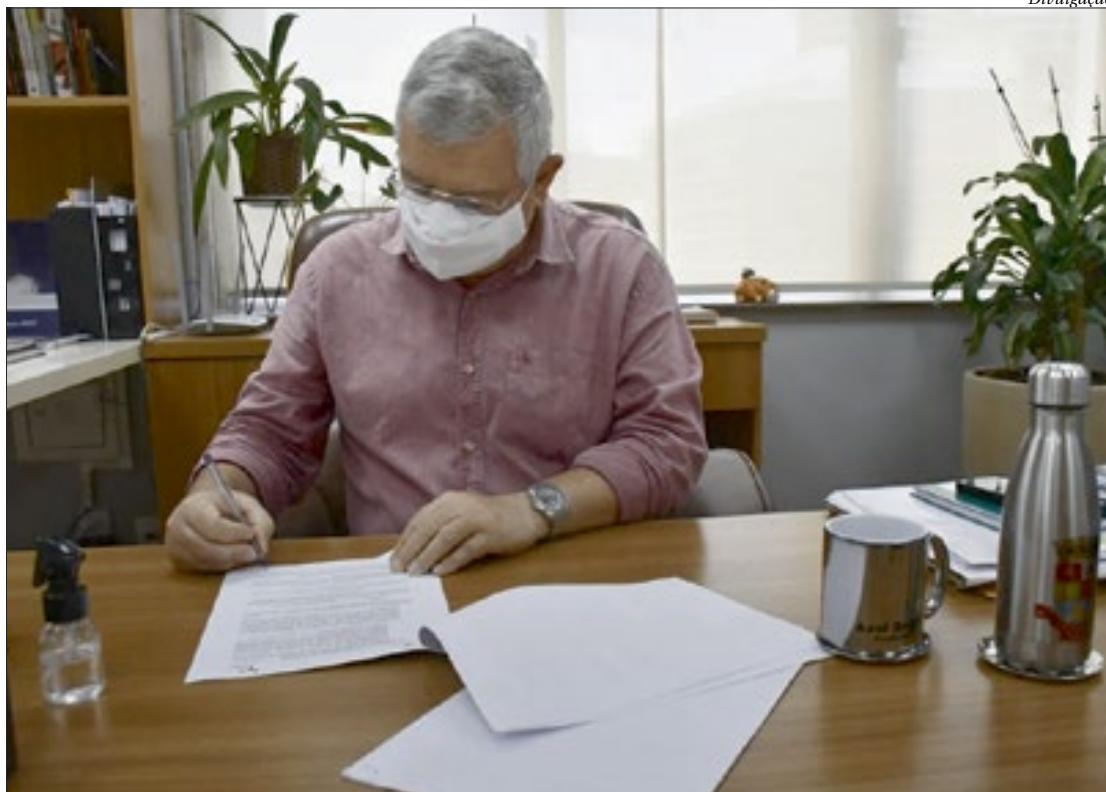
Prefeito Axel Graef assinou na última sexta-feira (28), o protocolo de intenções para a participação no Programa

A seleção foi realizada em parceria com a Fundação Lemann e levou em consideração a pluralidade de perfis de liderança (gênero, etnia e partidos políticos) e diversidade de regiões brasileiras. A instituição também priorizou prefeituras cuja gestão tenha um perfil de inovação, com