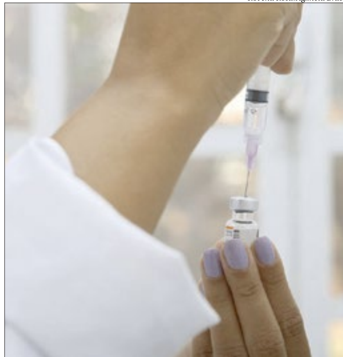
A ciência segue na luta para aprimorar as drogas e acabar com o vírus

Devem ser ministradas duas doses do imunizante, com distância de três semanas