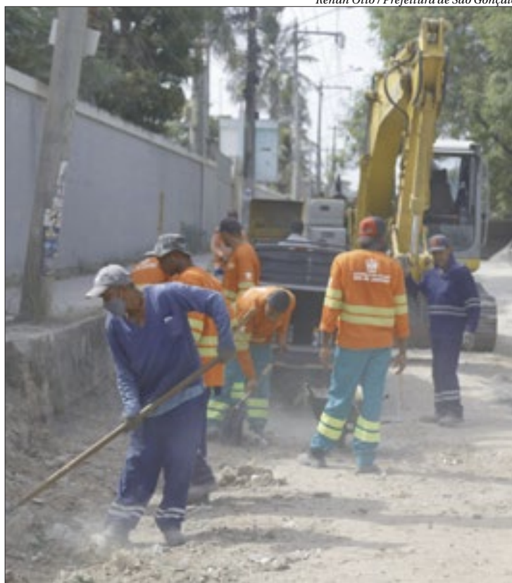
Equipes trabalham em ritmo acelerado nas obras de infraestrutura no Bichinho