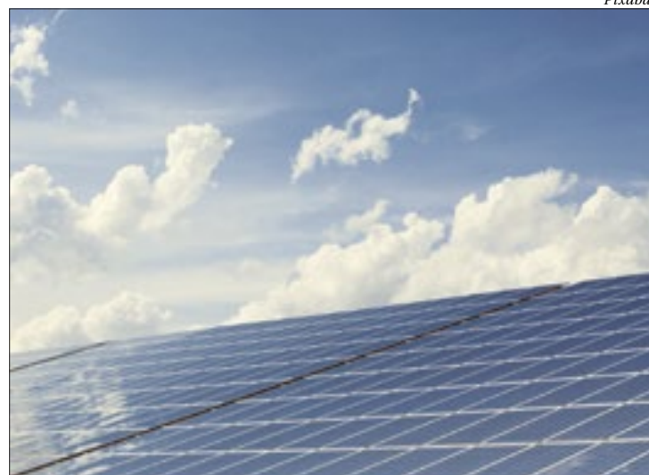
Usina fotovoltaica terá o investimento de R$ 10 milhões, através da Faperj

O projeto conta com o apoio de pesquisadores de diversas áreas, entre eles professores dos departamentos de Engenharia Elétrica, Telecomunicações e Civil da UFF. Paralelamente, a rede de pesquisa tem interação com grupos da PUC-Rio, da Universidade de São Paulo (USP), da Universidade Federal do Pará (UFPA), além da parceria internacional com a Universidad Politécnica de Madrid (UPM), da Espanha.