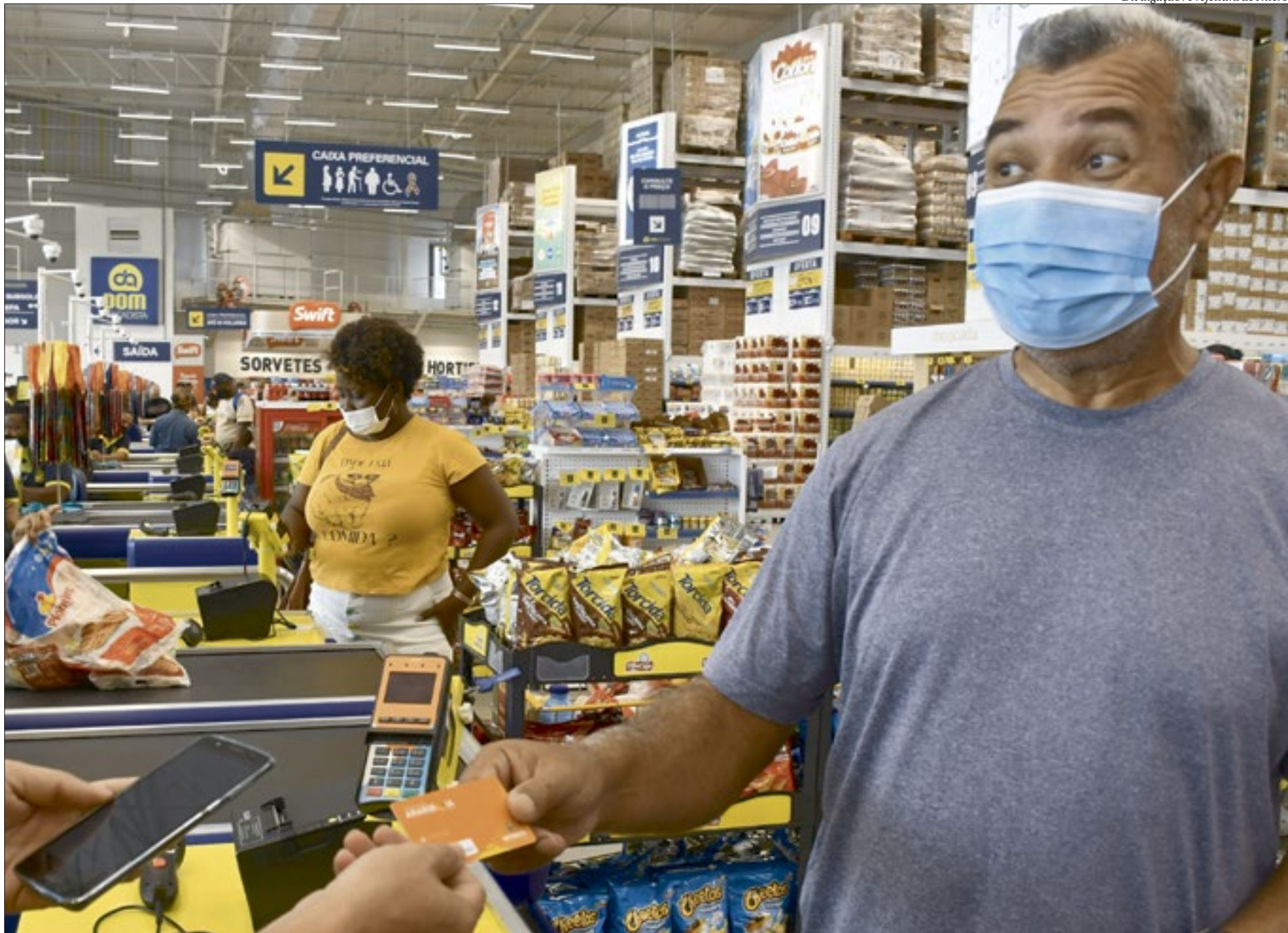
Os niteroienses contemplados já começaram a utilizar a moeda social nos estabelecimentos da cidade. Mais de 6.200 comerciantes estão aptos a receber o pagamento na moeda social

apenas um programa de transferência de renda, mas nasceu com a perspectiva de mudar a lógica de comércio na cidade dando vida a economia solidária nos