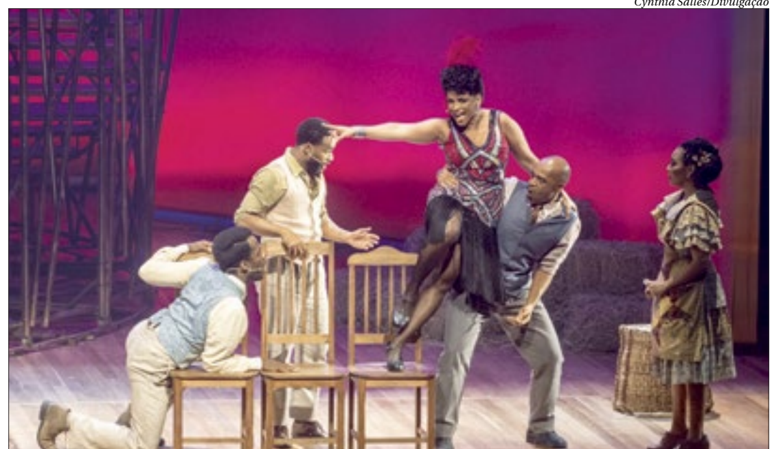
A apresentação acontece às 18h. O espetáculo, com 17 atores em cena e dirigido por Tadeu Aguiar, recebeu 75 prêmios

Os ingressos custam entre R$20 e R$170, à venda no site Symla.