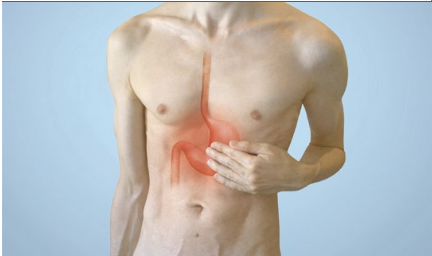
Doença torna-se mais comum com o avanço da idade, manifestando-se, normalmente, por dor ou desconforto na região superior e central do abdome

podem piorar em situações de estresse. Algumas situações comuns no nosso cotidiano como estresse com o trabalho, problemas com segurança, favorecem a liberação de uma maior quantidade de hormônios do estresse (cortisol e adrenalina), que provocam o aumento da secreção de suco gástrico, reduzindo a defesa do estômago. Podem, portanto, acentuar os sintomas de quem já é portador de gastrite.