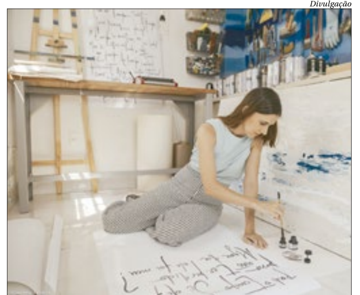
Exposição da artista Mary Dutra está no Espaço Cultural Correios

De segunda a sexta, das 11h às 18h e sábado, das 13h às 17h (exceto feriados).