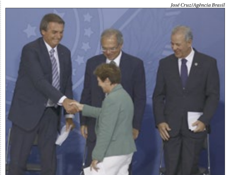
O presidente Jair Bolsonaro cumprimentou a ministra da Agricultura no evento

O Brasil consome 8% de toda a produção mundial de fertilizantes, avaliada em 55 milhões de toneladas. Segundo a ministra, apesar disso, o país importa 85% do insumo usado pelo agronegócio. ■