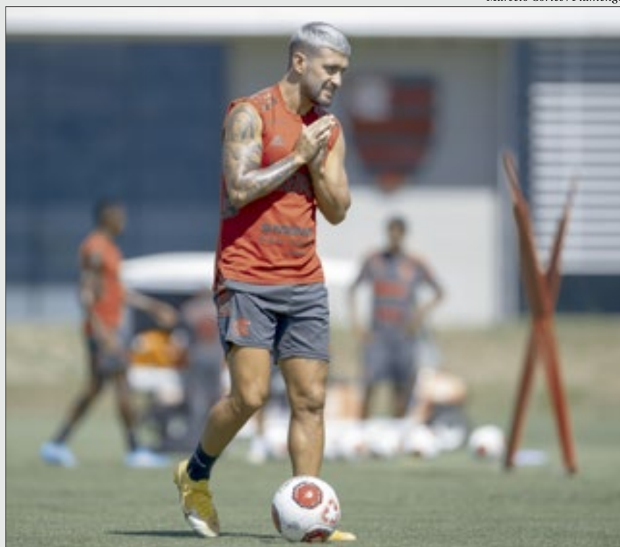
Herói na vitória sobre o Vasco na rodada passada, Arrascaeta está confirmado no jogo de hoje