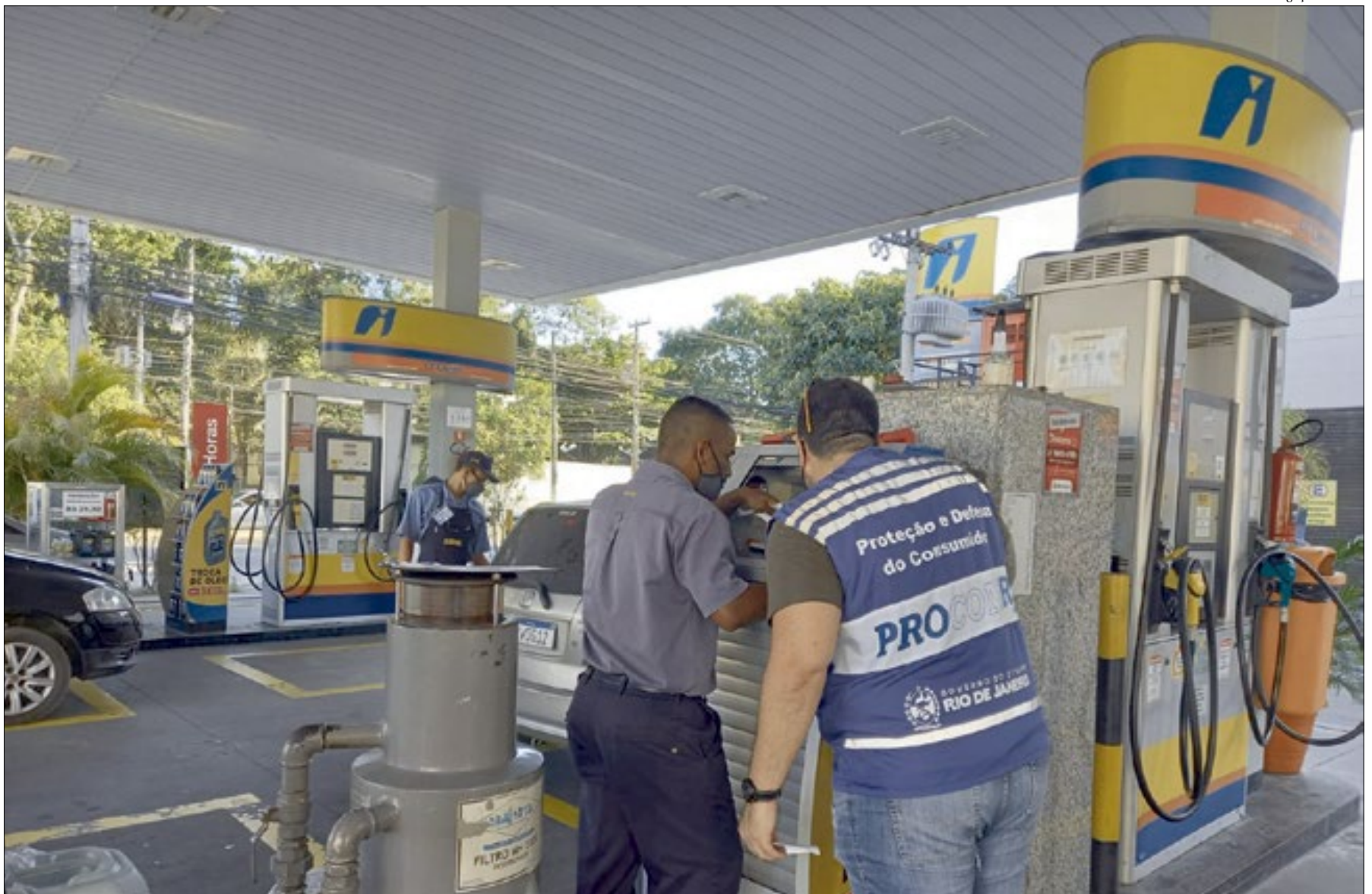
Fiscais do Procon-RJ percorreram na tarde de ontem vários postos de combustíveis em Niterói e em outras cidades para verificar denúncias de aumento abusivo de preços da gasolina