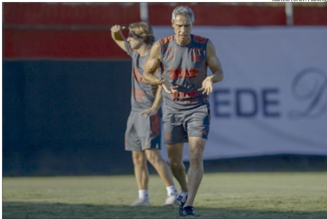
Marcelo Cortes / Flamengo

Tradicional estádio ficou fechado por três meses para troca do gramado