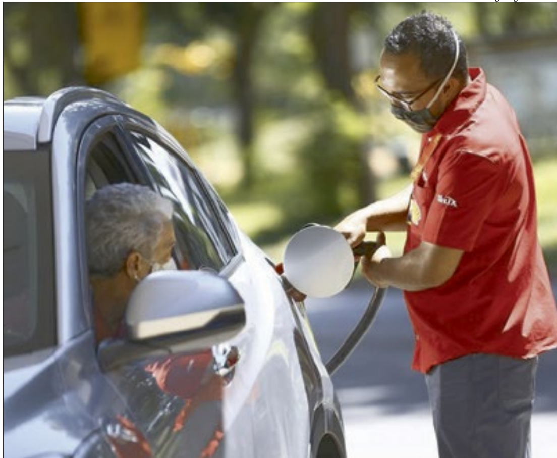
Secretaria Nacional do Consumidor (Senacon), vinculada ao ministério, foi a responsável pela notificação

Procon fiscaliza postos no Rio de Janeiro - Na tarde de ontem (11), o Procon Estadual do Rio de Janeiro iniciou ação de fiscalização para apurar se houve aumento abusivo de preços nos postos de combustíveis após receber denúncias de motoristas. Com o anúncio do reajuste que seria feito pela refinaria na presente data, a autarquia está apurando se houve irregularidade por parte dos fornecedores. Os agentes estão vistoriando postos de combustíveis localizados na capital, Niterói, Campos e Cabo Frio.