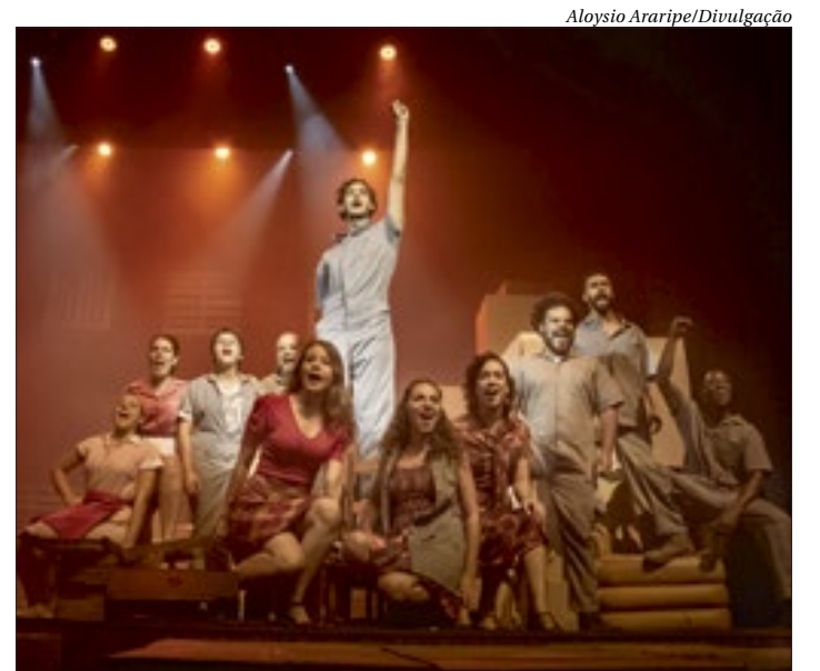
“Cartas para Gonzaguinha - O Musical” faz curta temporada no Municipal

As apresentações acontecem às sextas, às 19h, e aos sábados e domingos, às 18h. Os ingressos custam entre R$30 e R$60 e já estão disponíveis na bilheteria ou pelo Sympla.