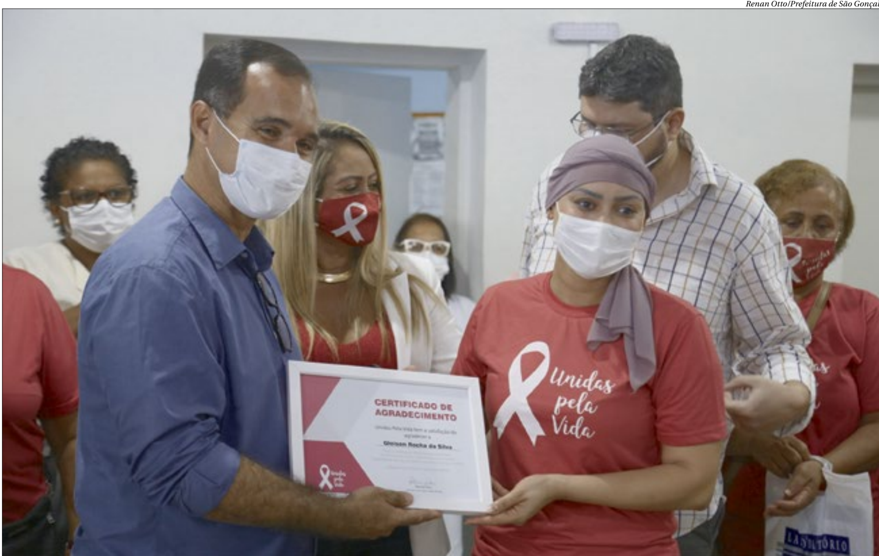
Renan Otto/Prefeitura de São Gonçalo