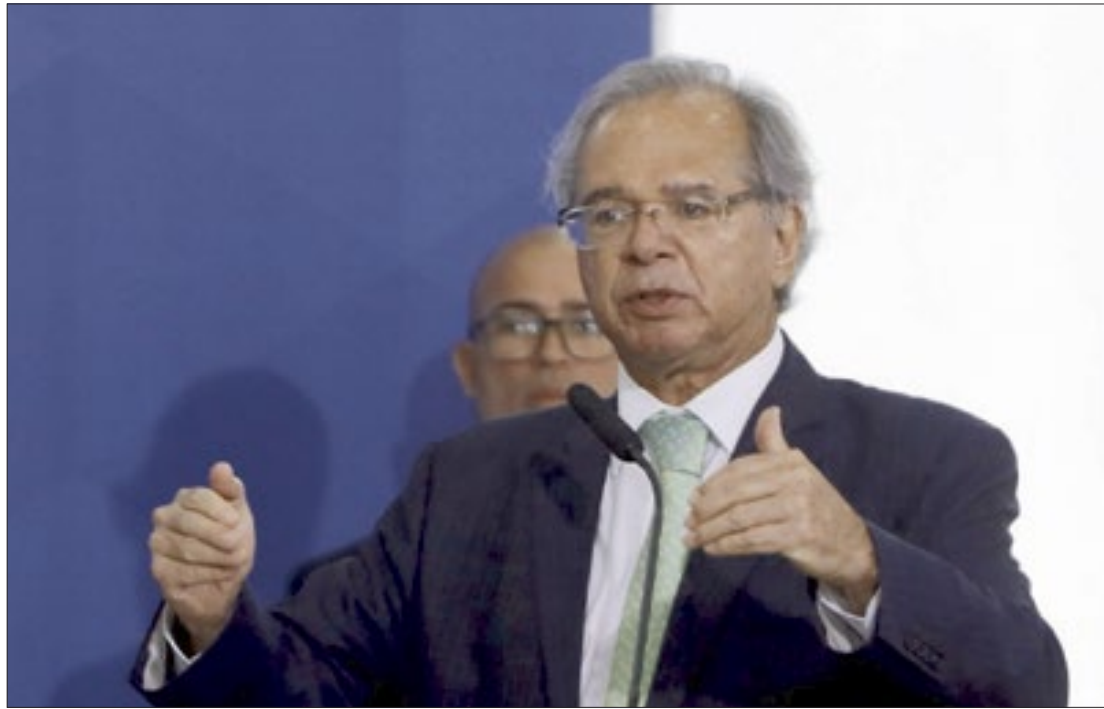
Paulo Guedes falou ontem em evento que também poderá haver uma redução no Imposto de Importação

Segundo o ministro, 12 produtos devem ser contemplados com a redução das tarifas de importação. “Vamos abrir a economia respeitando nosso parque industrial. Se o outro governo for social democrata, ele que aumente