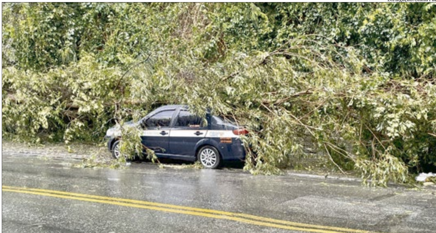
As rajadas de vento foram tão fortes que derrubaram árvores e lançaram galhos nos carros. Na Rua Desembargador Lima Castro, no Fonseca, táxi foi atingido

Pedras de granizo atingiram vários bairros da zona norte, principalmente entre o Maracanã e a Tijuca. Pelas redes sociais, moradores mostraram