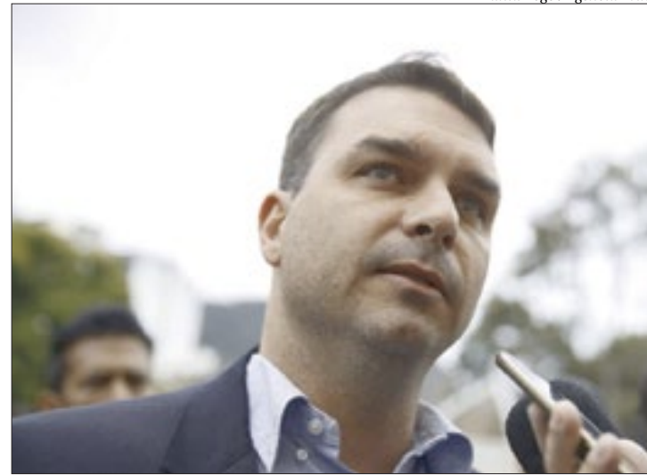
Denúncia contra Flávio Bolsonaro investigava esquema de rachadinha

Com isso, foram anulados os elementos de informação que justificaram a apresentação da peça acusatória. Ainda