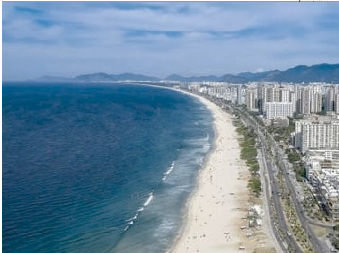
Em 1988, a proposta emancipacionista foi votada num plebiscito, mas apenas 5,6 mil eleitores deram o “sim”

Em 1988, a proposta emancipacionista foi votada num plebiscito, mas apenas 5,6 mil eleitores deram o