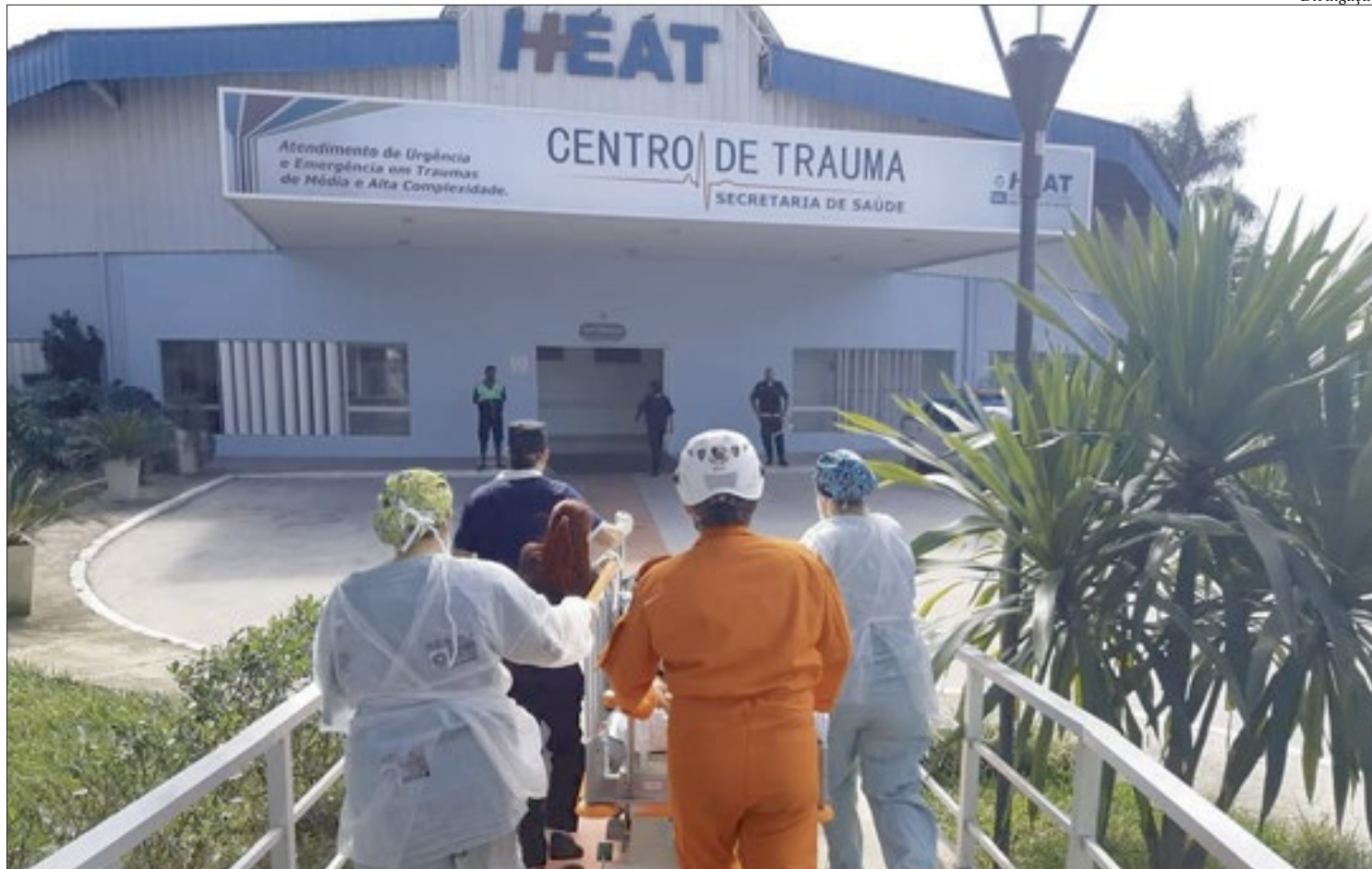
Heat recebeu, somente nos quatro primeiros meses do ano, 1921 vítimas de colisão entre veículos, queda de moto, capotamento e atropelamento

--Temos que frear estes números. São acidentes que podem ser evitados. Diariamente homens, mulheres, jovens, idosos e crianças entram nas emergências com diversas contusões, lesões ou ferimentos em várias partes do corpo, que demandam cuidados especializados, além