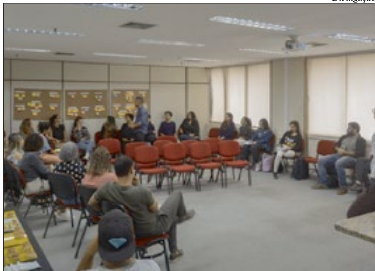
Devido aos números relevantes, a iniciativa envolverá outras secretarias

Devido aos números relevantes, a iniciativa envolverá outras secretarias e coordena-