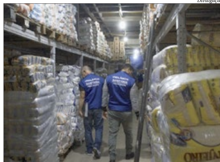
As fiscalizações acontecem semanalmente em diversos locais do município

Durante as inspeções, a Vigilância não encontrou irregularidades no primeiro estabelecimento fiscalizado. No segundo, havia lixo, caixas de papelão, caixotes, alimentos, bebidas e material de limpeza amontoados no mesmo lugar. O supermercado foi interditado após ser constatada situação insalubre nos banheiros, copas e refeitórios utilizados pelos funcionários.