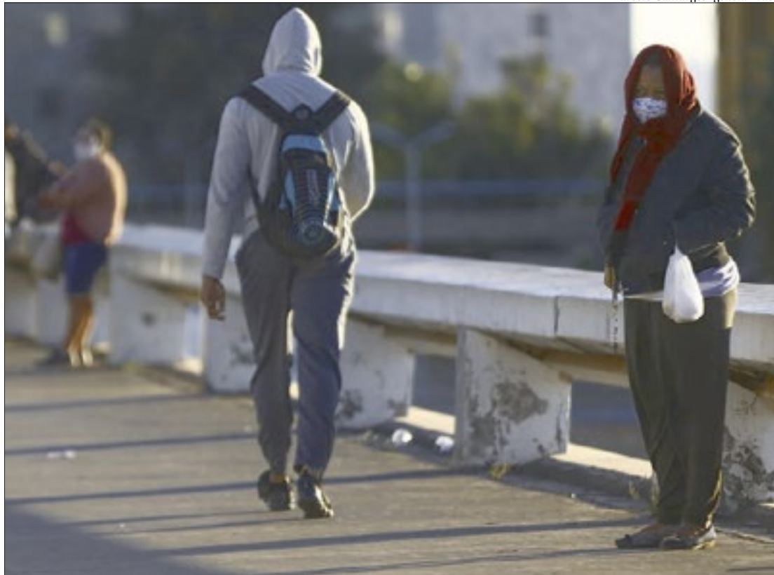
A cidade de Niterói deve continuar fria nesta quinta-feira, com mínima de 14°C e máxima de 21°C

A Defesa Civil faz seguintes orientações: não ficar embaixo de árvores ou coberturas metálicas, procurar