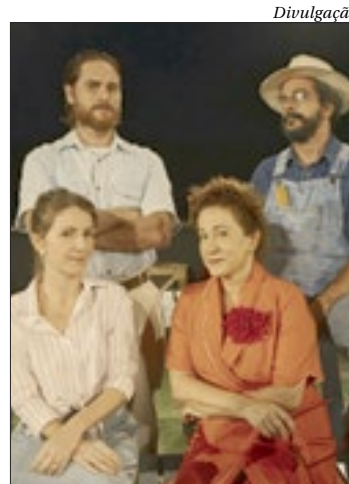
Espectáculo será encenado no Parque das Ruínas, em Santa Teresa

O espetáculo “Cerca Viva” será encenado, nesta quinta e sexta, às 20h, no Teatro Ruth de Souza, no Parque das Ruínas, em Santa Teresa. Além da peça teatral, haverá um bate-papo com a equipe do Cerca Viva e um workshop de teatro. Toda programação é gratuita e uma das apresentações contará com intérprete de Libras. Na história, um jovem casal, da década de 1950, deixa a agitada capital para viver numa cidade rural.