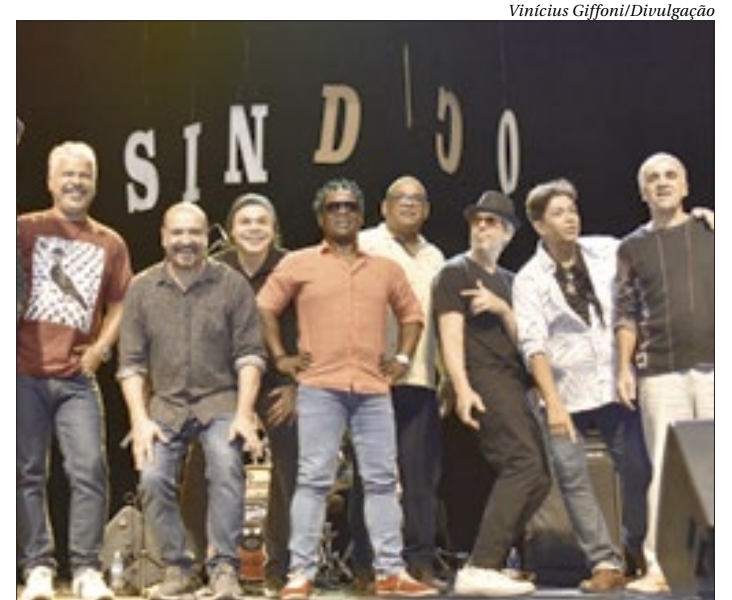
Banda do Sândico faz show com os grandes sucessos do cantor

As apresentações da banda acontecerão na sexta, às 20h, e no sábado, às 19h. Os ingressos custam R$60 e podem ser comprados através do site Symply ou na bilheteria.