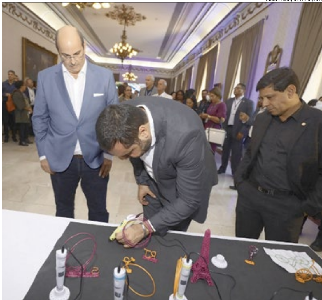
Governador Cláudio Castro experimenta os novos equipamentos e a lousa digital no lançamento oficial do projeto

Entre os recursos tecnológicos empregados no projeto estão a distribuição de mais de 24 mil chromebooks, sistemas de monitoramento por câmera, conexão à internet de alta qualidade,