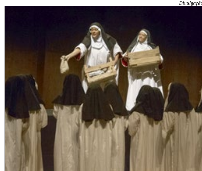
Coro de Câmara Lírico Feminino da ACC se apresenta nesta quarta, às 19h

O coral possui cantoras de diferentes formações tanto profissionais, como amadoras. O ingresso custa R$ 40, no site Sympla ou na bilheteria.