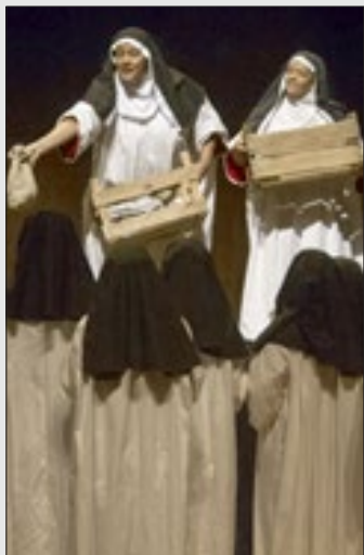
Coro de Câmara Lírico Feminino da ACC se apresenta nesta quarta