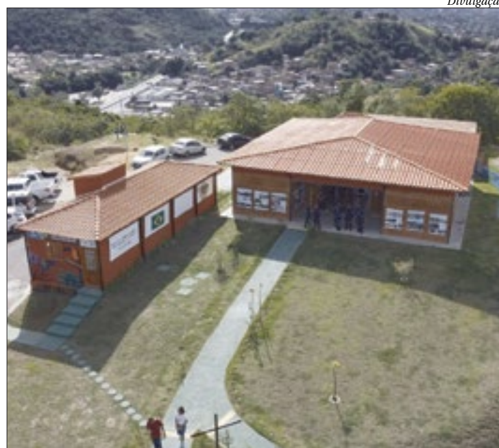
Novo espaço Área de Soltura de Animais Silvestres oferece visitas guiadas

O período de visitação das dependências da Área de Soltura será limitado e os interessados têm até o dia 6 de julho para agendar a visita