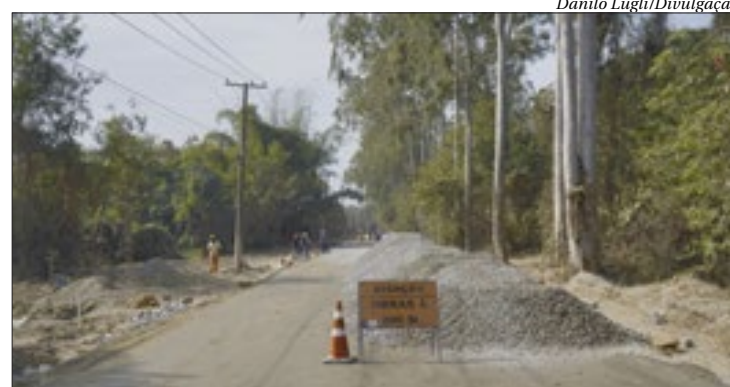
Com seis quilômetros de extensão, estrada já tem uma parte sendo asfaltada

A obra foi dividida em três etapas, sendo a Avenida Francisco Azeredo Coutinho o primeiro trecho a ser atendido. Ele possui dois quilômetros de