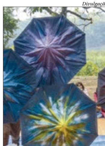
Serão três apresentações gratuitas com início na sexta-feira

Três apresentações gratuitas do premiado espetáculo “Água Doce” vão levar ao público conhecimentos sobre os rios brasileiros e o meio ambiente. As exposições estão programadas para os dias 10, às 10h, na Lona Cultural João Bosco, em Vista Alegre; dia 11, às 17h e 19h, na Arena Carioca Jovelina Pérola Negra, na Pavuna; e no dia 12, às 12h30 e 14h30, no Parque das Ruínas, em Santa Teresa, região central da capital.