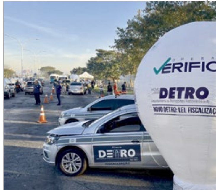
Operação Verificar, do Detro, foi realizada ontem na Linha Vermelha

para-brisa acima do permitido pela legislação. O filme foi retirado do vidro, e a van, liberada. Três fiscais checavam cada veículo para agilizar o processo em no máximo três minutos com o objetivo de não impactar o trânsito. A fiscalização começou por vans e se estenderá aos ônibus intermunicipais.