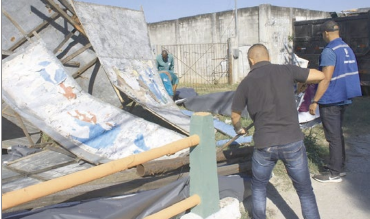
Retirada de out-doors irregulares em São Gonçalo resultou na notificação de empresa responsável e aplicação de multa. Painéis precisam ser autorizados

Em uma loja de pneus, o estabelecimento foi multado por fixação de publicidade