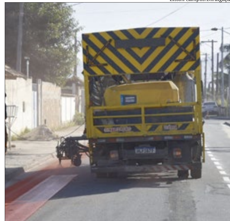
Faixas do Sistema binário foram pintadas na Rua 32, em Itaipuaçu

Primeira etapa do sistema binário - Nesta primeira etapa, acontece a implementação do sistema binário em quatro vias (Rua 32, Rua 33, Rua 52 e Rua 53) do loteamento Jardim Atlântico, em Itaipuaçu. Assim que o trabalho for concluído na Rua 32, as equipes atuarão na Rua 33 e posteriormente nas ruas 52 e na 53. Estas últimas ficam ao lado do Campus de Educação Pública Transformadora (CEPT) de Itaipuaçu. Com a alteração, todas as vias passam a ter mão única. ■