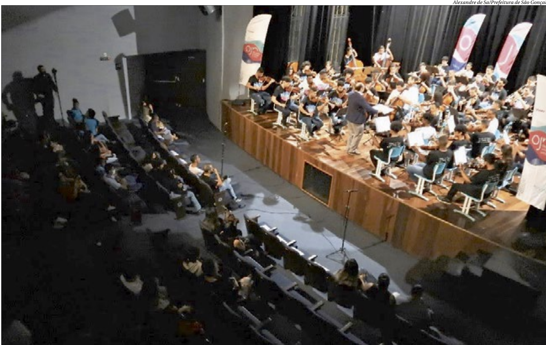
Alexandre de Sa/Prefeitura de São Gonçalo