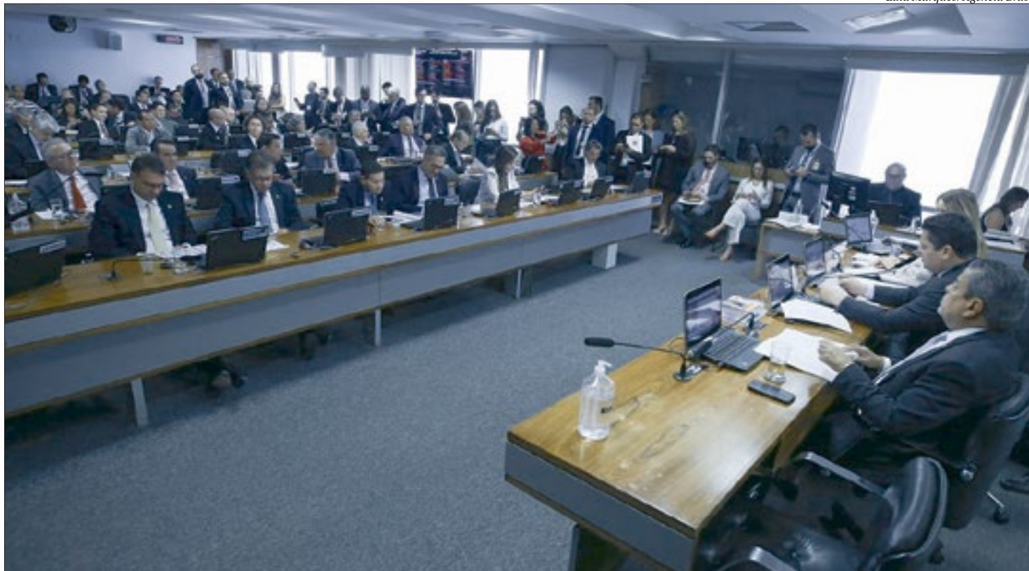
Não houve pedidos dos membros da comissão para discussão da matéria. PEC aprovada na CCJ segue agora para a avaliação pelo plenário da Casa

As decisões monocráticas são aquelas tomadas por apenas um magistrado. Pela sua natureza, trata-se de uma decisão provisória, uma vez que precisa ser confirmada