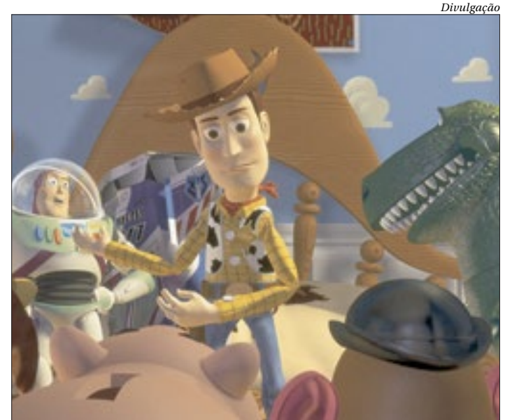
Sessões dos filmes da Pixar, como "Toy Story", acontecem até o dia 16