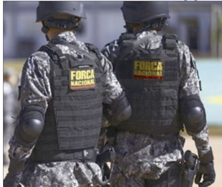
Em nota, Ministério da Justiça admite que terá que alinhar procedimentos

O Ministério da Justiça e Segurança Pública vai adiar o envio da Força Nacional para o Rio de Janeiro, medida que havia sido anunciada em apoio às polícias estaduais no combate ao crime organizado. A decisão foi tomada depois de o Ministério Público Federal (MPF) questionar se as ações obedecerão aos comandos da Corte Interamericana de Direitos Humanos (CIDH) e do Supremo Tribunal Federal (STF).