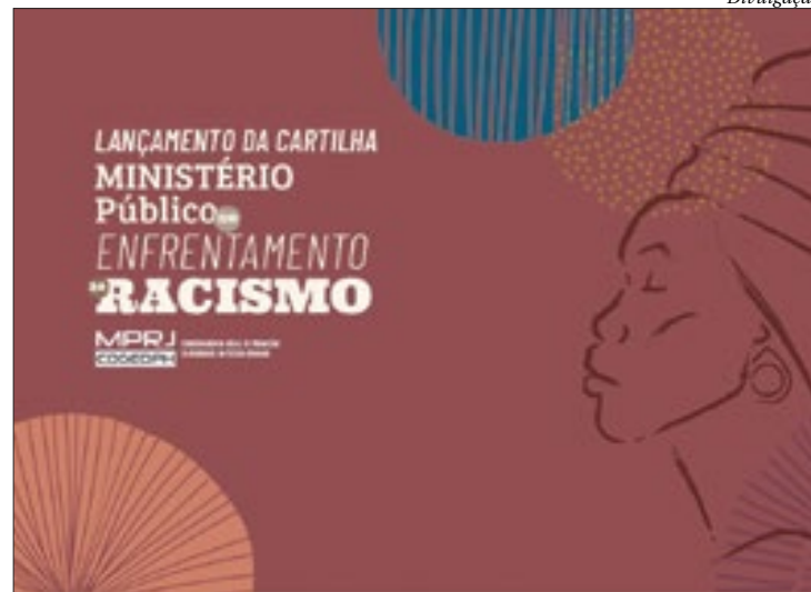
Cartilha lica como o MP atua em relação aos comportamentos racistas

Escrita de forma clara e acessível, a publicação “Ministério Público no enfrentamento ao racismo” destaca a importância do respeito e da igualdade entre as pessoas. “Nós, membros do Ministério Público do Estado do Rio de Janeiro, estamos comprometidos em garantir que todas as pessoas sejam tratadas com igualdade e respeito, independentemente da cor da sua pele”, diz a introdução da cartilha elaborada pela Coordenadoria-Geral de