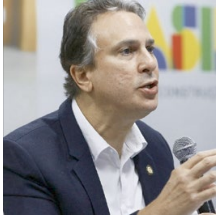
Ministro da Educação, Camilo Santana, falou da interiorização dos cursos

O governo federal autorizou a abertura de até 95 novos cursos de medicina, com 5,7 mil vagas, em 1.719 municípios do país. Ontem (4), o ministro da Educação, Camilo Santana, e a ministra da Saúde, Nísia Trindade, lançaram o edital para a obtenção de autorização de funcionamento de cursos de medicina.