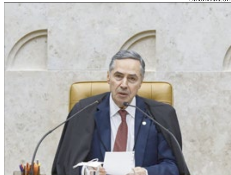
Barroso disse que compreende os debates mas não concorda com eles

"Em síntese, pessoalmente, acho que o Supremo, talvez, seja uma das instituições que melhor serviu ao Brasil na preservação da democracia. Não está em hora de ser mexido", afirmou o ministro. ■