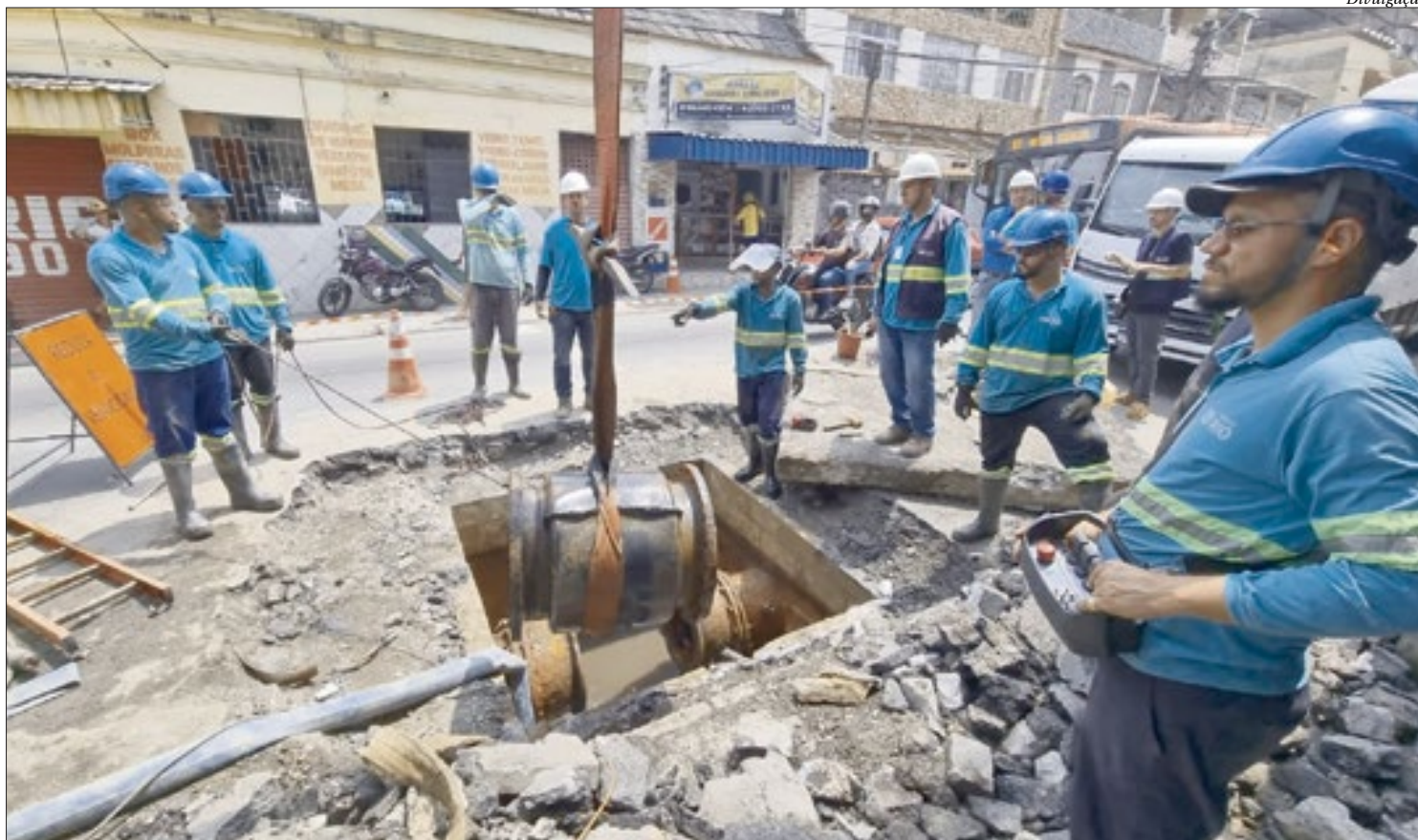
Melhorias na rede de distribuição de São Gonçalo garantem recuperação de volume de água suficiente para abastecer 56 mil pessoas por dia, diz a Águas do Rio

“Ano passado fizemos 24 intervenções simultâneas, e algumas tinham como objetivo específico acabar com vazamentos nas redes. Essas ações deram fim ao desperdício de uma quantidade capaz de abastecer seis mil pessoas por dia. Agora, conseguimos integrar ao sistema um volume bem superior, equivalente a cinco piscinas olímpicas de água a cada 24h. Nós não identificamos um desperdício aparente, ou seja, um vazamento que podia ser visto a olho nu em uma tubulação. No entanto, por meio de sondagens, que é tipo um mapeamento feito em nossas redes, percebemos a necessidade de realizar essas intervenções para evitar