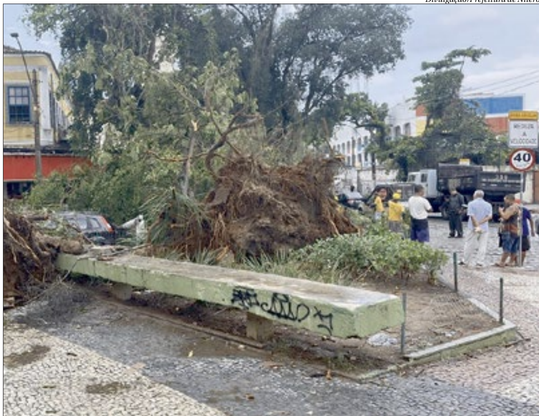
A Prefeitura de Niterói está com um efetivo de mais de 2 mil funcionários trabalhando desde a noite de quinta nas ruas

A Enel Rio, concessionária dos serviços de iluminação de Niterói, informou ter restabelecido o fornecimento de energia para 75% dos clientes afetados por fortes chuvas - acompanhadas por raios