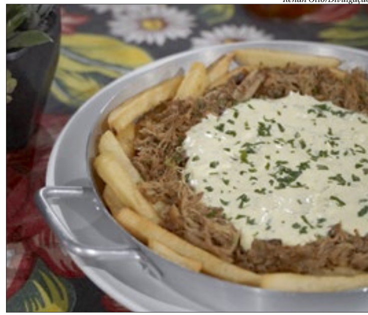
Carne seca desfiada, com batata frita e creme de queijo é uma das opções

Neste sábado (7) e domingo (8), os quiosques do Centro de Tradições Nordestinas terão como destaque em seus cardápios pratos típicos com valores de R$20 a R$25, entre os quais Bobó de Camarão, Vaca Atolada, Feijoada de Ca-