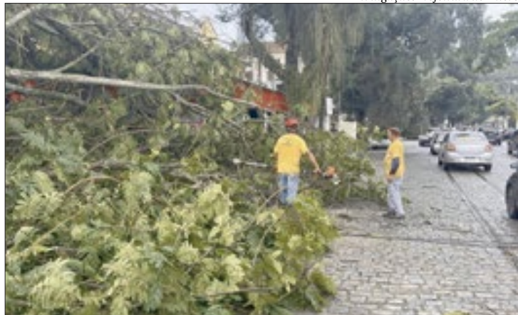
Até o momento há registro de 40 quedas de árvores em toda a cidade

Sistema Municipal - A Secretaria Municipal de Defesa Civil