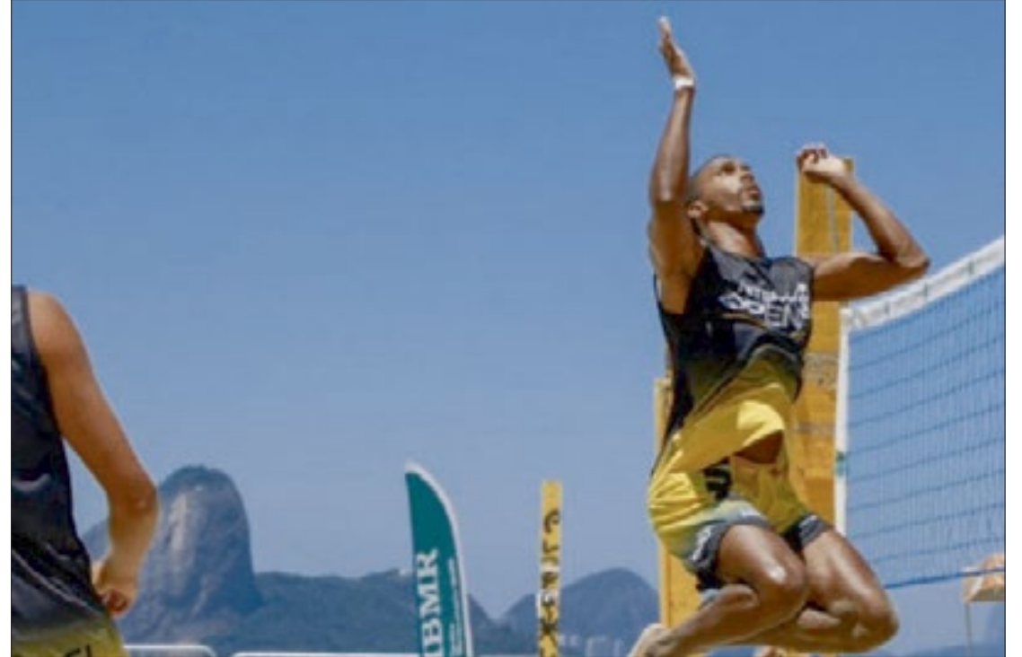
Evento será realizado neste fim de semana é aberto a quem quiser participar de atividades de esporte e lazer ao ar livre

O torneio mais esperado pelos praticantes de futevôlei da cidade não é voltado só para os atletas, mas trará diversão para todos que queiram curtir um final de semana de esporte e lazer, já que terá vários estandes e aquele clima na praia que o esporte proporciona. O Niterói Open tem apoio da Prefeitura de Niterói, através da Secretaria Municipal de Esporte e Lazer de Niterói-SMEL, e terá transmissão ao vivo produzido pelo canal sports do YouTube.