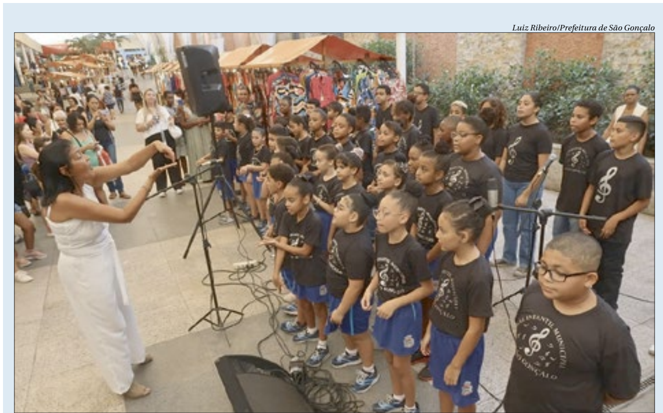
Luiz Ribeiro/Prefeitura de São Gonçalo