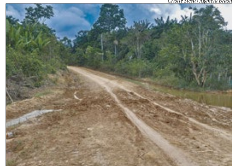
Ambientalistas pedem para que as autoridades olhem para o Cerrado mais cuidado

Já no Cerrado, bioma que tem sido submetido a interferências profundas, por conta do avanço da monocultura da soja, que também muda radicalmente a paisagem e afeta a fauna e a flora locais, o perímetro tomado pelo desmatamento aumentou de 273,41 km² para 516,73 km²,