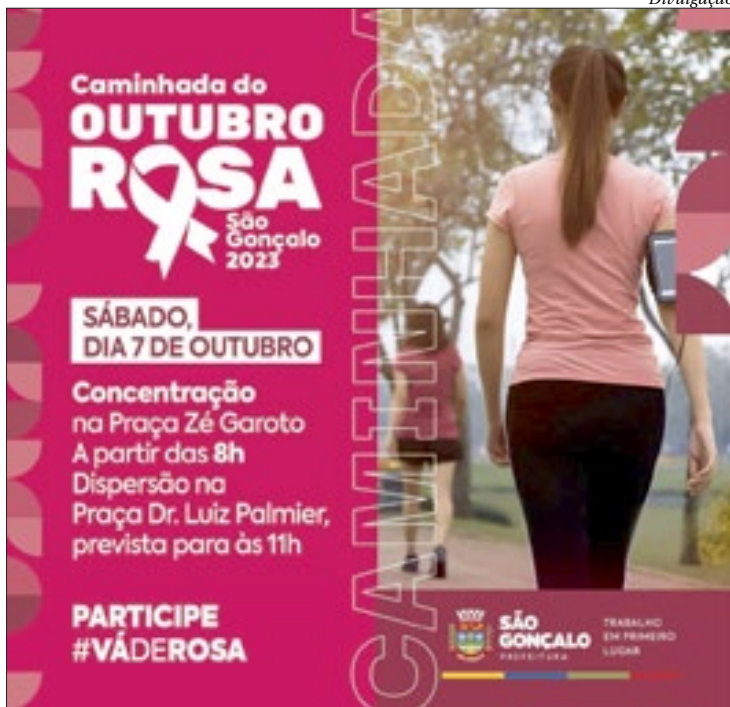
Para participar da caminhada é só chegar: não é necessário fazer inscrição

Para participar, basta comparecer vestindo roupas na cor rosa. Não há necessidade de inscrição. A caminhada vai até a Praça Dr. Luiz Palmier (popular Praça do Rodo ou Praça da Marisa), onde acontecerá a dispersão. Na chegada à segunda praça, os participantes poderão contar com acolhimento e orientações de vários progra-