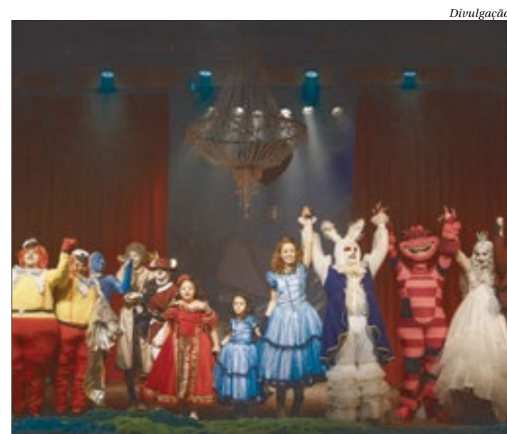
“Alice no País das Maravilhas”, neste sábado e domingo, às 16h

O ingresso custa R$70 (inteira), no Sympla.