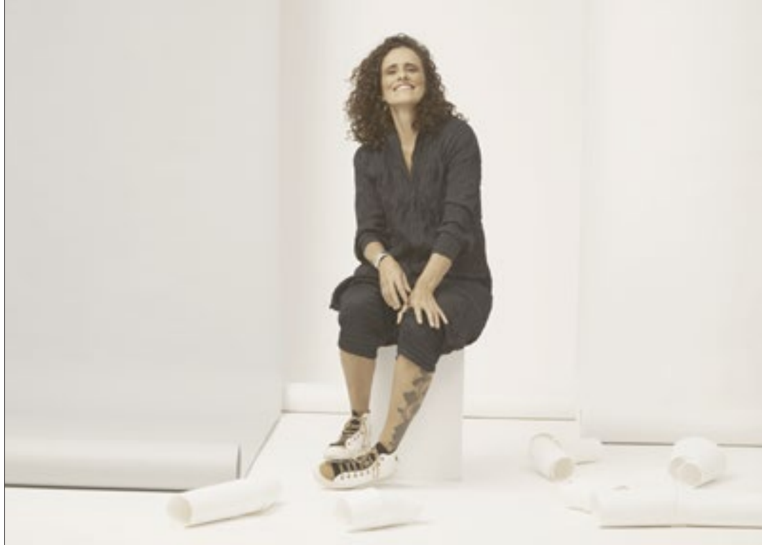
A cantora Zélia Duncan se apresenta no domingo (15), último dia da festividade no palco Marazul em Piratininga

"Um dos grandes focos do Festival Marazul é o olhar dedicado à classe artística local. Chamamos os nossos para comemorar a nossa própria história e, mais do que isso, vimos nesta festi-