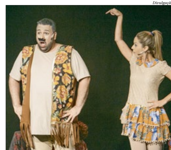
Espectáculo está em cartaz, aos sábados e domingos, às 16h, até o dia 22

Local: Teatro da UFF Endereço: R. Miguel de Frias, 9 - Icaraí Dias: 8, 14, 15, 21, e 22 de outubro Horário: 16h Classificação: Livre Ingressos R$40 (inteira), na bilheteria do teatro ou Guichê web. ■