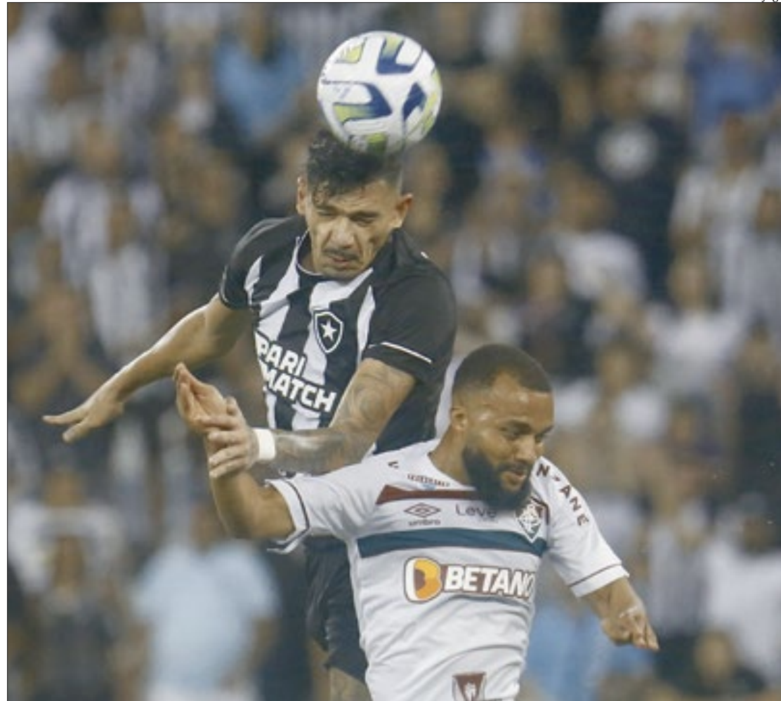
Vitor Silva / Botafogo

A situação do Botafogo, que se dedica exclusivamente ao Brasileirão, é diferente. Líder com 52 pontos, o Glorioso completou o quarto jogo sem vencer na compe-