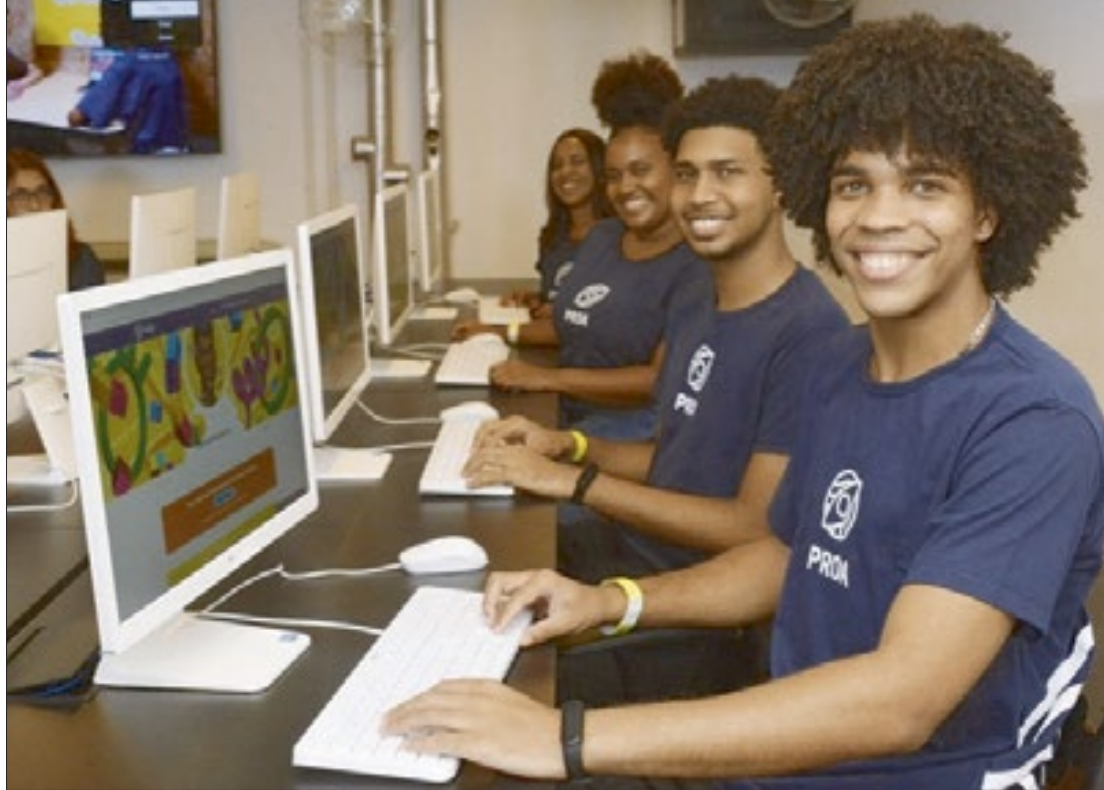
As inscrições podem ser feitas até o dia 15 de janeiro e as aulas começam no dia 29 de janeiro de 2024

“A parceria com o Instituto PROA veio para promover a inclusão do jovem fluminense no mercado de trabalho e cumpre nossa missão de estimular a principal política de desenvolvimento social que existe: a geração de empregos”, diz o governador Cláudio Castro.