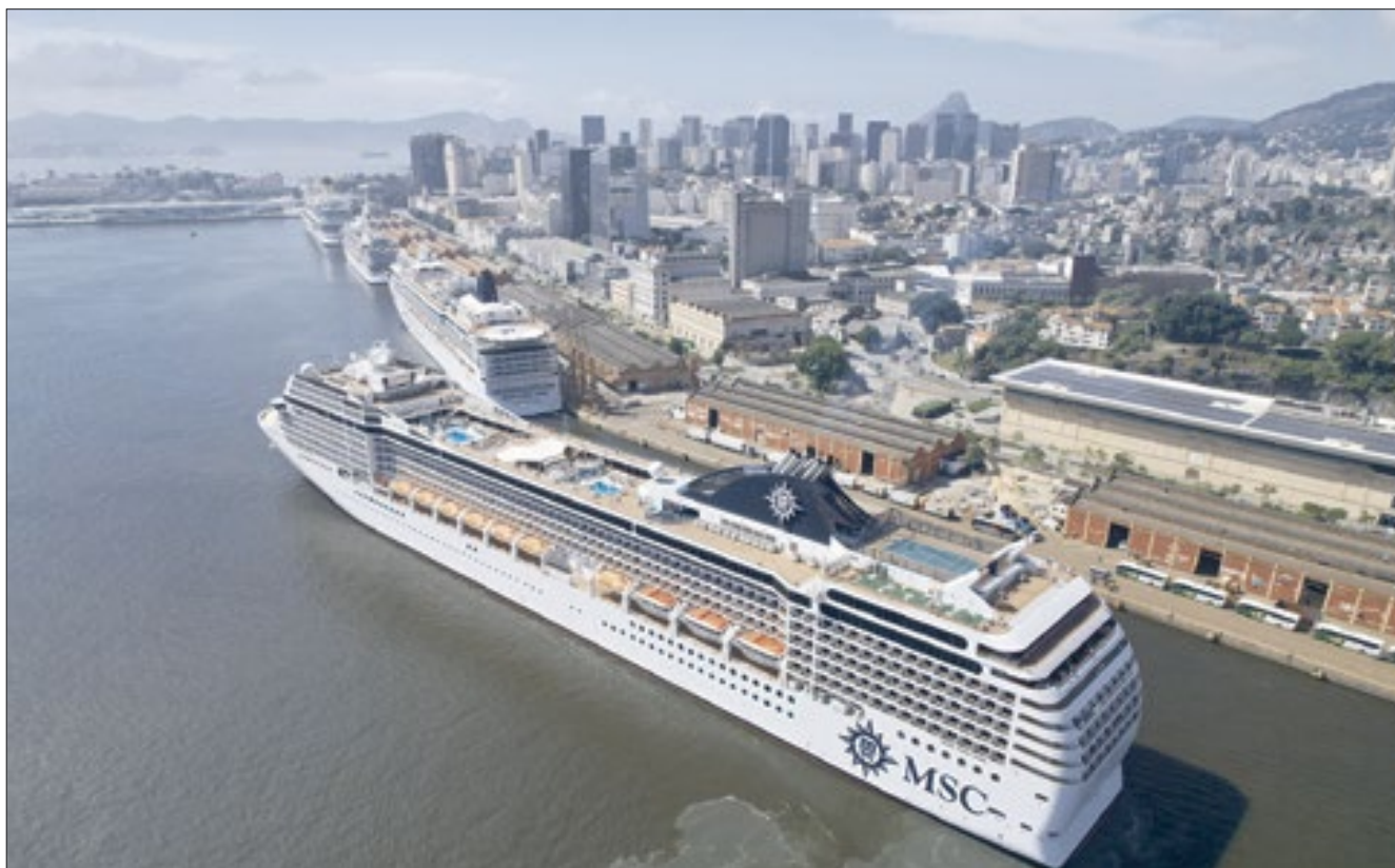
A PortosRio tomou medidas para manter as condições operacionais necessárias para o acesso e as atracções dos navios de cruzeiro

Temporada de cruzeiros à vista no Porto do Rio