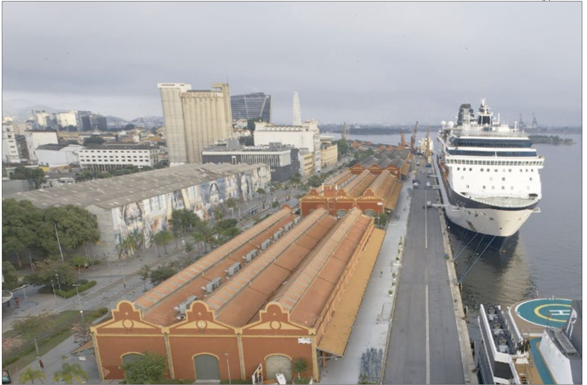
A partir do próximo dia 27 e até 4 de maio o Porto do Rio receberá 37 navios, incluindo 28 de origem estrangeira e nove nacionais, sendo que quatro deles farão sua estreia na cidade

O Pier Mauá, por sua vez, está aprimorando a estrutura do terminal, com a instalação de coberturas em suas áreas e um sistema de clima-