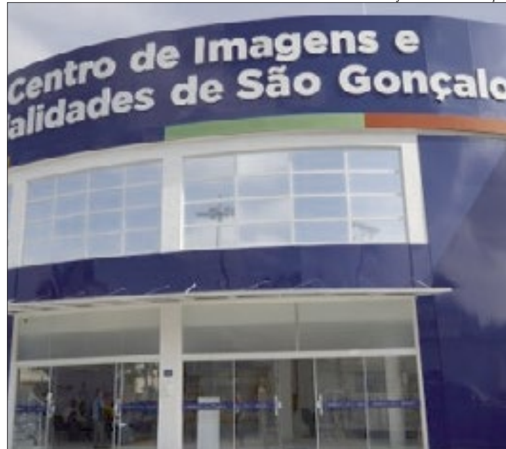
Renan Otto / Prefeitura de São Gonçalo

Para a especialidade de dermatologia, foram oferecidas