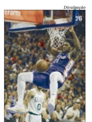
De origem camaronesa, pivô Joel Embiid optou por defender os EUA

De acordo com o portal “Athletic”, o atual MVP da NBA, Joel Embiid escolheu defender os Estados Unidos nas Olimpíadas. O pivô poderia jogar por Camarões ou França.