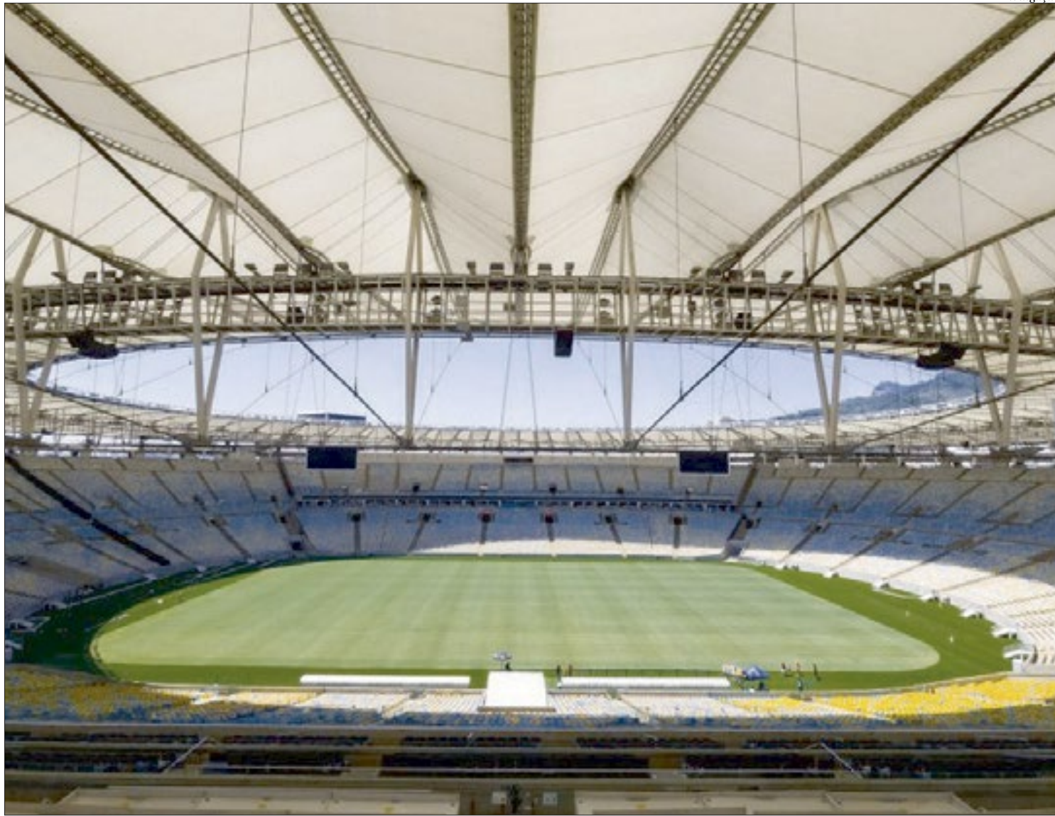
Em novembro, o Maracanã será palco de dois duelos entre brasileiros e argentinos. Além de Flu x Boca na Liberta, as seleções dos dois países se enfrentarão

Porém, antes do clássico com a Argentina no Maracanã a seleção brasileira tem outros dois compromissos pelas Eliminatórias, contra a Venezuela, no dia 12 de outubro em Cuiabá, e contra