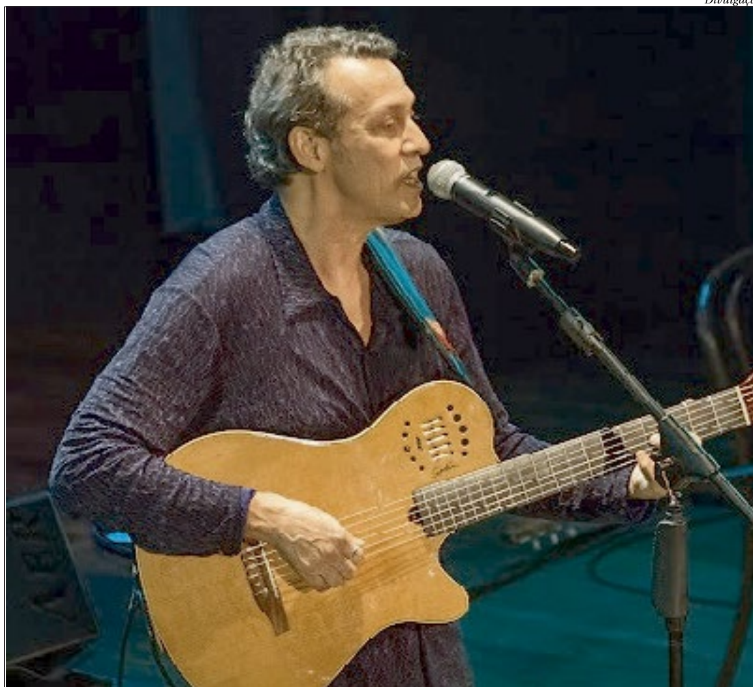
Principais sucessos da carreira do cantor, iniciada nos anos 90, fazem parte da apresentação no Municipal de Niterói

"Será um show comemorativo da minha carreira com preços populares, onde farei