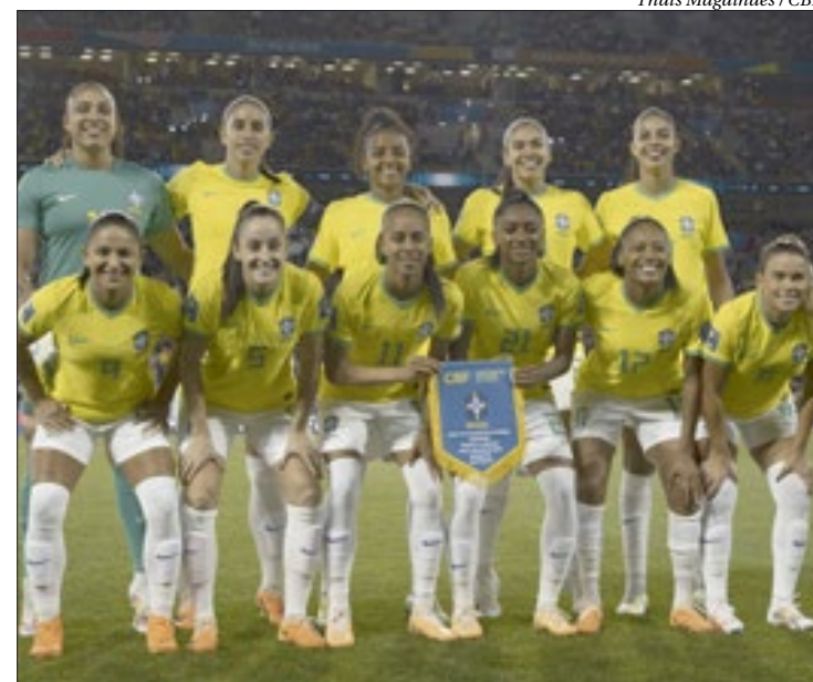
Brasil buscará na próxima Copa (quem sabe em casa) seu primeiro título mundial

A campanha do Brasil para sediar a principal competição do futebol feminino é um dos pontos previstos na Estratégia Nacional para o Futebol Feminino, que busca dar visibilidade a modalidade e foi decretada pelo presidente Luiz Inácio Lula da Silva no dia em que o Brasil recebeu o troféu da Copa do Mundo 2023, em março deste ano. Caso o país seja escolhido, será a primeira vez que a competição acontecerá na América do Sul.■