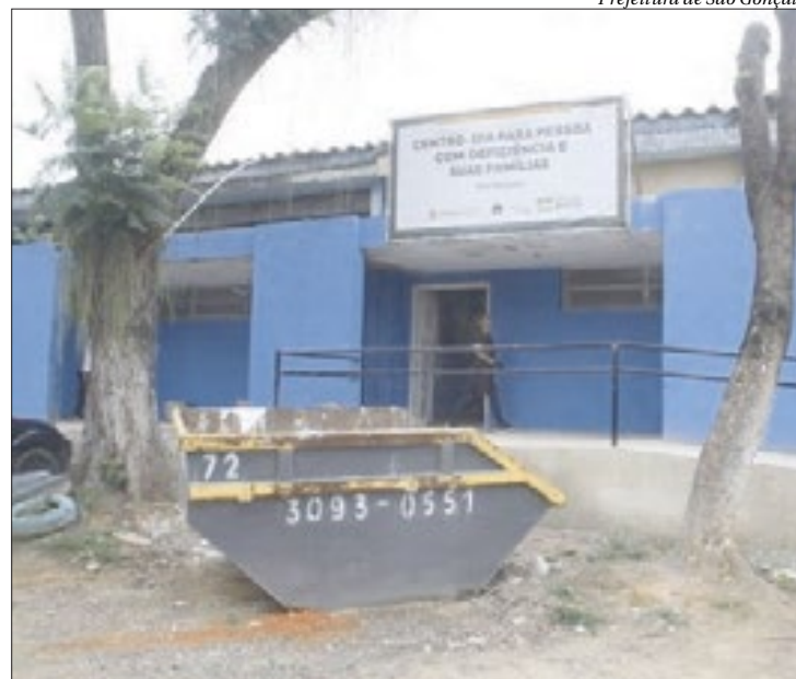
Prefeitura de São Gonçalo

Os usuários são atendidos por uma equipe formada por assistente social, psicólogo, terapeuta ocupacional e pedagoga, além de cuidadores que auxiliam durante o tempo em