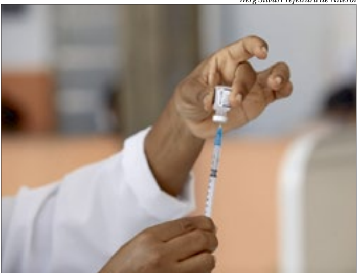
A vacina pode ser agendada. Basta baixar o aplicativo Colab para conseguir