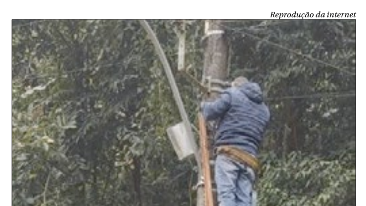
Praça do Sapo, Praça de Santanna e o Cais do distrito foram beneficiados

A Prefeitura de Mangaratiba, através da Secretaria de Ciência e Tecnologia, instalou novos pontos de wi-fi gratuitos no município na última quinta-feira (5). Os novos locais beneficiados, localizados em Itacuruçá, foram as Praças do Sapo e de Santanna, e o Cais do distrito. A ação faz parte do 'Praças Conectadas'.