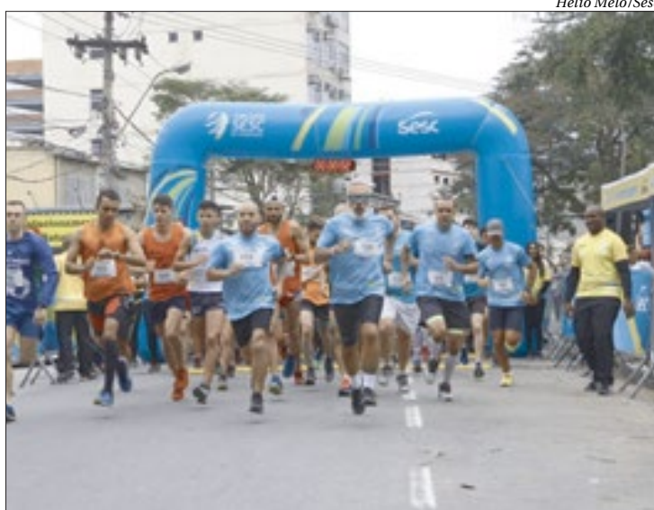
Largada será às 8h da Avenida Pref. Silvío Picanço, 1490, em Charitas

Corredores percorrerão um percurso de 7 quilômetros pela orla de Charitas e São Francisco e a estrada Leopoldo Fróes ou então caminhar por 5 quilômetros em um percurso reduzido. A largada será às 8h da Avenida Prefeito Silvío Picanço, 1490-Charitas