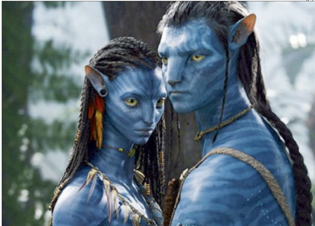
O documentário "Avatar: O Caminho da Água", dirigido por Pippa Ehrlich e James Reed, é a atração de sábado, às 18h

Um dos destaques do Festival é o projeto Green60 que, além de apresentar filmes e realizar debates, vai premiar os melhores filmes com duração de um minuto produzidos com celular. O