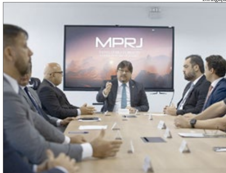
Operações policiais e transferências de presos foram discutidas no encontro

“A Segurança Pública é uma das nossas prioridades. Entendemos que para isso é necessário um trabalho de inteligência, articulação e integração. Temos atuação nas áreas de Investigação Penal, Criminal, Execução Penal, Infância e Juventude, além de Meio Ambiente e Urbanismo, um trabalho de integração de