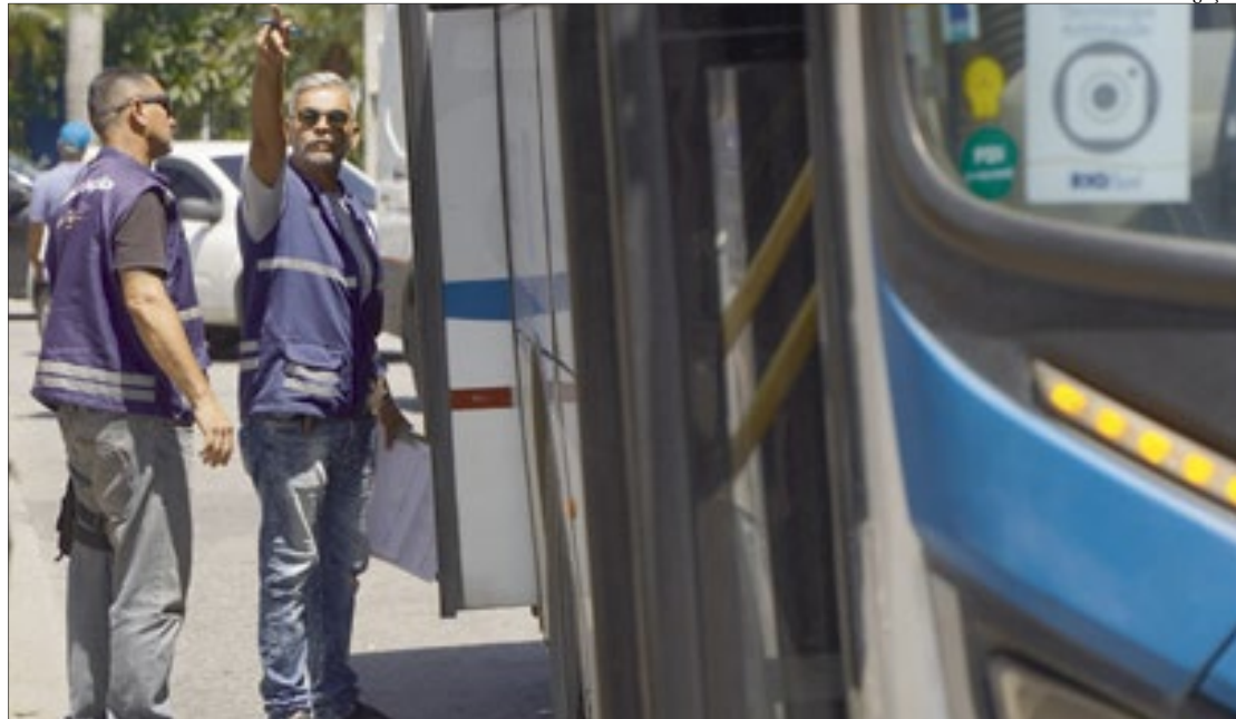
Fiscais da prefeitura vistoriaram ônibus que circulavam ontem pelos bairros do Centro, Zé Garoto e Bandeirantes