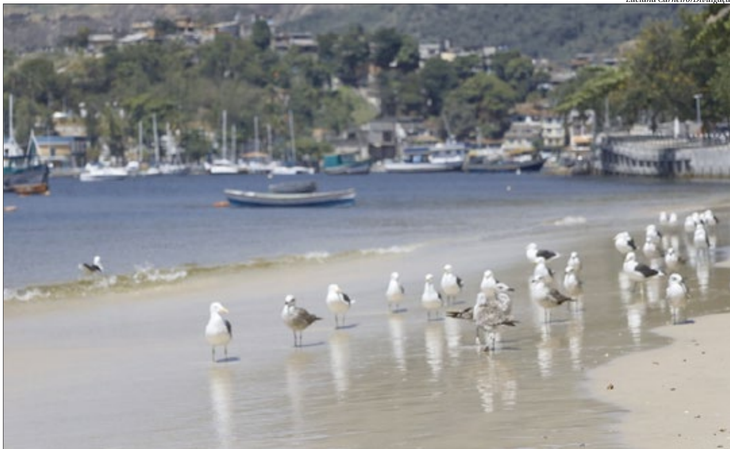
Projeto tem como objetivo produzir um catálogo de espécies animais de seis bairros que formam a Enseada de Jurujuba, promovendo educação ambiental e conhecimento da biodiversidade local

De acordo com o secretário de Meio Ambiente, Recursos Hídricos e Sustenta-