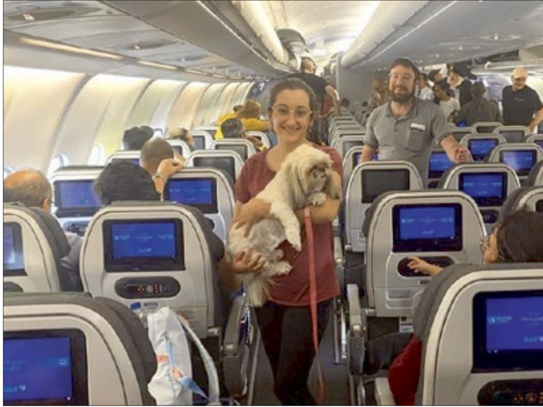
Segunda aeronave da FAB traz 214 passageiros e, pela primeira vez, animais de estimação - um cachorro e três gatos

ao pisar em solo brasileiro após 14 horas de viagem deixando para trás a insegurança de uma zona de guerra. Esse é o relato geral dos brasileiros que desembarcaram nesta quarta-feira (11) na Base Aérea de Brasília, vindos de Tel Aviv, Israel, em voo da Força