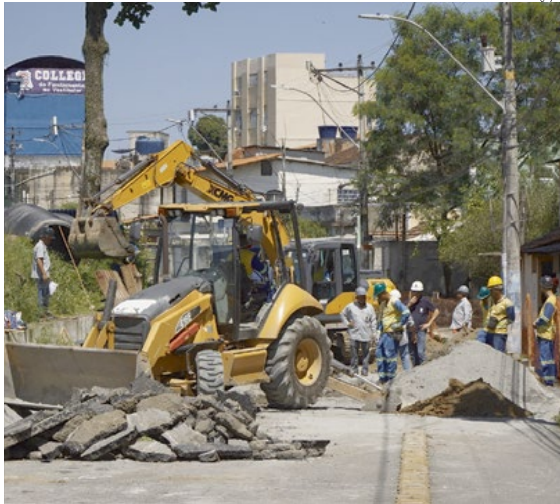
Nova frente de trabalho foi aberta, para a instalação de manilhas. Trânsito ficará interrompido de 7h às 17h

Com investimento de R$262 milhões, o Muvi foi concebido para priorizar e modernizar o transporte pú-