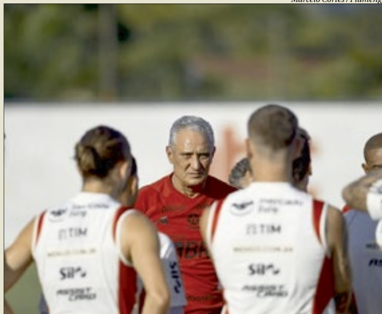
Tite vai estrear no comando do Flamengo na próxima quinta contra o Cruzeiro em BH