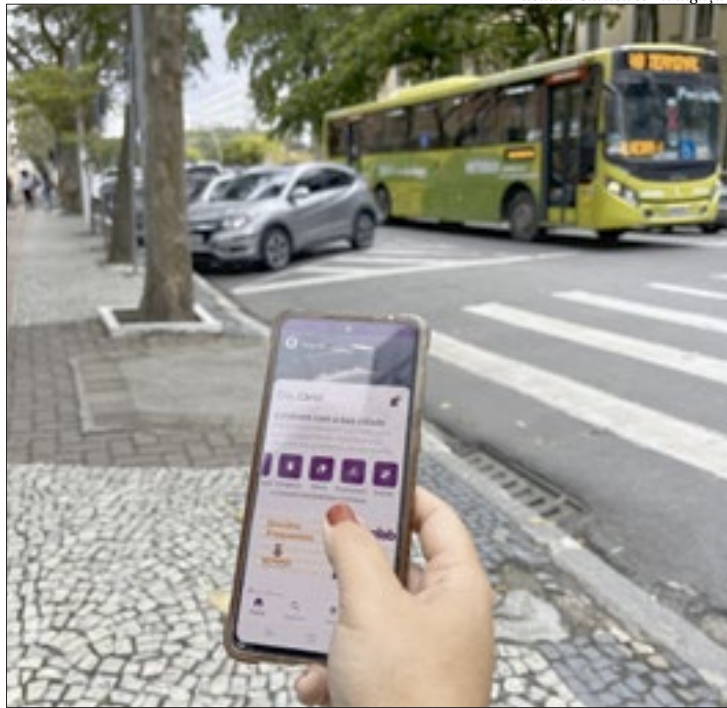
Votação pelo Colab para escolha de instalação de paraciclos

A participação pode ser feita através da plataforma digital Colab. Ao abrir o aplicativo, o usuário precisa clicar na categoria Pedestres e Ciclistas. Depois, deve selecionar o endereço onde acha que é preciso ter um paraciclo. Na página seguinte, vai escolher a categoria Instalação de paraciclos. Por fim, é preciso preencher os campos de descrição da ocorrência, ponto de referência e anexar até três imagens do local, antes de finalizar.