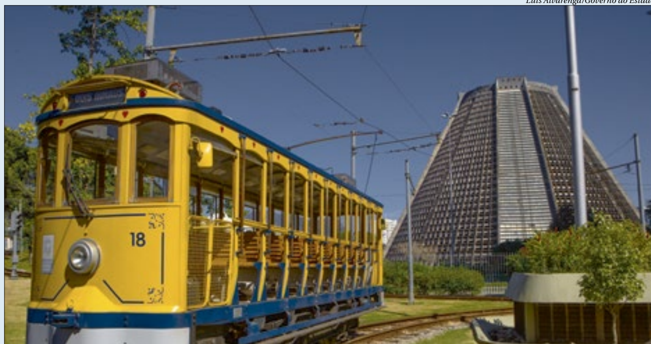
Melhorias incluem reconstrução da via permanente, com a remoção do pavimento, trilhos, placas e outros elementos desgastados, que serão substituídos