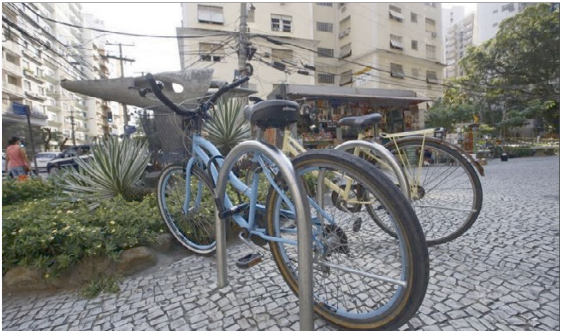
Equipamentos serão instalados nas ruas do município conforme a quantidade de pontos avaliados pela equipe do Niterói de Bicicleta após o recebimento da sugestão dos moradores da cidade