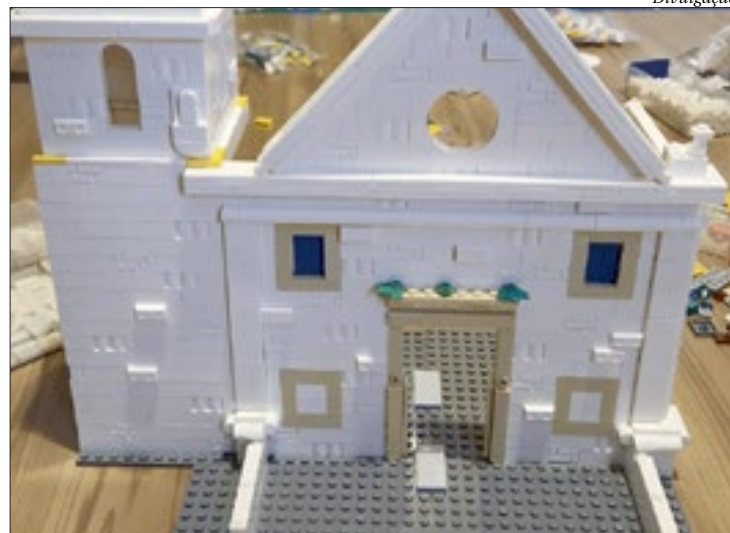
Exposição Lego foi trazida a Niterói pelo grupo de colecionadores LUG-Rio