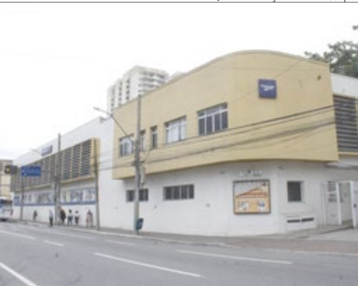
Interessados devem comparecer à Firjan até o próximo dia 19 de outubro

A carga horária para Power BI - iniciação ao desenvolvimento de dashboards é de 20 horas; de supervi-