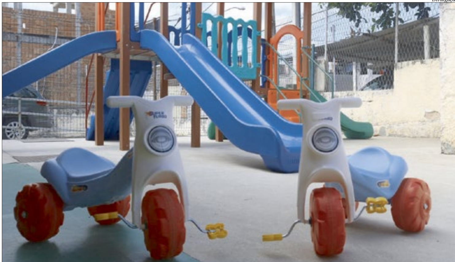
Velotróis, triciclos e bicicletas estão entre os brinquedos adquiridos, que vão ajudar a promover a integração entre as crianças através da diversão em grupo

Foram adquiridos cerca de 240 mesas de luz, 300 bicicletas, 300 velotróis, 250 triciclos e 60 totokinhas, totalizando cerca de 1150 brinquedos. Os