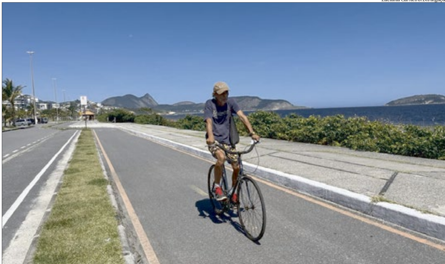
Ciclovia em Piratininga: adeptos das pedaladas podem circular livremente até outros bairros da Região Oceânica de Niterói, associando mobilidade e lazer

“Os investimentos realizados pela Prefeitura de Niterói nos últimos anos com