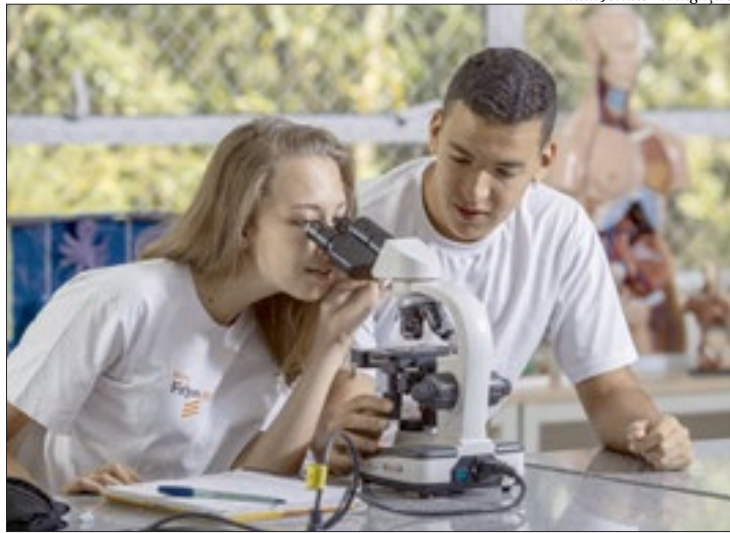
Provas serão em 2 de dezembro com 50 questões de diversas disciplinas

no site da Escola Firjan Sesi. Em São Gonçalo, os cursos oferecidos para a formação técnica são os de Automação Industrial, Planejamento e