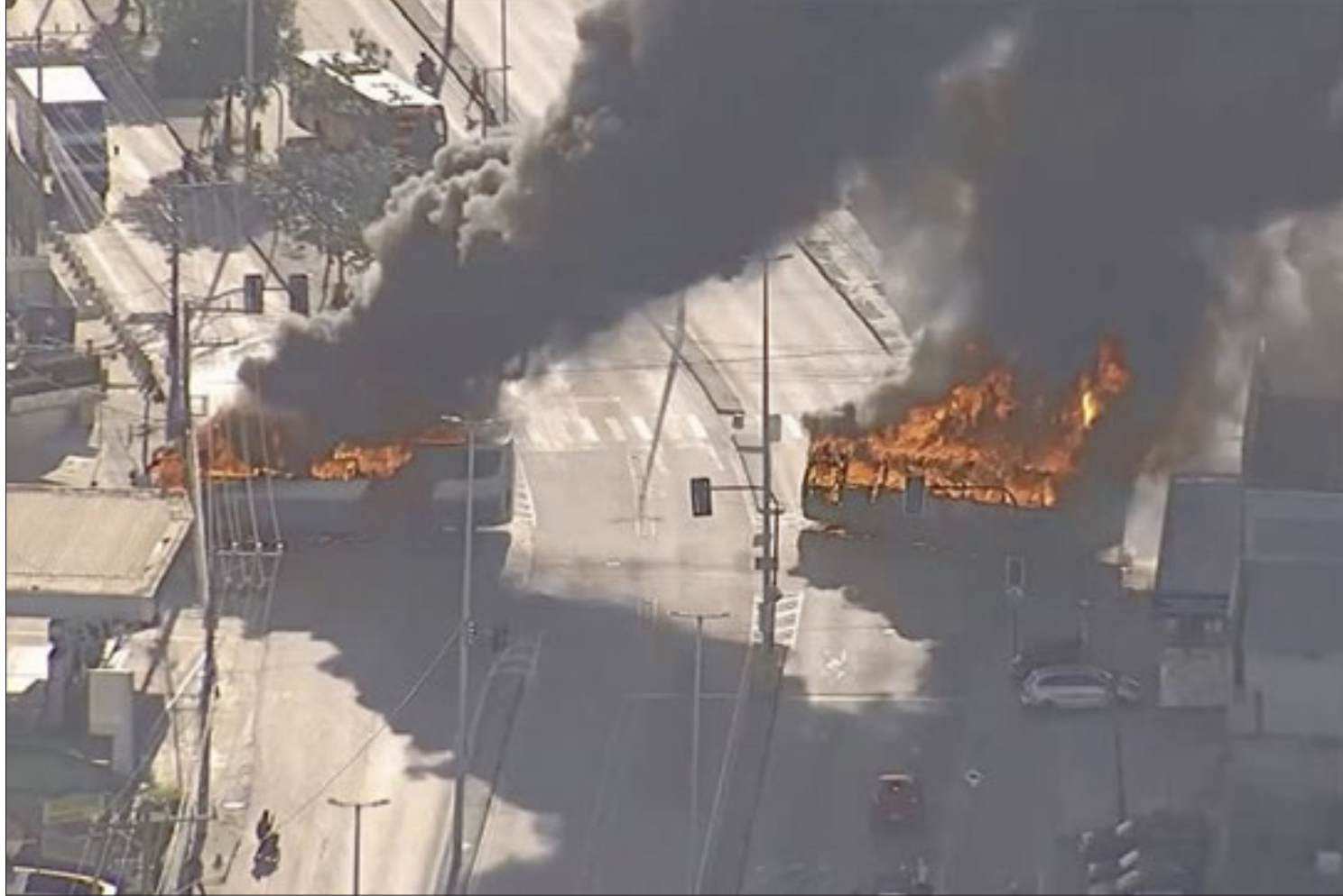
Pelo menos 35 ônibus foram incendiados na zona oeste da capital fluminense, segundo o Sindicato das Empresas de Ônibus da Cidade do Rio (Rio Ônibus)

Em coletiva de imprensa, na noite desta segunda-feira, Castro admitiu que as forças de segurança foram pegas de