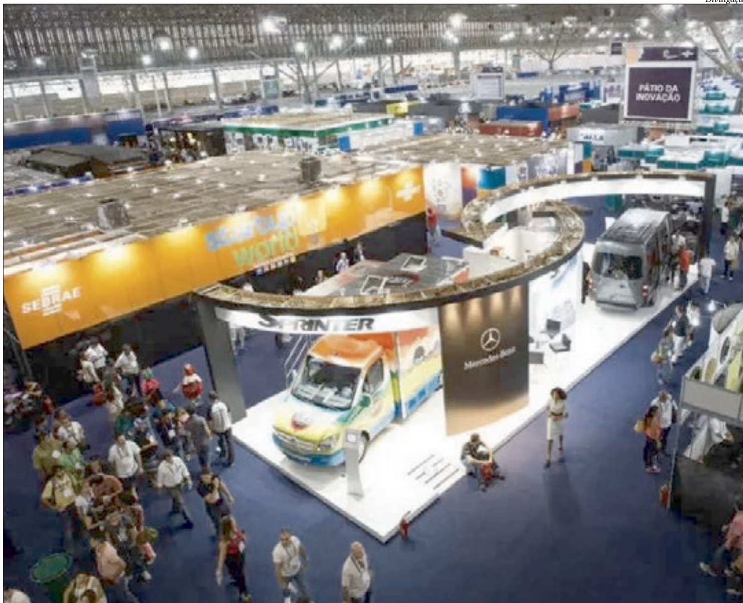
Entre as novidades da edição deste ano, está o Espaço Geek, que apresentará as principais tendências de mercado para quem empreende neste nicho