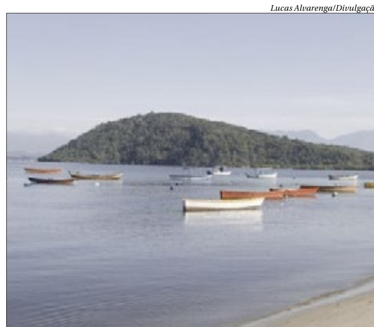
Praia das Pedrinhas é um dos locais mais bonitos de São Gonçalo

O projeto busca criar um ambiente propício ao crescimento e à prosperidade dos pequenos negócios relacionados à economia do mar na região da Praia das Pedrinhas, melhorando sua capacidade empreendedora, impulsionando a competitividade e ampliando as oportunidades de negócios, contribuindo assim para o desenvolvimento econômico sustentável de São Gonçalo e arredores. ■