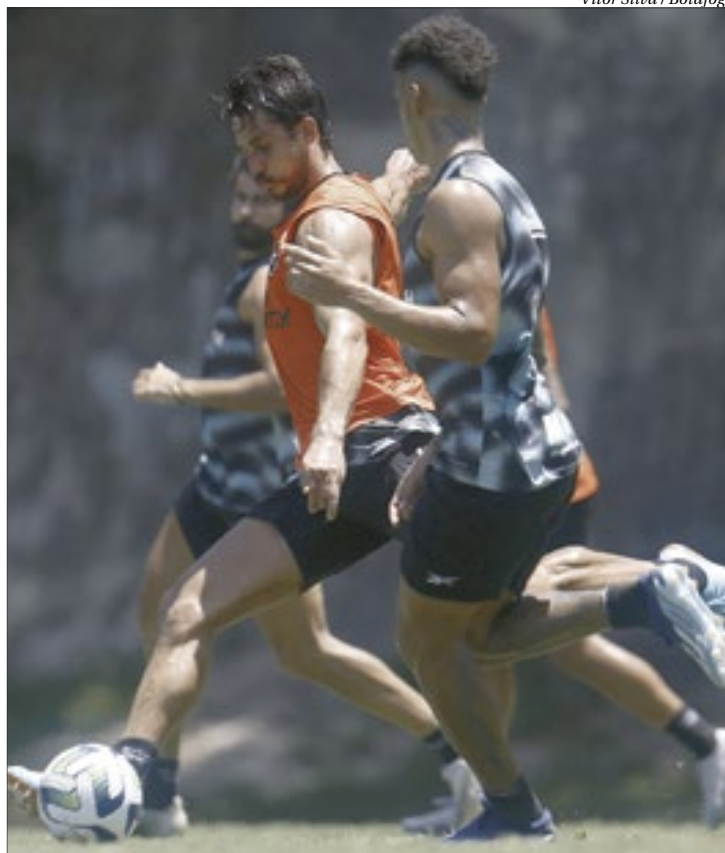
Botafogo iniciou ontem a preparação para o jogo contra o Cuiabá no domingo

Os cariocas podem ver a vantagem na liderança diminuir no meio de semana. Isso porque o vice-líder Red Bull Bragantino vai encarar