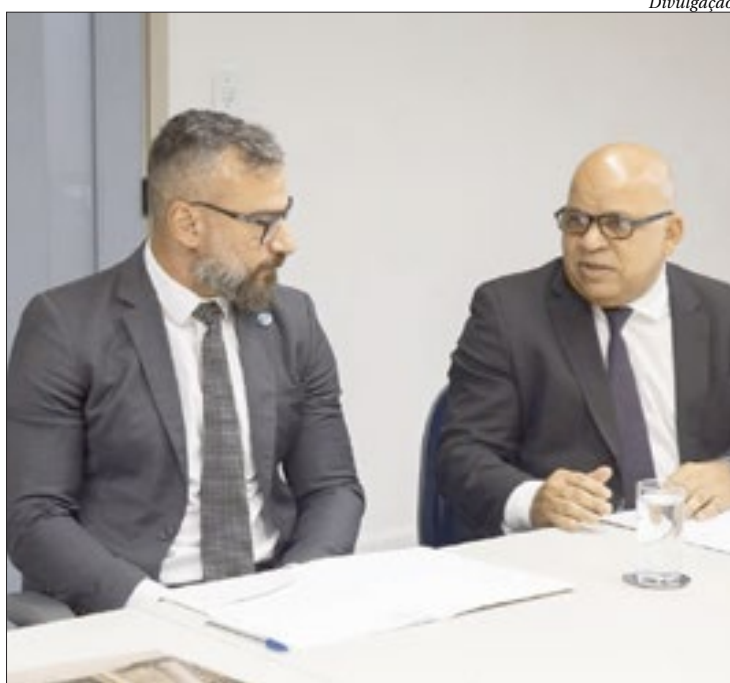
Secretário de Polícia Civil foi recebido ontem no Ministério Público do Estado do Rio

“Essa reunião buscou definir um plano de ação, entre o MPRJ e a Polícia Civil, para