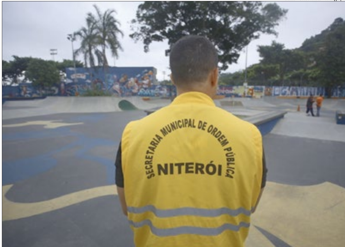
Serviço de Abordagem Social é contínuo e é feito rotineiramente pelos agentes e técnicos da Assistência Social

As equipes estiveram em dois pontos do bairro na Zona Sul da cidade. O entorno da praça do Skate Park e a calçada da agência da Caixa Econômica Federal foram os focos da ação desta manhã. Um homem de 44 anos aceitou ir para o acolhimento municipal e outros dois foram atendidos pela equipe do Samu. Niterói conta atualmente com 70% de ocupação nas mais de 350 vagas de