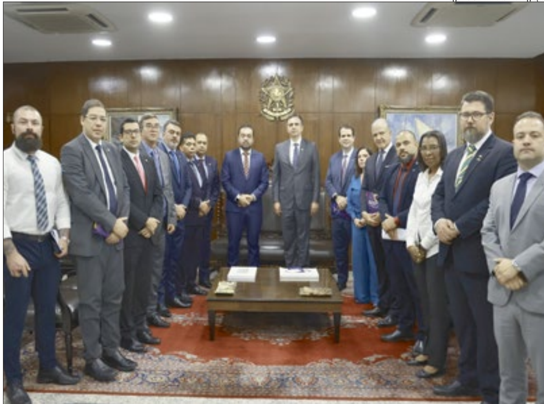
Deputados da bancada fluminense acompanharam o governador nas reuniões no Senado e na Câmara Federal

“Isso não envolve a divisa do Rio de Janeiro com outros estados, que já estão exatamente sendo objeto de atuação da Força Nacional com a Polícia Rodoviária Federal. Me refiro às fronteiras brasileiras, porque