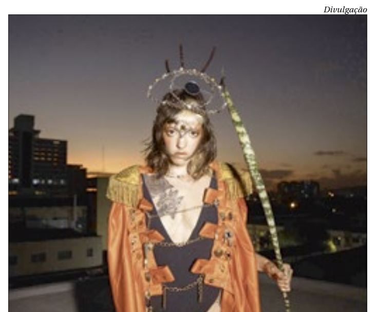
Apresentação de “TRANSES” acontece, nesta sexta (27), às 19h

Ingresso a R$10 (inteira). Endereço: Rua Padre Anchieta, 56, São Domingos.