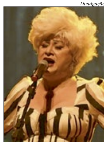
Espectáculo “Sob Medida” no Municipal de Niterói, nesta quinta, às 19h