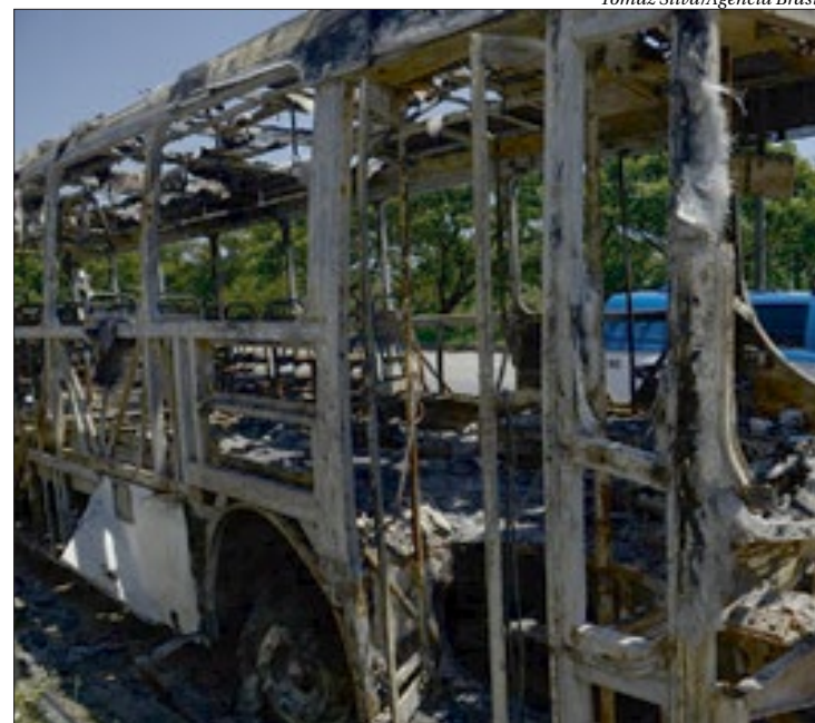
Empresas relatam que rodoviários ainda sofrem ameaças de criminosos

A Secretaria de Estado de Polícia Militar informou que “o policiamento permanece reforçado, diuturnamente, em toda a Zona Oeste, bem como em vias expressas e rodovias que fazem conexão com os bairros afetados”. ■