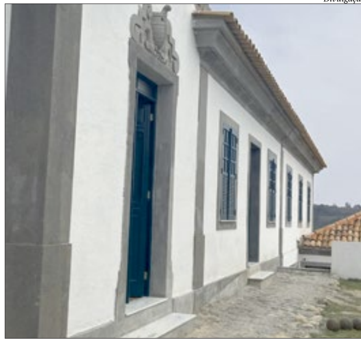
Ilha da Boa Viagem: toda sexta serão abertas inscrições para as visitas

Em caso de cancelamento do agendamento, por parte da Neltur, o inscrito receberá, no e-mail, um link para realizar seu reagendamento, que deverá ser feito numa das datas disponíveis para a semana seguinte àquela que