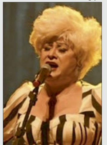
Espectáculo "Sob Medida" no Municipal de Niterói, nesta quinta