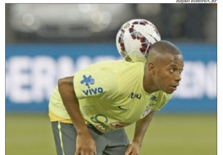
PGR defendeu que ex-jogador cumpra no Brasil a condenação pela Justiça italiana