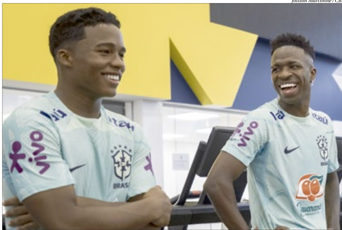
Endrick e Vinícius Júnior, convocados para a Seleção Brasileira, atuarão juntos no ano que vem pelo Real Madrid

Atacante do Real vê jovem de 17 anos com potencial para brilhar na Europa