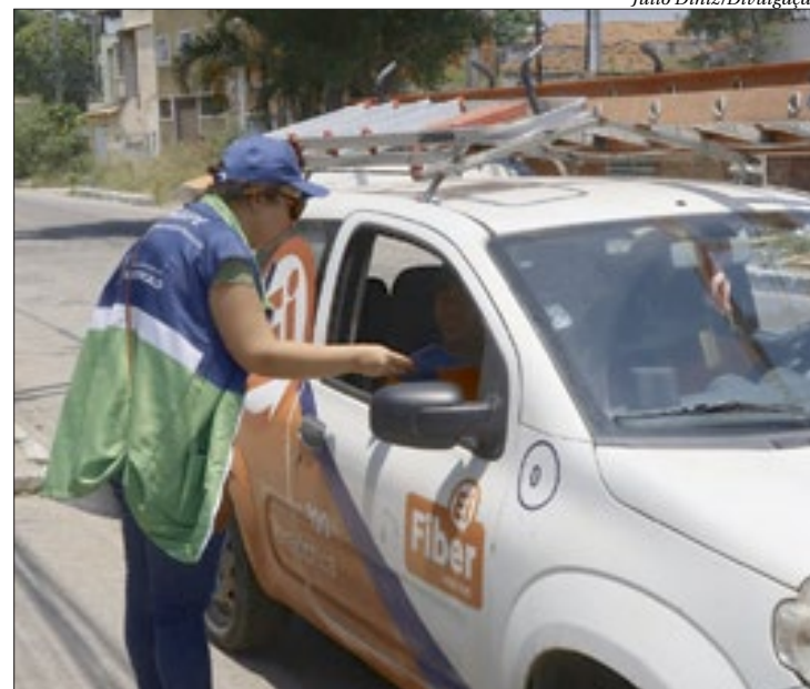
Prefeitura distribuiu material nos bairros de Neves e no Porto Velho

Uma equipe da Secretaria de Gestão Integrada e Projetos Especiais (Sengipe) da Prefeitura de São Gonçalo passou esta terça-feira (14) realizando a panfletagem nos bairros Neves e Porto Velho, para informar aos moradores e comerciantes que as obras da Mobilidade Urbana Verde Integrada (Muvi) estão avançando e, em breve, serão iniciadas as intervenções do trecho 1.