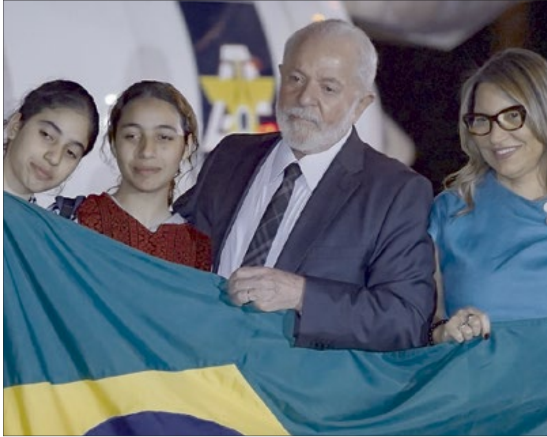
Lula recebeu, na madrugada desta terça-feira (14), o grupo de 32 brasileiros e palestinos parentes de brasileiros resgatados

“Tem mais gente na Cisjordânia e na Faixa de Gaza. Enquanto tiver lista e possibilidade da gente tirar uma pessoa, mesmo que seja uma só, a gente estará à disposição para mandar buscar as pessoas. Não vamos deixar nenhum brasileiro ficar lá por falta de cuidado do governo”,