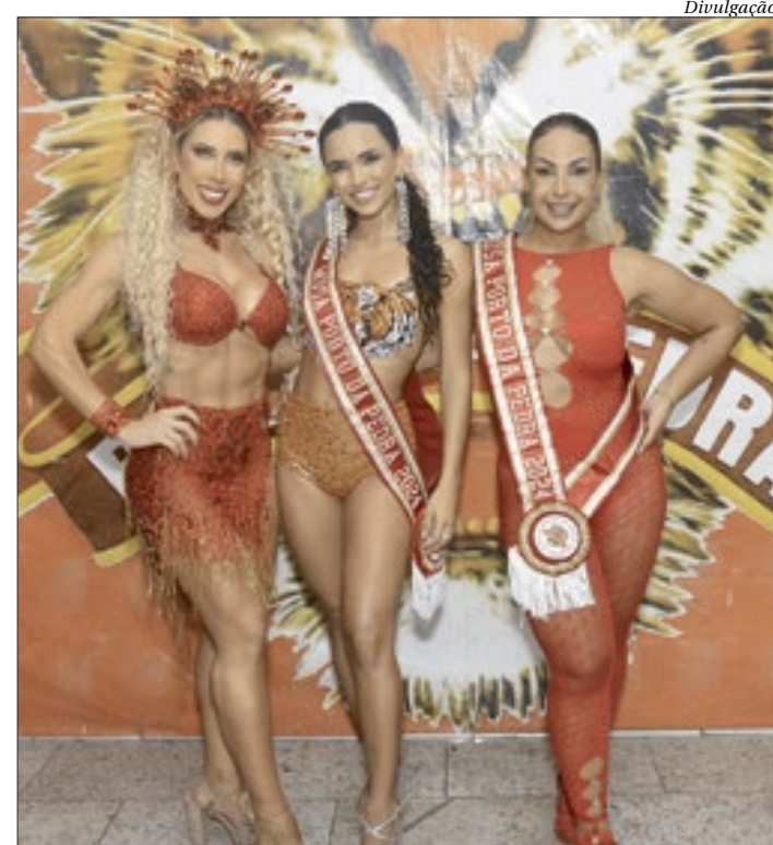
Valesca Popozuda ingressa no time de beldades da gonçalense Porto da Pedra