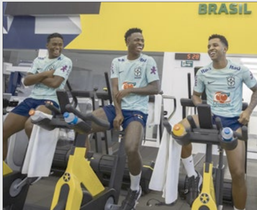
Trio Endrick, Vini Jr. e Rodrygo jogará junto a partir de junho do ano que vem no Real Madrid