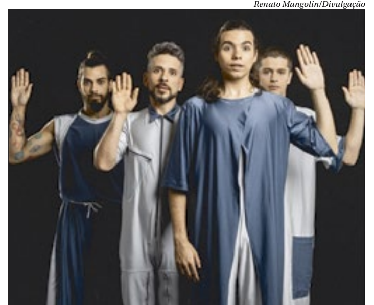
Espectáculo "Feio" estreia, nesta quinta (16), no Teatro Cacilda Becker

A temporada segue até o dia 3 de dezembro, com apresentações às quintas e sextas às 19h30; sábados, às 17h30h e às 19h30, e domingos às 16h e às 18h. O ingresso custa R$10 (inteira), no site Symppla.