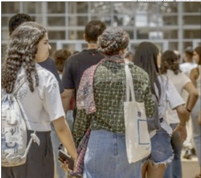
Exame foi concluído no domingo, com realização das últimas provas