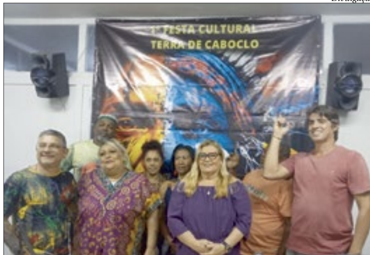
Grupo de axé niteroiense é responsável pela realização da comemoração

9h às 17 horas, no Horto do Barreto, com entrada franca. A celebração contará com várias manifestações culturais, como capoeira, dança cigana, comidas típicas, artesanatos, e gira de Umbanda festiva, em homenagem aos caboclos, e tudo termina com roda de samba. ■