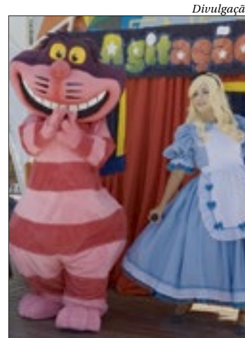
Festival Literário Energia para Ler, de quinta a sábado, em Tanguá

A praça Robson Siqueira Nunes, em Tanguá, será invadida pelo mundo da cultura e do entretenimento, desta quinta (16) até sábado (18), no Festival Literário Energia para Ler. O evento, que faz parte das celebrações pelo 28º aniversário da cidade, reúne teatro, dança, performances culturais, saraus e um café literário, com a participação de artistas locais e nacionais, incluindo figuras renomadas como o carnavalesco Milton Cunha e o ator Ricky Tavares.