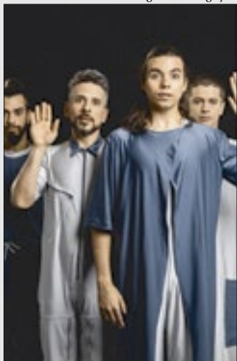
"Feio" estreia, nesta quinta (16), no Teatro Cacilda Becker, no Catete