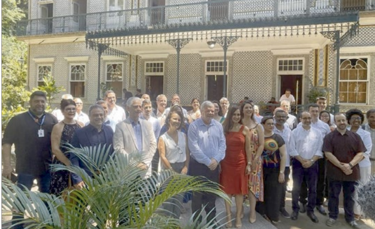
Lançamento do Polo Naval do Ecosistema de Inovação de Niterói reuniu empresários e autoridades em café da manhã no Solar do Jambeiro, em São Domingos

Para o prefeito Axel Graef, esse foi mais um passo para recuperação da Indústria Naval do Município. Durante o evento, o representante do Poder Executivo destacou que, com investimentos como o previsto para a