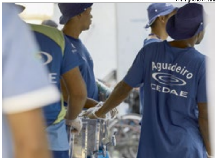
Água foi servida em copos biodegradáveis e garrafas puderam ser enchidas

- A Cedae e o Governo do Estado estão atentos e sensíveis aos efeitos dessa onda de calor e essa foi uma ação emergencial voltada, sobretudo, para quem usa o transporte público. Aproveitamos para pedir que as pessoas que puderem plantem as mudas, porque as árvores evitam o aquecimento das cidades. Assim, unimos soluções para