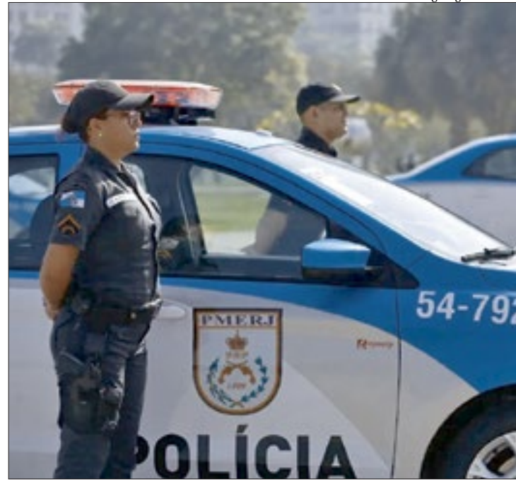
Para ministro, mulheres devem concorrer entre a totalidade das vagas

A discussão sobre a limitação da participação de mulheres em concursos militares começou após Cristiano Zanin suspender, no mês passado, o concurso da Polícia Militar do Distrito Federal. A medida foi tomada após o PT acionar a Corte para contestar uma lei local que também fixou limite de 10% de participação de mulheres no efetivo da corporação. ■