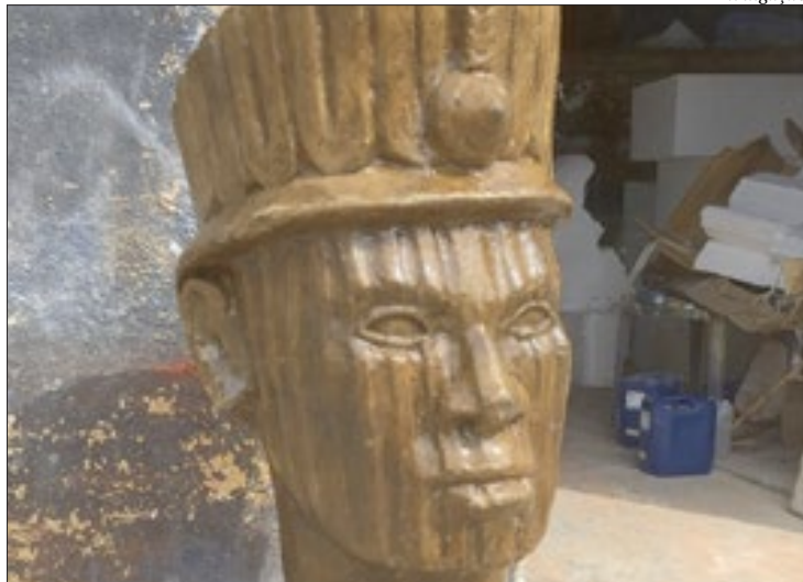
Cabeça de Zumbi ficará no ponto mais alto da via que liga Cubango e Fonseca

O objetivo dessa iniciativa é exaltar a raiz africana que ajudou na formação do bairro, principalmente, ao que