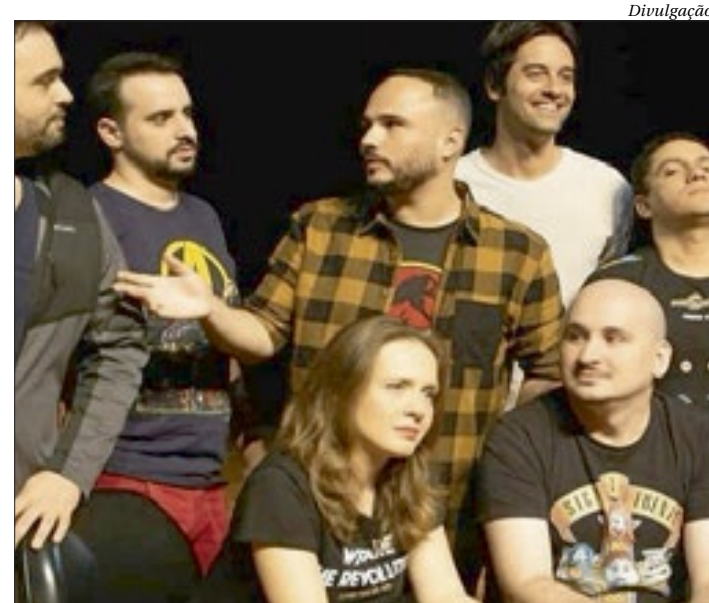
Castro Brothers apresenta o game “UTC”, nesta sexta, às 20h

O ingresso custa R$80 (inteira), no site Sympia.