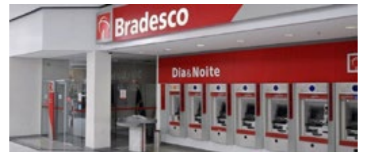
Problema atingiu usuários do aplicativo do Bradesco, na manhã da segunda (27)

No dia 27 de novembro, clientes do Bradesco foram surpreendidos ao constatarem saldos zerados ou negativos em suas contas bancárias. Apesar do banco atender a uma extensa base de mais de 71,7 milhões de clientes, um grupo reduzido de usuários foi afetado por uma falha no processamento noturno.