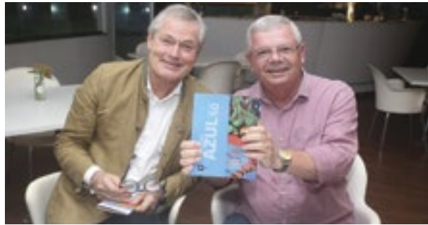
Prefeito de Niterói recebe visita de economista belga referência mundial em sustentabilidade

O prefeito de Niterói, Axel Graef, recebeu na sexta-feira (24), no Museu de Arte Contemporânea (MAC), a visita do economista, professor e autor belga Gunter Pauli, que é referência mundial em sustentabilidade. Gunter é conhecido internacionalmente como o criador do termo “Economia