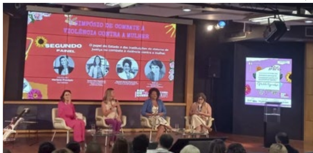
O Dia Internacional da Não Violência Contra as Mulheres é lembrado anualmente em 25 de novembro

Aconteceu na manhã de ontem (27) o I Simpósio de Combate à Violência Contra a Mulher, com o tema “Bem Me Quero. Reage, Mulher!”. O encontro, foi organizado pelo Disque Denúncia, através do Instituto MovRio, e aconteceu no auditório da Fecomércio, no Flamengo. Especialistas de diversas áreas que atuam no combate à violência contra a mulher destacam que, embora o Brasil tenha a 3º melhor lei do mundo, em relação a violência contra a mulher, ainda ocupa o 5º lugar no ranking mundial de países que mais matam mulheres, apenas pelo fato de serem mulheres. Durante o evento, foram compartilhados, para as mais de 120 pessoas que acompanharam a cerimônia, pontos, empresas e núcleos públicos que