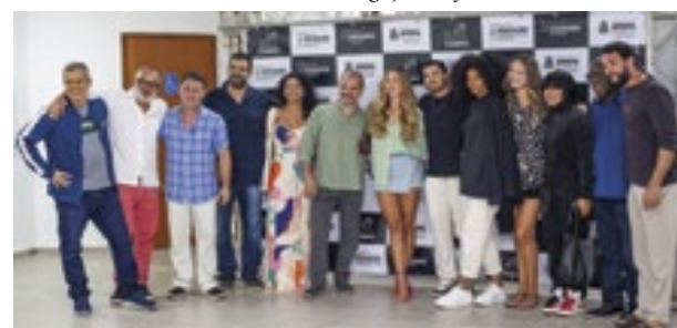
Evento reuniu atores, atrizes, produtores, roteiristas e outras personalidades