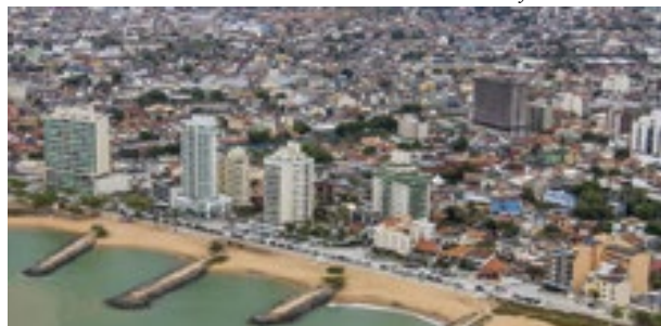
Imagens aéreas. Macaé/RJ. Data: 14/11/2014

Os vendedores ambulantes já cadastrados ou aqueles que querem iniciar a atividade no município de Macaé no exercício de 2024 devem fazer o recadastramento ou cadastramento na Coordenadoria de Fiscalização de Posturas. As inscrições para renovar ou obter a primeira li-