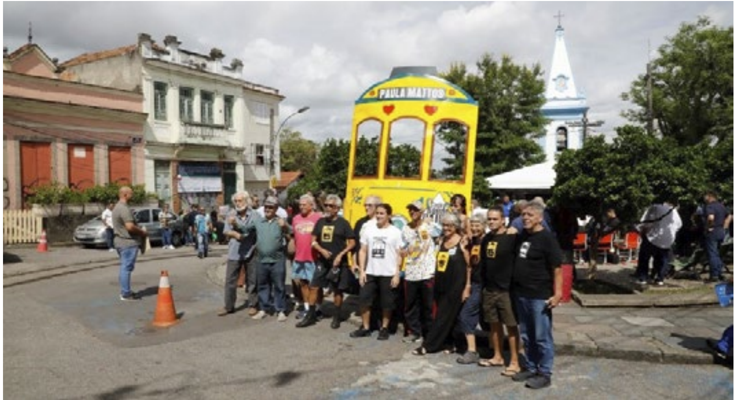
Obras de recuperação do sistema de bondes de Santa Teresa irá beneficiar mais de 40 mil pessoas

As obras incluem a recuperação dos mais de 6 quilômetros de extensão dos ramais Paula Mattos e Silvestre, paralisados há mais de dez anos, e a reforma da oficina de manutenção dos bondes. Sendo