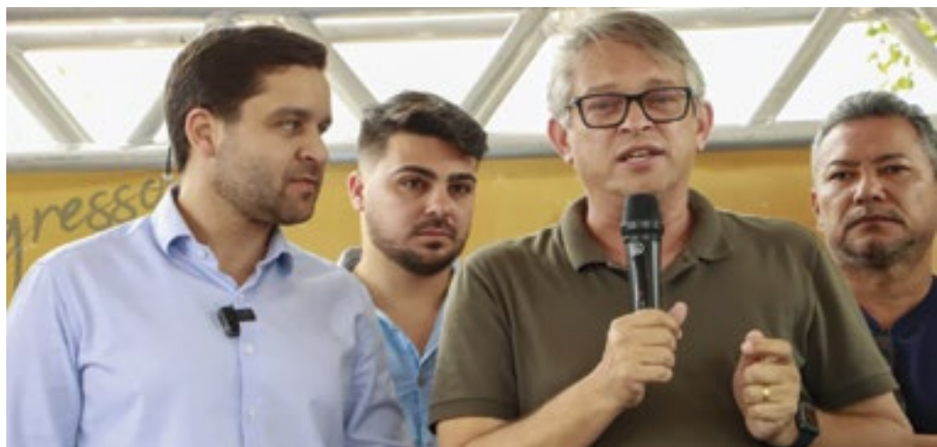
A parceria do Governo do Estado e a Prefeitura de Queimados tem como objetivo contribuir para minimizar as inundações das vias decorrentes das fortes chuvas.

A sirene foi testada para saber se o equipamento está em pleno funcionamento e se toda a comunidade consegue ouvir o sinal sonoro, que será acionado em caso de emergência. Com esses encontros a Defesa Civil pretende reforçar a segurança comunitária minimizando prováveis prejuízos materiais e perdas humanas.