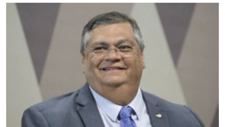
O ministro da Justiça, Flávio Dino, durante audiência no Senado

Recentemente, a presença da mulher de um líder do Comando Vermelho no Amazonas em uma reunião no Ministério da Justiça criou um cenário ainda menos favorável.