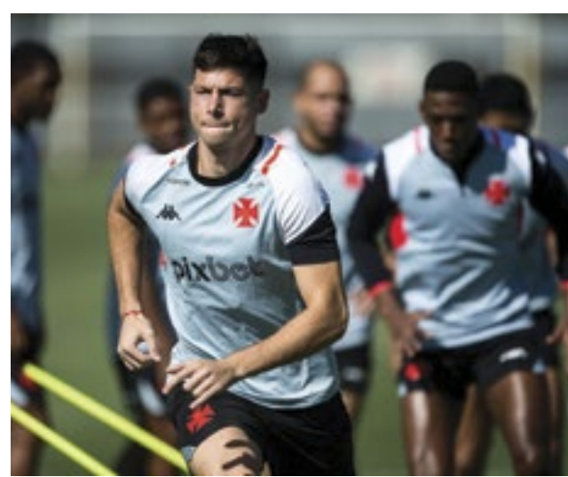
Escalção de Capasso contra o Corinthians na última rodada surpreendeu a torcida do Vasco