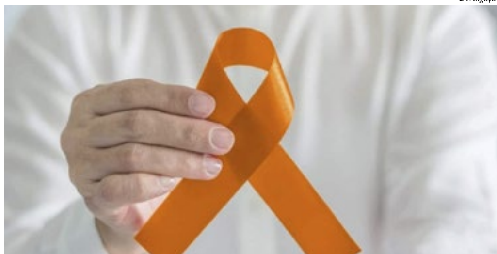
O HUAP/UFF fará cirurgias em quem está na fila da regulação; no Médico de Família da Colônia de Itaipu será possível fazer exames gratuitos

A campanha dezembro laranja tem por objetivo a prevenção e detecção precoce do câncer de pele. Depois do outubro rosa e novembro azul, agora é a vez do dezembro laranja de prevenção e detecção precoce do câncer de pele. Em Niterói, no sábado (2), haverá mutirão relacionado com a campanha, que é de âmbito nacional. Das 9h às 15h, o Hospital Universitário Antônio Pedro da Universidade Federal Fluminense (HUAP/UFF) vai realizar cirurgias de pacientes que estão na fila da regulação e atendimentos rápidos à população, como forma de prevenção do câncer de pele. O atendimento será por demanda espontâ-