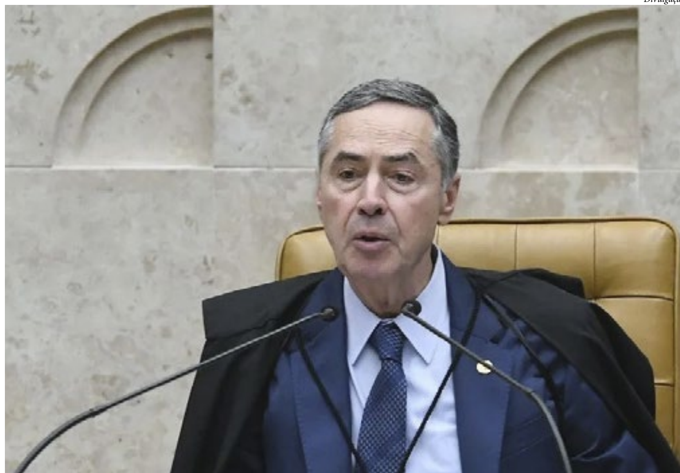
O ministro Luís Roberto Barroso, presidente do STF

Na quarta-feira (29), os ministros definiram critérios para que veículos de comunicação possam ser responsabilizados civilmente por declarações feitas por entrevistados em reportagens jornalísticas. Ficou definido que a empresa jornalística poderá ser responsabilizada quando houver publicação de entrevista em que o entrevistado acusar falsamente outra pessoa sobre a prática de um crime se: à época da divulgação da