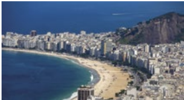
Vista aérea da Praia de Copacabana, Zona Sul do Rio de Janeiro

A empresa de viagens Decolar divulgou o ranking dos 10 destinos nacionais e 10 internacionais mais procurados durante a campanha de Black Friday, que aconteceu no dia 24 de novembro. O levantamento, realizado com base na busca por viagens no site e app, mostra São Paulo como os desti-