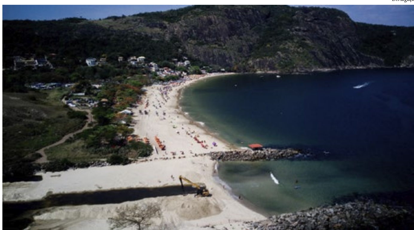
Prefeito de Niterói anuncia aprovação de financiamento para obras de estabilização do Canal de Itaipu

O prefeito de Niterói, Axel Grael, anunciou, nesta sexta-feira (01), que o Fundo Estadual de Conservação Ambiental (Fecam) vai aprovar o financiamento para a realização das obras de estabilização do Canal de Itaipu, na Região Oceânica. O investimento será de R$ 28 milhões. O prefeito fez o anúncio durante a Conferência sobre o Clima da Organização das Nações Unidas (COP 28), em Dubai, nos Emirados Árabes, ao lado do vice-governador do Rio e secretário estadual de Ambiente e Sustentabilidade, Thiago Pampolha, e do presidente do Instituto Estadual do Ambiente (Inea), Philippe Campello. O financiamento será aprovado na próxima segunda-feira (04), na reunião do comitê do Fecam. O prefeito Axel Grael destacou a importância da obra de estabilização do Canal de Itaipu.