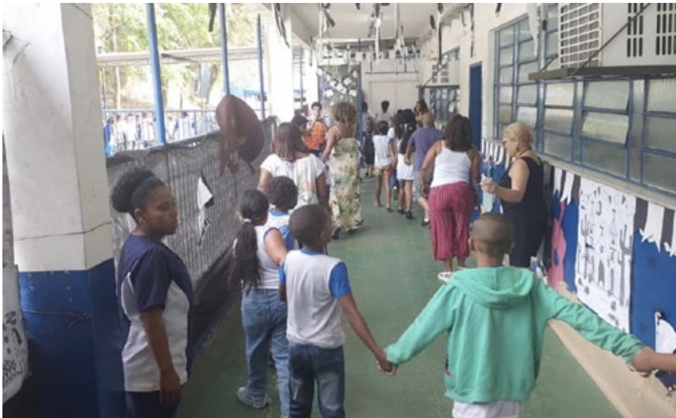
O total pactuado pelo programa no Estado é de R$ 166,7 milhões

O Estado do Rio de Janeiro tem 44.618 matrículas garantidas no projeto Escola em Tempo Integral do Governo Federal. O Ministério da Educação já repassou R$ 19,3 milhões para 78 municípios fluminenses implementarem o estudo com carga ampliada. Até o fim de dezembro, haverá novos repasses. O total pactuado pelo programa no Rio de Janeiro é de R$ 166,7 milhões. Os recursos vão garantir 11.305 matrículas na rede estadual de ensino e outras 33.313 matrículas na rede municipal. O Rio de Janeiro é a cidade com maior número de matrículas previstas no estado. São 8.754 e um valor total pactuado de R$ 22,3 milhões. Na sequência dos cinco municípios com maior número de matrículas estão Duque de Caxias