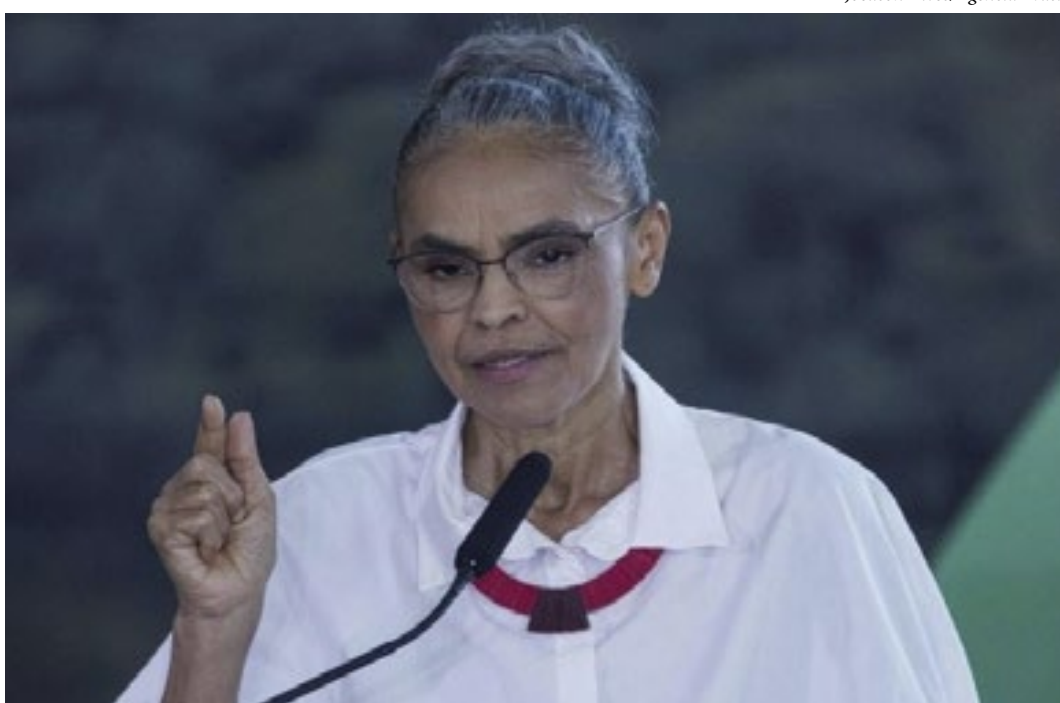
Entre as condições estão que o Brasil participe como observador e de que a entidade discuta economia verde

Para a ministra, o grupo é capaz de ajudar o mundo na transição ecológica. “O Brasil pode ter uma matriz energética 100% limpa e ajudar o mundo a que também faça sua transição energética com hidrogê-