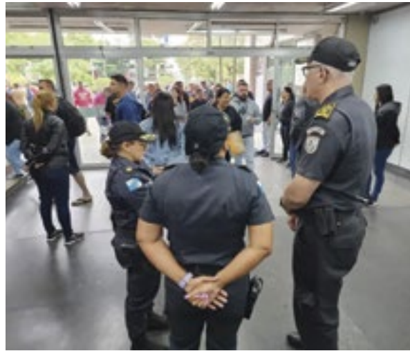
PM faz operação contra fraude em concurso da corporação no RJ

O processo seletivo do concurso de soldados da Polícia Militar do Rio será retomado pela Fundação Getúlio Vargas. A autorização da contratação foi publicada na sexta-feira (1º) no Diário Oficial.