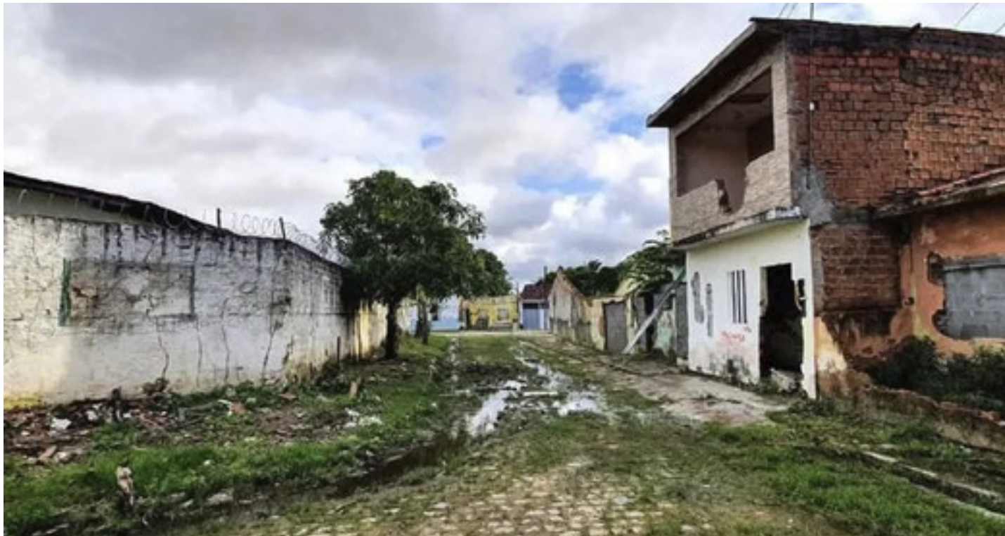
Região sob alerta diante de risco de colapso em uma mina da Braskem em Maceió (AL)

A cidade permanece sob alerta diante do risco de colapso da mina 18, localizada na Lagoa Mundau. Na quinta-feira 30, a Defesa Civil determinou que a população evite transitar pela região. A situação é mais grave nos bairros de Mutange,