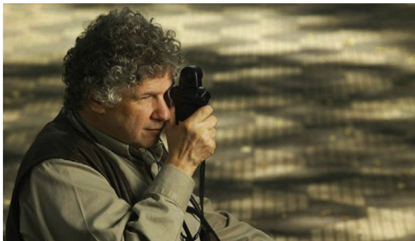
O documentarista Silvio Tandler em foto de 2004

O cineasta Silvio Tandler será homenageado na abertura da 13ª Mostra Cinema e Direitos Humanos, na próxima quarta (6), no Cine Arte UFF (Universidade Fe-