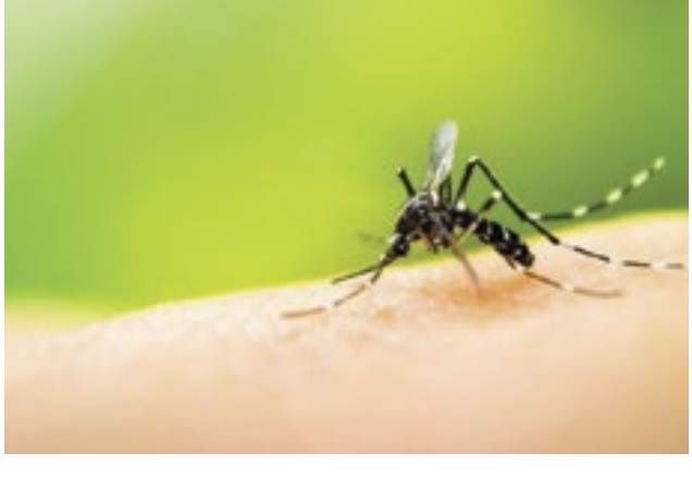
Destaque: Reprodução / Ministério da Saúde

na faixa de 28 a 32 graus, o Aedes aegypti se adapta facilmente a mudanças, como as provocadas pelas recentes ondas de calor extremo. As pessoas que têm o hábito de armazenar água em baldes, barris, caixas d'água no chão, devem ter mais cuidado. Esses criadouros precisam estar protegidos, bem fechados, tampados. O Aedes aegypti pode se desenvolver da fase de ovo até a fase de mosquito em apenas 7 dias. Uma fêmea, por exemplo, pode colocar centenas de ovos durante sua vida. Ou seja, em sete dias, se a pessoa não tiver esse cuidado, podem nascer 100 mosquitos da dengue na sua casa. Por isso, dedique 10 minutos por semana, para eliminar os criadouros do mosquito e proteger sua família contra a dengue, a chikungunya e a zika.