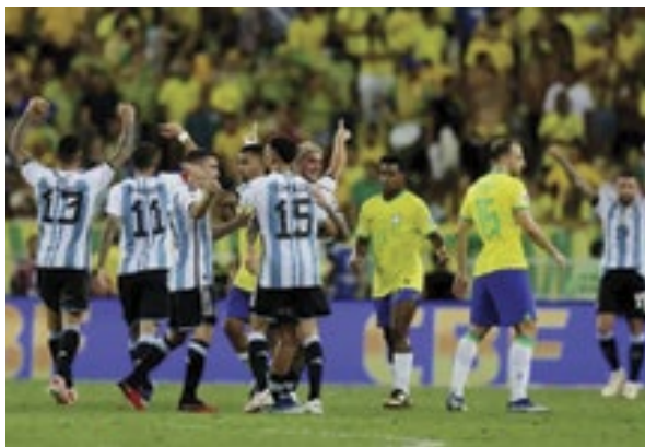
O ranking de seleções da Fifa é divulgado justamente após duas derrotas da equipe comandada pelo técnico Fernando Diniz

O Brasil caiu para a 5ª posição do ranking de seleções da Fifa após as derrotas para a Colômbia e a Argentina em jogos válidos pelas Eliminatórias Sul-Americanas para a Copa do Mundo de 2026. A liderança continua a ser da atual campeã mundial Argentina, segun-