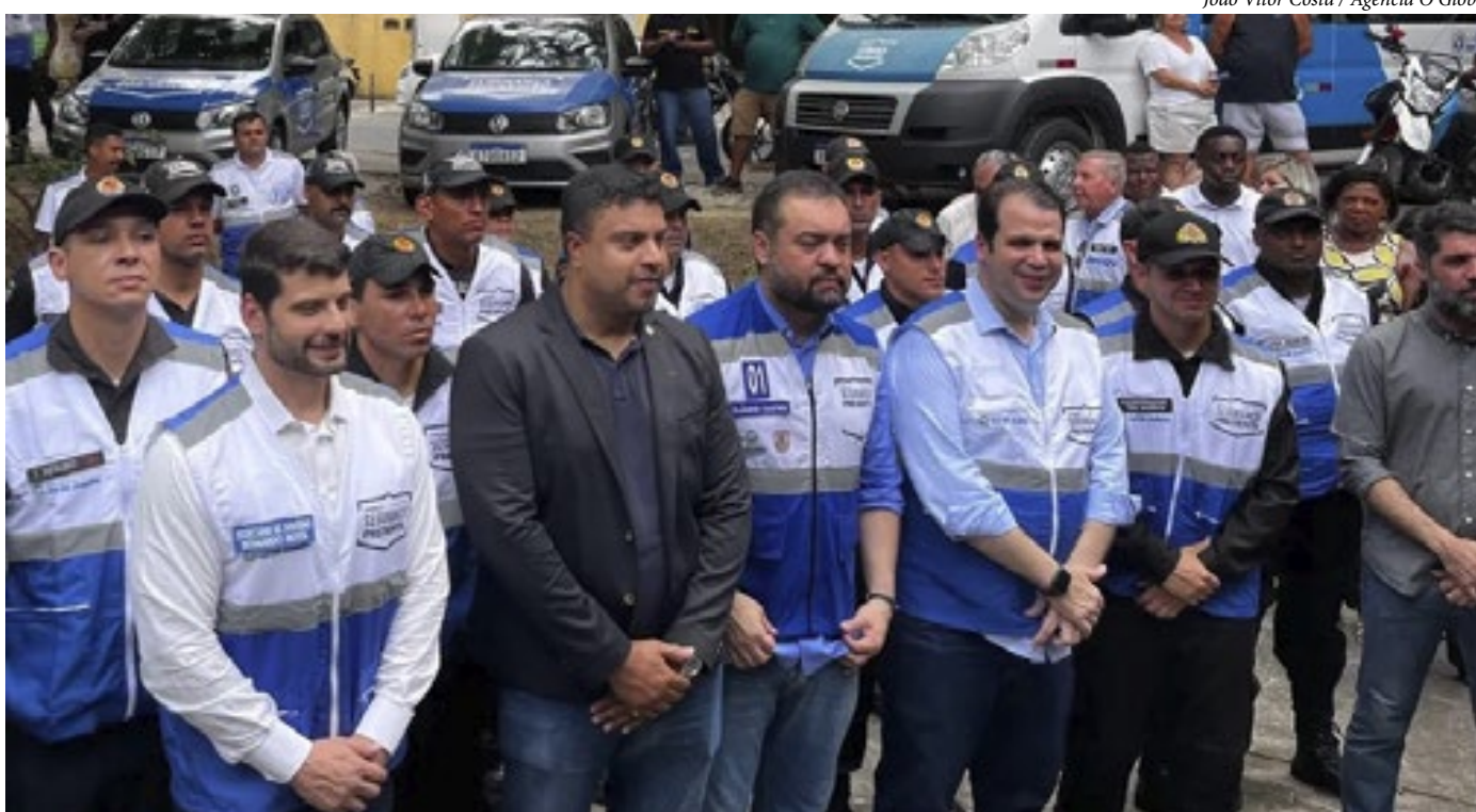
O governador Cláudio Castro (ao centro, de colete e camisa azul escuro) em cerimônia do Segurança Presente

— As entidades associativas lutam pela classe, não pela população. Terça-feira estou mandando uma mensagem para a Assembleia (Legislativa). A inconstitucionalidade é se eu (não) poderia criar por decreto (mas, sim) por projeto de lei: na verdade, o procedimento do governo, desde a decisão do Tribunal de Justiça deste ano, é criar por decreto, para que o efeito seja ime-