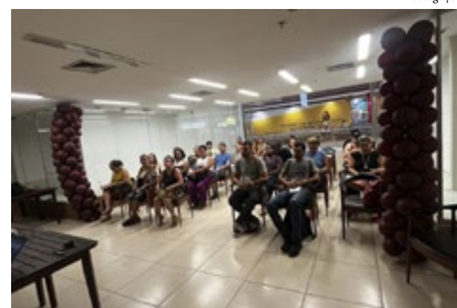
Palestra Descomplica MEI atrai interessados em abrir o próprio negócio