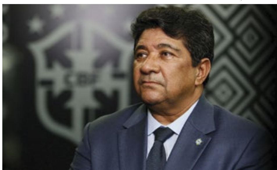
Ednaldo Rodrigues foi destituído do cargo de presidente da CBF pelo TJ-RJ

O Santos sacramentou seu rebaixamento após perder para o Fortaleza por 2 a 1, na Vila Belmiro. Como o Vasco venceu o Red Bull Bragantino por 2 a 1 e o Bahia goleou o Atlético-MG por 4 a 1, a equipe comandada por Marcelo Fernandes acabou sendo a última rebaixada no Campeonato Brasileiro de 2023.