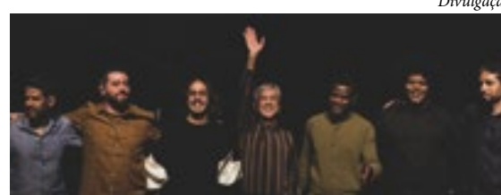
Caetano Veloso morou em Guadalupe quando era adolescente

Caetano Veloso vai cantar no evento que marca a inauguração da Areninha Cultural Terra, em Guadalupe. O show será na próxima terça-feira (12/12), a partir das 19h30, com entrada gratuita. O cantor e compositor morou em Guadalupe por um ano, quando ainda era adolescente, e ainda tem familiares por lá. Caetano cita Guadalupe na música "Pé do Meu Samba", feita para Mart'nália. Também na canção "Meu Rio", ele cita o bairro e diz: "Gua-