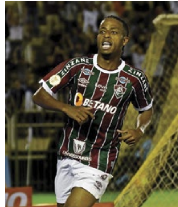
Com a camisa tricolor, Keno conquistou este ano o Campeonato Carioca e a Copa Libertadores