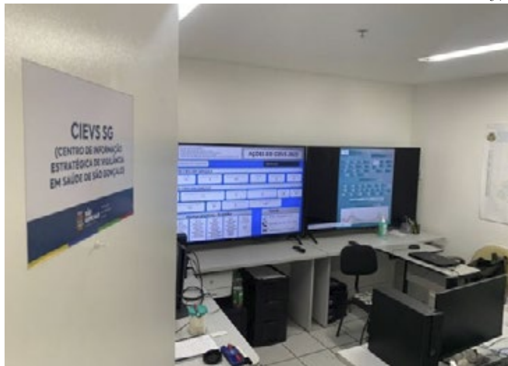
Município apresenta o Cievs, que monitora dados em tempo real

São Gonçalo apresentou no congresso o estudo sobre vigilância laboratorial dos painéis virais, prevenção e diagnóstico precoce de síndrome gripal (SR) e Síndrome Respiratória Aguda Grave (SRAG). O