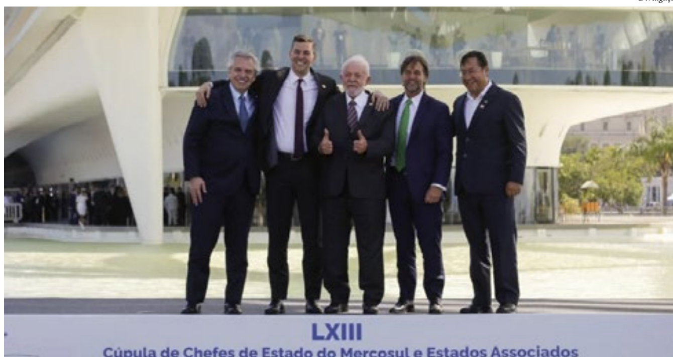
Da esquerda para a direita, os presidentes Alberto Fernández (Argentina), Santiago Peña (Paraguai), Lula (Brasil), Luis Alberto Lacalle Pou (Uruguai) e Luis Arce (Bolívia)

A 63ª Cúpula do Mercosul terminou na 5ª feira (7.dez.2023) com o aumento da preocupação dos países do bloco diante da iniciativa da Venezuela de querer anexar parte do território da Guiana. No entanto, não houve críticas diretas ao presidente venezuelano, Nicolás Maduro. O encontro foi realizado no Museu do Amanhã, no Rio. O Brasil passou o comando do bloco ao Paraguai. O mandato é de 6 meses. O Mercosul é formado por Brasil, Argentina, Paraguai e Uruguai. A Bolívia assinou nesta edição do encontro o protocolo de adesão ao bloco depois de 8 anos de negociações. O país deverá ser integrado em até 30 dias. O comando do grupo é rotativo e as trocas acontecem a cada 6 meses. Em seu discurso de abertura, Lula disse que a América do Sul não quer guerra, que o Mercosul não pode ficar “alheio à