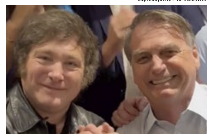
Na imagem, o ex-presidente Jair Bolsonaro e o presidente eleito da Argentina, Javier Milei, em encontro realizado na manhã desta 6ª feira (8.dez) em Buenos Aires

que 13 categorias de bens e serviços terão um IVA (soma de CBS e IBS) 60% inferior à alíquota padrão. Em um cenário hipotético cujo IVA seja de 27%, setores como saúde, educação, transporte e agropecuária pagariam 10,8% de imposto, por exemplo. Já os profissionais liberais, como advogados, engenheiros, jornalistas e médicos, entre outros, terão alíquota reduzida em 30% — o que, no cenário acima, representaria um IVA de 18,9%. A PEC também estabelece que dispositivos médicos, medicamentos e automóveis destinados a pessoas com deficiência, entre outros, tenham redução em 100% dos novos tributos.