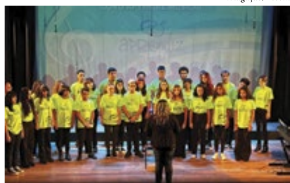
Programa Aprendiz Musical: apresentações de fim de ano este sábado, no Clube Canto do Rio

Um concerto tropical de Natal é a atração do projeto Domingo no Jardim, que acontece, neste domingo (10/12), às 11h, no Jardim Botânico do Rio de Janeiro. Alunos do projeto social de violinos Cariquinhas, formado por crianças e adolescentes, vão executar canções natalinas. O projeto é