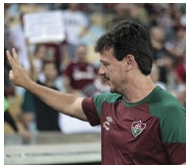
Fernando Diniz, técnico do Fluminense, vem trabalhando para manter o elenco focado para o Mundial de Clubes