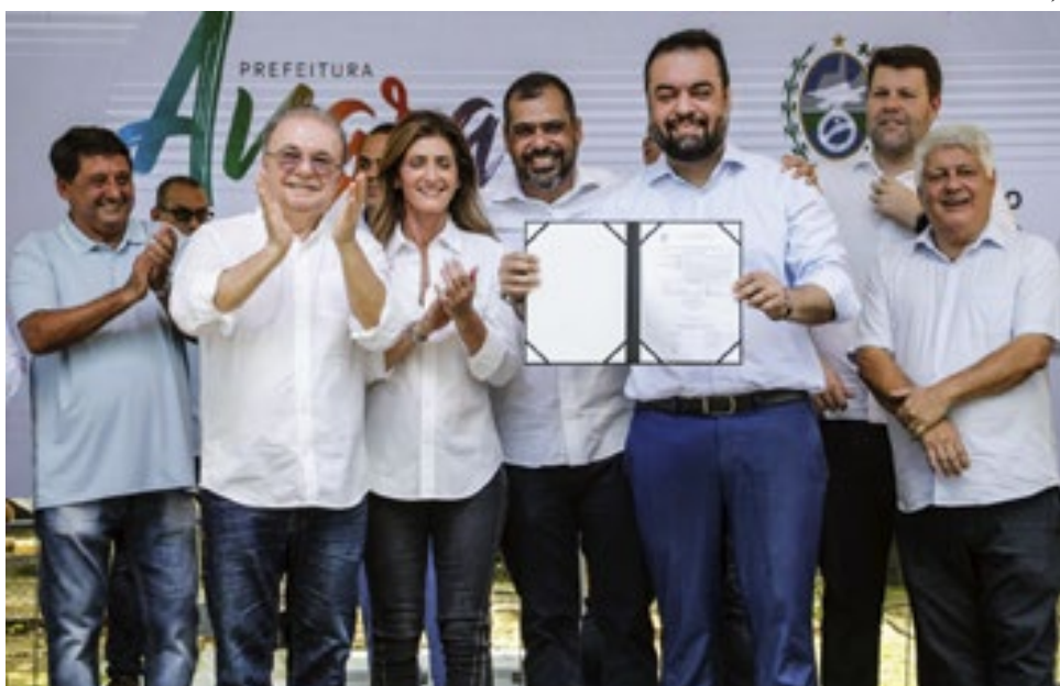
Cláudio Castro assina autorização para o início das obras de construção do Conjunto Habitacional da Monsuaba, em Angra dos Reis.

-Estamos aqui para construir mais que prédios e quadras. Estamos construindo oportunidades, lares e sonhos. Essas obras representam o compromisso do Estado em reconstruir não apenas estruturas, mas vidas, oferecendo um caminho digno para as famílias de Monsuaba - destacou o governador Cláudio Castro. As unidades habitacionais contarão com dois