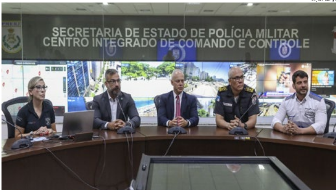
Cúpula da segurança se reúne no Centro Integrado de Comando e Controle (CICC) da Polícia Militar para discutir atuação no bairro de Copacabana.

A atuação das forças de segurança do Estado do Rio de Janeiro ganha reforço no bairro de Copacabana por determinação do governador Cláudio Castro. A nova orientação foi divulgada durante reunião realizada pela cúpula da segurança pública, que aconteceu nesta quinta-feira (7/12) no Centro Integrado de Comando e Controle (CICC) da Polícia Militar. Além das forças estaduais, a operação em conjunto conta com a atuação da prefeitura e demais órgãos da sociedade civil. O secretário de Estado de Segurança Pública, Victor dos Santos, falou sobre a importância da sinergia entre as entidades para que as ações sejam mais efetivas. -Na reunião alinhamos a missão dada pelo governador, que é de integrar e coordenar as ações desempenhadas pelos órgãos de