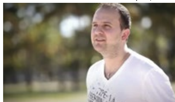
Homem já agenciou diversos artistas, como Victor e Léo e Claudia Leite