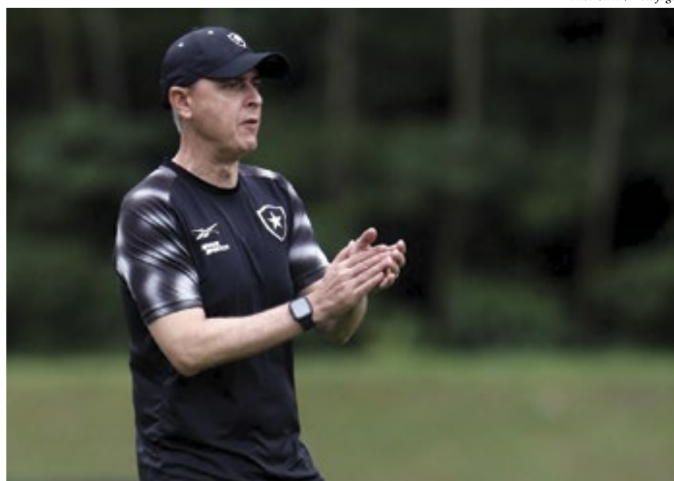
Vitor Silva / Botafogo