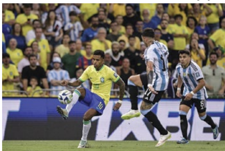
Seleção Brasileira é a atual vice-campeã da competição continental, perdendo a final para a Argentina