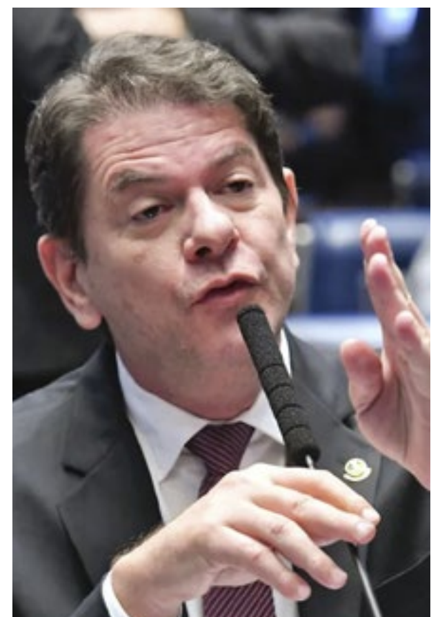
O senador Cid Gomes (PDT-CE) é apontado como possível relator da CPI da Braskem