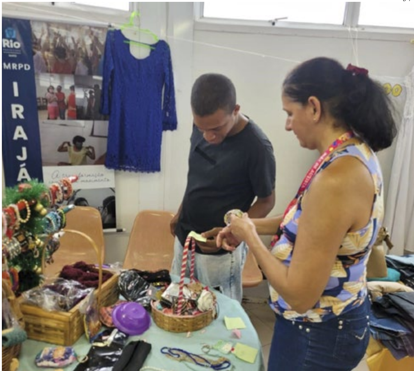
O Bazar dos Amigos funciona no Centro Municipal de Referência da Pessoa com Deficiência de Itajaí

A Secretaria Municipal de Saúde (SMS) realiza, nesta segunda-feira (11/12), programação especial no Instituto Municipal Nise da Silveira, no Engenho de Dentro, para a campanha do Dezembro Vermelho, o mês de conscientização e combate à Aids. Haverá palestras com médicos, infectologistas e psicólogos falando sobre o HIV e a importância da informação para a prevenção e a quebra de estigmas. A abertura do evento será às 12h, no auditório da CETAPE, com entrada gratuita.