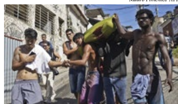
A ação no Alemão deixou 19 mortos, se igualando a outra registrada na mesma comunidade em 2007

Uma nova plataforma divulgada pelo Instituto Fogo Cruzado revelou que as chacinas policiais no Rio de Janeiro não são algo que ficou no passado, como as conhecidas chacinas da Candelária, Vigário Geral e Acari. Pelo contrário, elas são parte da política cotidiana de Estado. Segundo dados levantados, de sete anos para