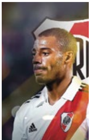
De La Cruz deve ser anunciado pelo Flamengo nos próximos dias