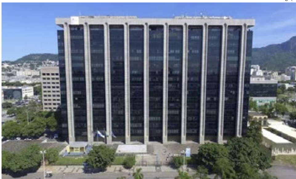
Sede da Prefeitura do Rio de Janeiro