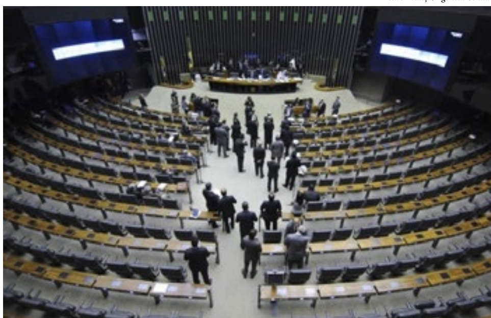
Com voto de petista, bolsonaristas conseguiram excluir dispositivo na reforma tributária que aumentaria taxa sobre armas de fogo

Entre esses teve até o voto de um petista, Josias Gomes (PT-BA), que descumpriu a orientação de seu partido e ajudou a garantir o único triunfo do grupo do ex-presidente na reforma tribu-