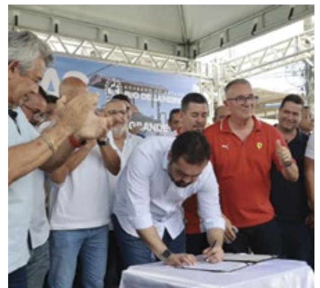
Governador Cláudio Castro assina termo de contrato para a duplicação do viaduto sobre a Via Dutra, durante entrega de obras em São João de Meriti