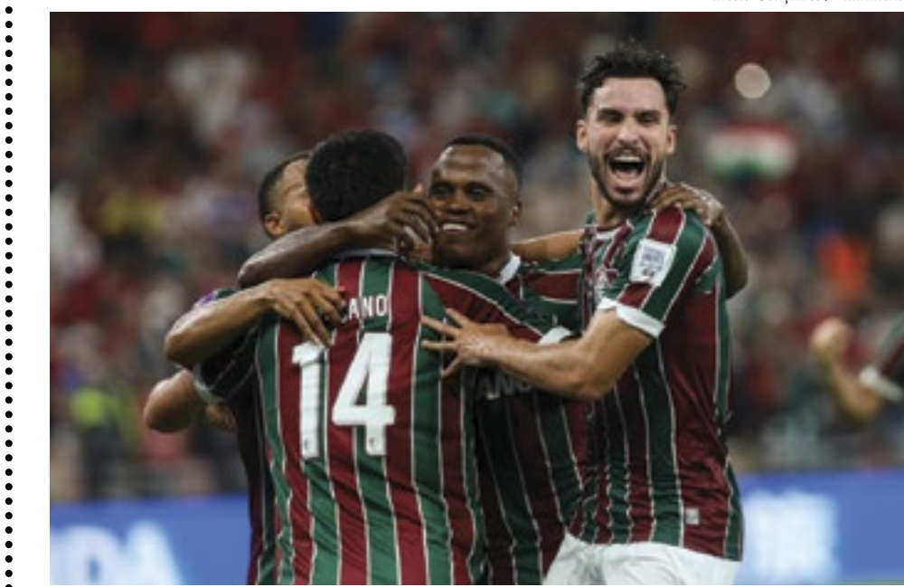
Finalista do Mundial de Clubes disputado na Arábia Saudita, Flu espera o vencedor do jogo entre Manchester City e Urawa Reds

Classificado em segundo lugar, o Paris Saint-Germain se livrou de um adversário mais difícil e pegou a Real Sociedad. Líder do grupo dos fran-