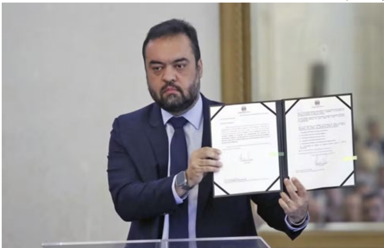
Governador Cláudio sanciona lei da Secretaria de Segurança Pública