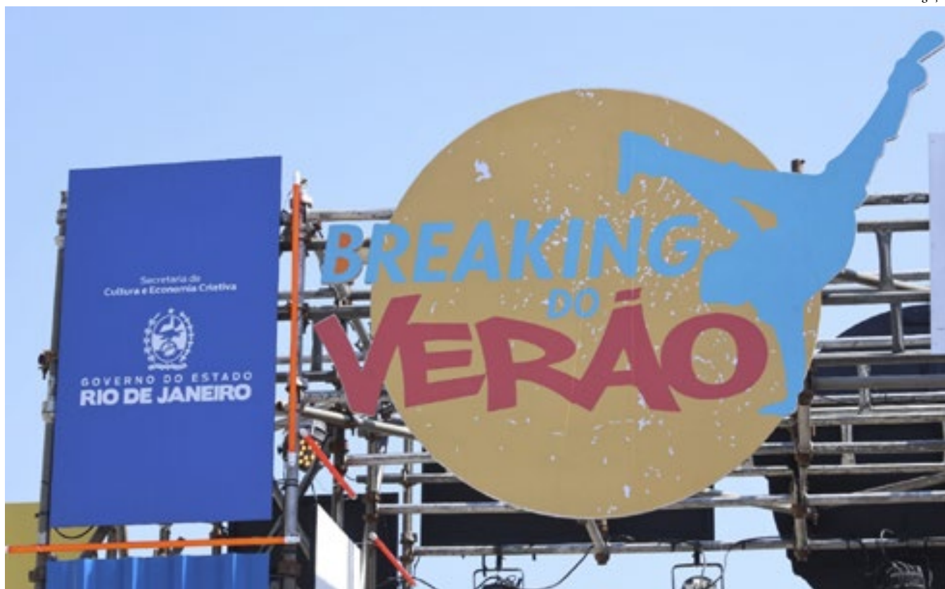
As áreas culturais com mais projetos patrocinados foram: Música e Dança, Teatro e Circo e Artes Plásticas e Artesanais.

- A cultura do nosso estado é rica, diversificada e democrática. O Rio de Janeiro é um território cultural e nós valorizamos isso. Investindo em cultura, fortalecemos a nossa economia, o turismo e outros setores. Investir na cultura é investir em todo o estado - afirmou o governador Cláudio Castro. Grandes eventos fizeram parte do calendário, como o Carnaval 2023, Festival de Inverno, Rio2C, Festival de Cinema de Vassouras, Rio Gastronomia, Festa do Tomate, ArtRio,