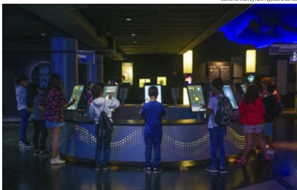
O Planetário do Rio oferece uma série de atividades para toda a família

A nave da ciência e da diversão está de volta. Depois de um breve jejum, devido a obras em sua cúpula, o Museu do Universo reabre suas portas, neste sábado (6/1), com uma série de atividades para toda a família. Além de sessões extras de filmes sobre astronomia, haverá novas exposições de fotografias, e, no dia 10, estreia o primeiro Luau do Planetário do Rio. Na estação mais festejada do ano, haverá ainda espetáculos promovidos pela companhia teatral Papa Vento e oficinas de educação ambiental do Ecofuture. Os ingressos para as visitas ao estáo à venda no site do Planetário do Rio. Às terças-feiras, a entrada no local é gratuita. Os portões do Museu do Universo serão reabertos no sábado, às 10h. Além