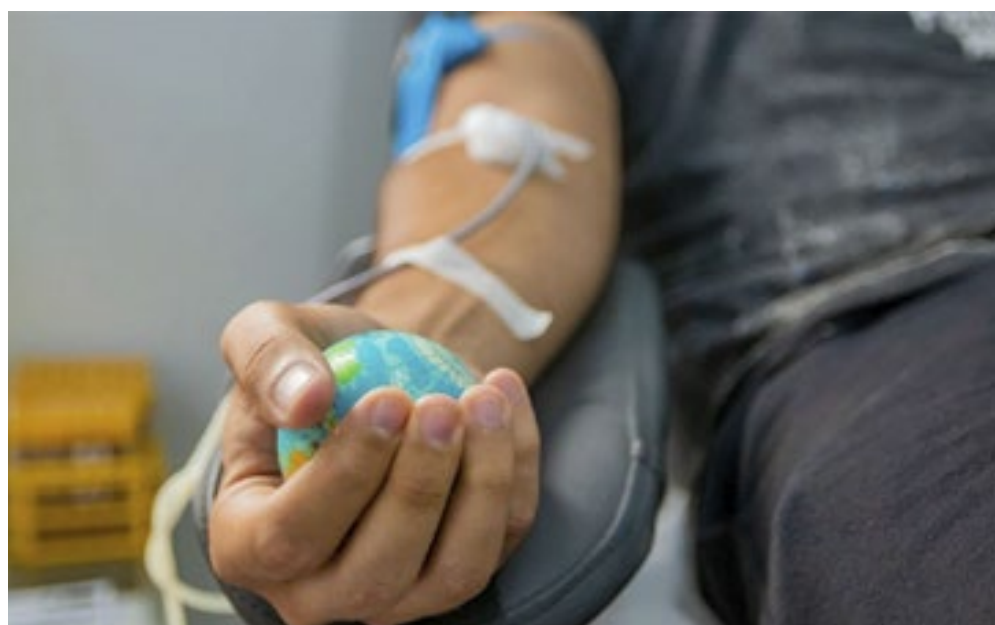
O estoque de sangue do Serviço Municipal de Hemoterapia de Macaé, no Norte Fluminense, está abaixo do estado considerado crítico, segundo a Prefeitura.

Outras informações podem ser obtidas pelo tele-