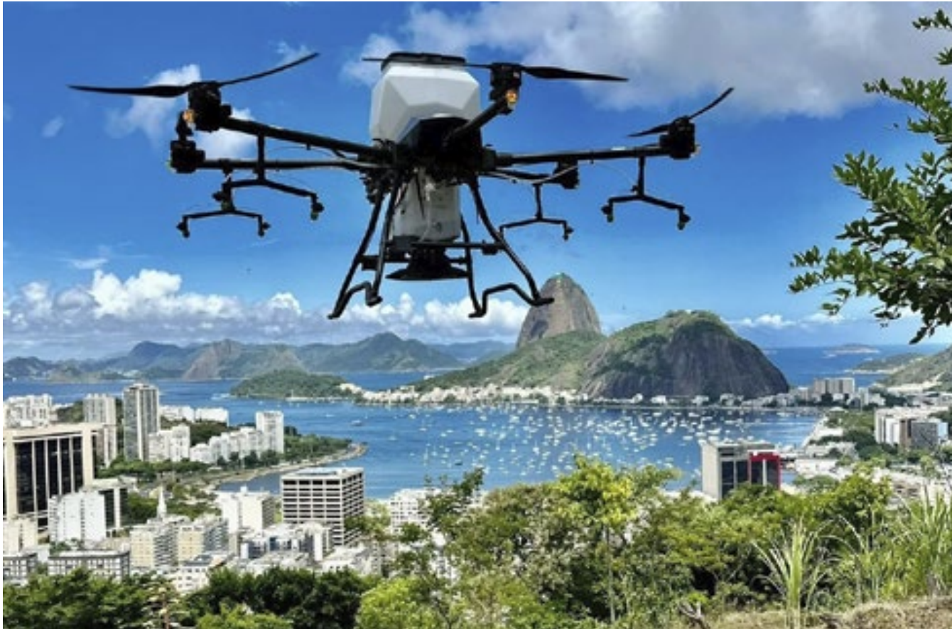
A demonstração da aplicação do equipamento ocorreu no Mirante do Pedrao, em Botafogo

A Prefeitura do Rio, por meio da Secretaria de Meio Ambiente e Clima, iniciou, nesta sexta-feira (5), o uso inédito de drones semeadores nos mutirões de reflorestamento. O prefeito Eduardo Paes e a secretária de Meio Ambiente e Clima, Tainá de Paula, acompanharam a demonstração da aplicação do equipamento no Mirante do Pedrao, em Botafogo, dentro do Parque Maciço da Preguiça. A adoção da nova tecnologia integra o plano de contingência para amenizar o impacto das ondas de calor para a população. O projeto-piloto desse novo método de trabalho de reflorestamento será na Floresta da Posse, em Campo Grande.