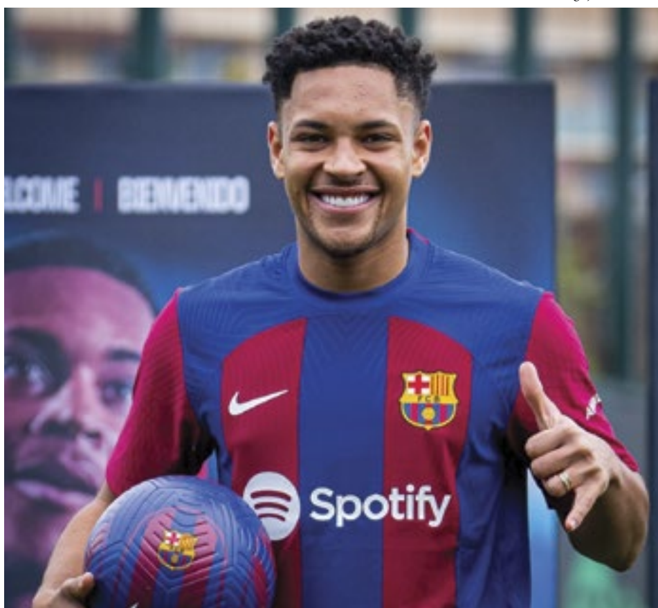
O atacante brasileiro Vitor Roque, de 18 anos, assinou contrato com o Barcelona até 2031

Após a vitória na estreia, o atacante Vitor Roque foi apresentado, na sexta-feira, no CT Joan Gamper. O evento é uma tradição do Barcelona.