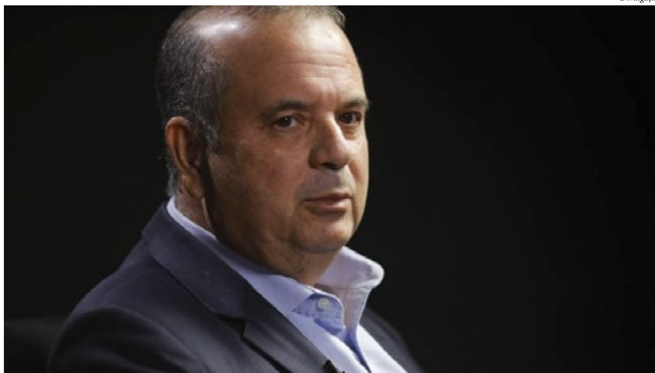
Texto é encabeçado pelo líder da Oposição no Senado, Rogério Marinho (PL-RN)

A nota de repúdio ao ato que será realizado na 2ª feira (8.jan.2024) condena “vigorosamente os atos de violência e a depredação dos prédios públicos ocorridos no dia 08 de janeiro de 2023,